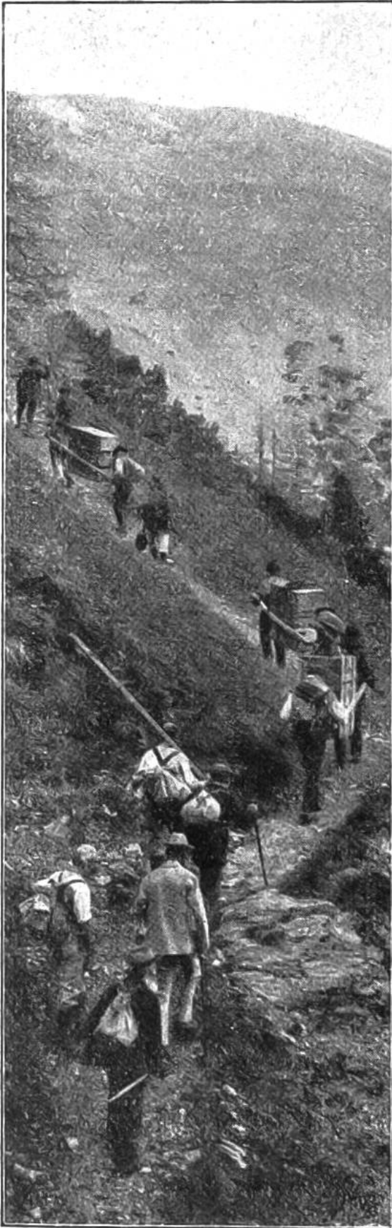
Einer der ersten Transporte von Steinwild zur Aussetzungsstelle.

weise dauerte es jedoch eine ganze Weile, bis der gute Wille in die Tat umgesetzt werden konnte; denn der Wiederaufbau eines Wildbestandes ist weit schwieriger als seine Zerstörung.