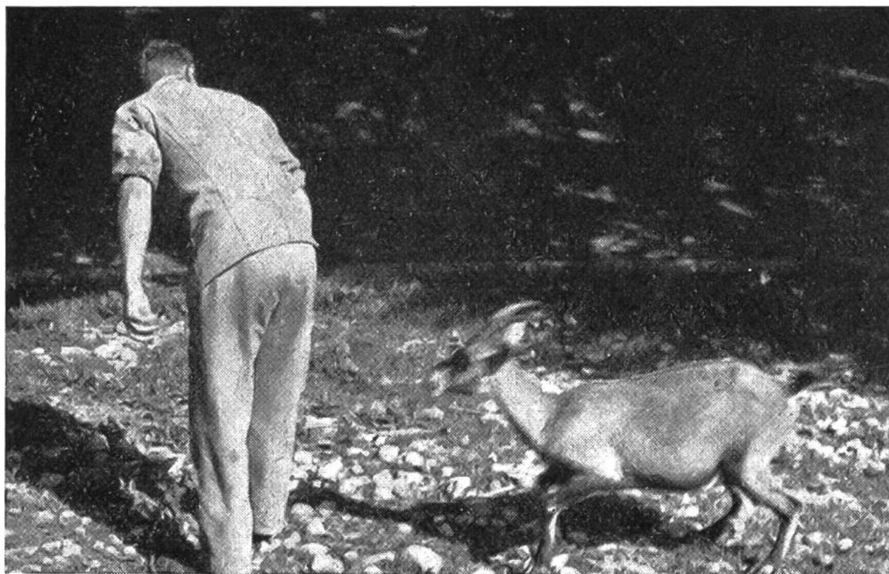
Die zahme Steingeiss nimmt einen Anlauf ....

waffnet betreten werden. Auch dann noch richtet sich der herrliche Bock gelegentlich vor dem Wärter hoch auf, wie er das sonst vor seinen vierbeinigen Rivalen zu tun pflegt, und umtanzt ihn drohend, so dass die Zuschauer ihre helle Freude haben. Häufig nimmt das kampflustige Tier den Besen auf die Hörner oder lässt seine Kraft an dem soliden Einräderkarren aus, wenn ihn der Wärter bei der Reinigung des Geheges kurze Zeit aus den Augen lässt. Im Gegensatz zu den Böcken sind die Geissen, die Weibchen des Steinwildes, sanft und liebenswürdig. Zutraulich kommen sie dem Pfleger entgegen, um sich am Bauch oder hinter den Ohren kraulen zu lassen. Oft sind sie so spiellustig aufgelegt, dass sie dem Wärter plötzlich von hinten her auf die Schulter springen, was ihnen offensichtlich ein ganz besonderes Vergnügen bereitet. Geradezu reizend sind die Kitze, die schon kurz nach ihrer Geburt mit verblüffender Sicherheit auf den steilsten Felszinnen herumhüpfen und selbst im übermütigsten Spiel niemals den Tritt verfehlen. Oft kommt es die Jung-