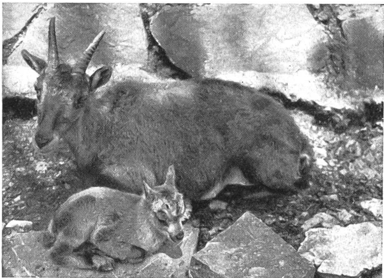
Steingeiss im Tierpark Dählhölzli (Bern) mit ihrem neugeborenen Kitz.