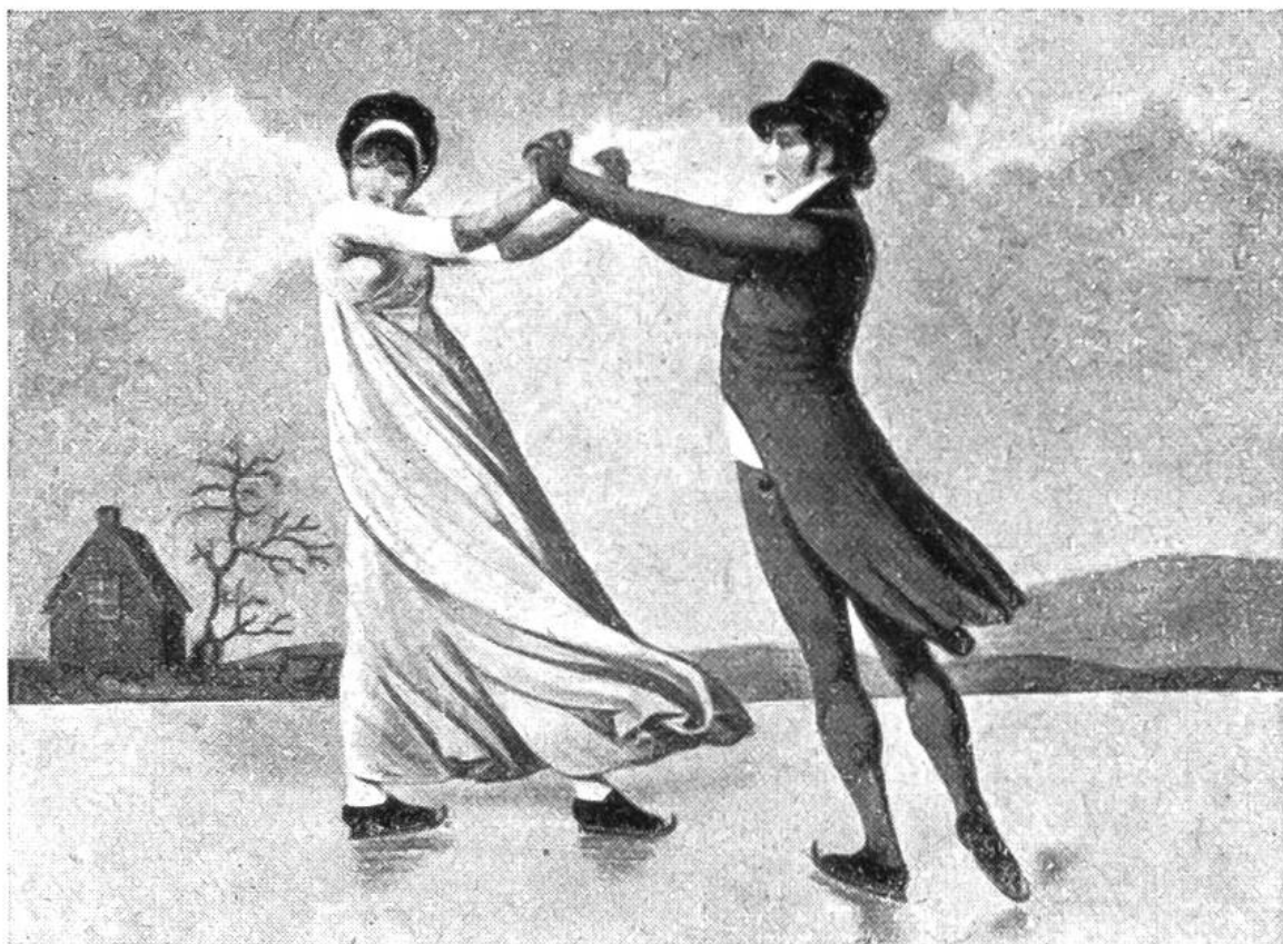
Eislauf-Paar auf einem zugefrorenen See. Englisches Gemälde aus dem Anfang des 19. Jahrhunderts.