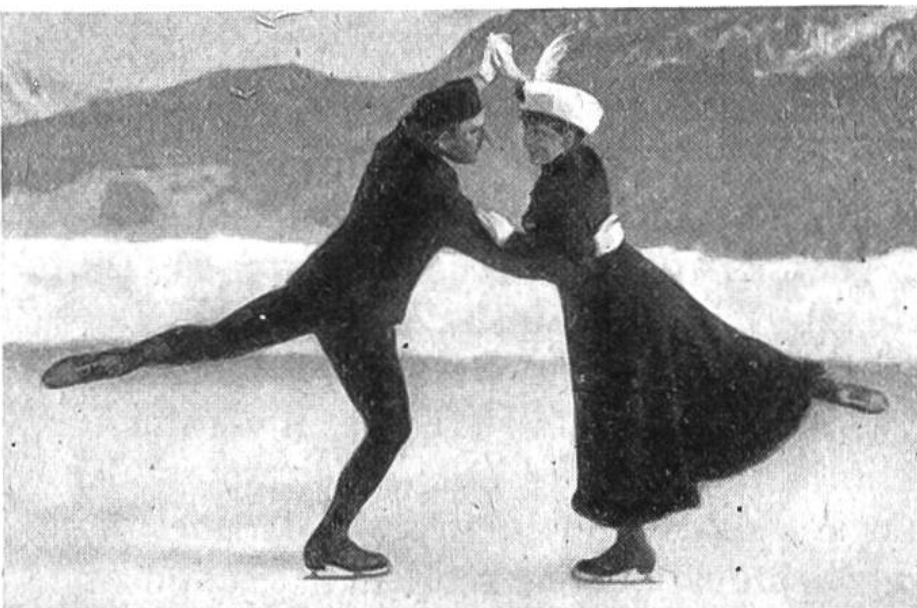
Aus der Zeit des ersten Paarlaufens in der Schweiz, um 1910.

Die Schwierigkeiten, die schon für den Einzelläufer bedeutend sind, häufen sich naturgemäss im Paarlauf. Und doch