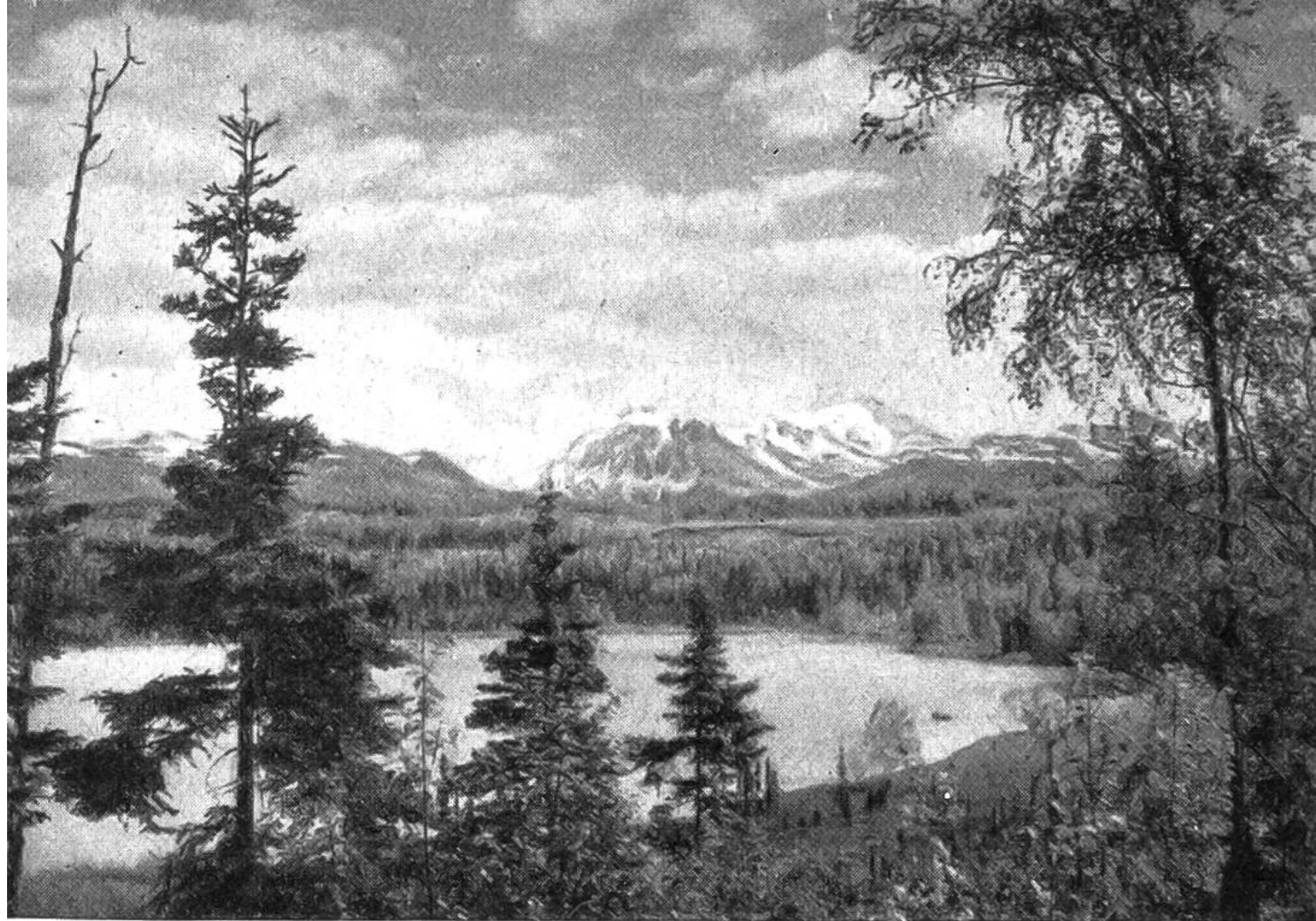
Alaska-Landschaft: ein Paradies für Touristen, südlich des Mount Mc. Kinley im Naturschutzpark.