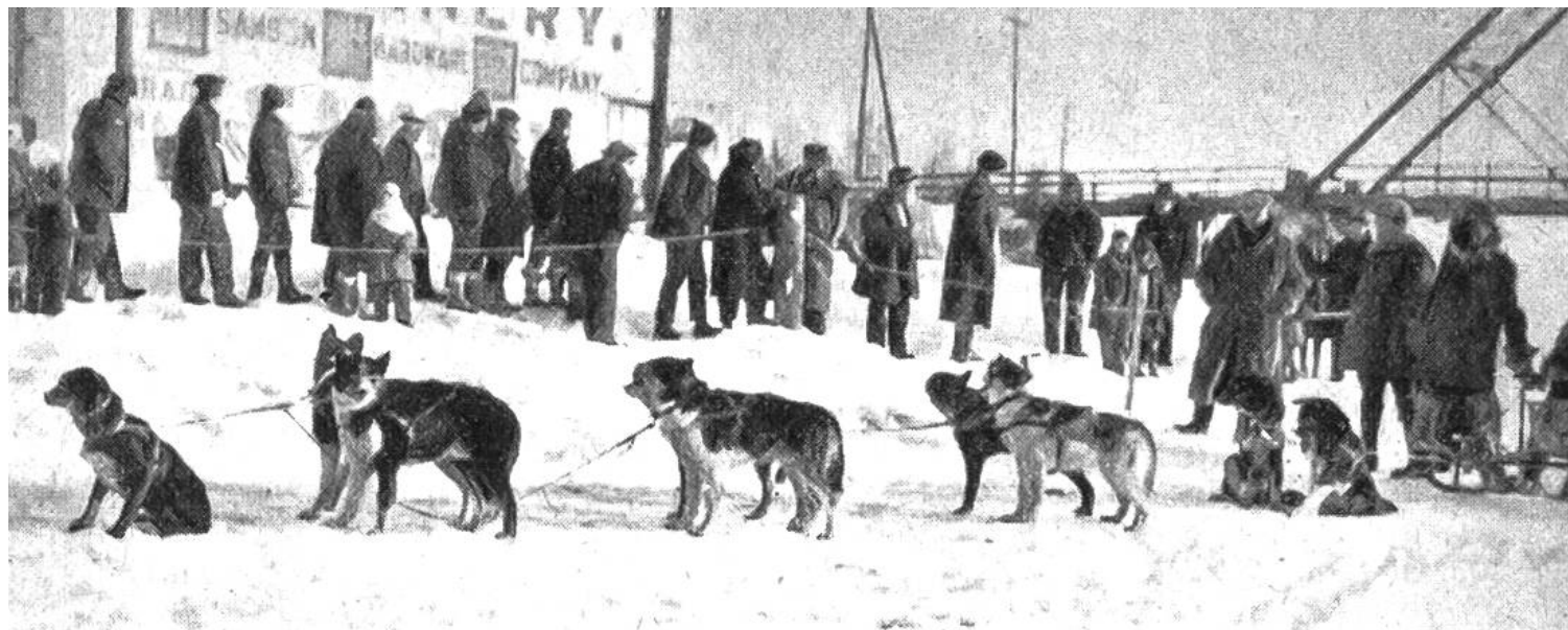
Start zu einem Hundeschlitten-Rennen in Fairbanks.

grösser als die Schweiz, ist im Jahre 1917 zum Naturschutzpark erklärt worden. Der höchste Berg Nordamerikas, der gewaltige Mount Mc. Kinley von 6240 Meter Höhe, der 6050 Meter hohe Logan, der 5977 Meter hohe Saint-Elie, die Gletscherwelt, die wilden, breiten und langen Flussläufe, die Seen und die unendlichen Nadelholzwälder und Tundren bieten dem Forschungsreisenden unausschöpfbares Wandergebiet. ✕ In den eisfreien Monaten verkehrt auf dem Flusse Yukon ein Raddampfer, der als „schwimmendes Spital“ dient. Oft werden Schwerkranke und Verunglückte mit dem Flugzeug nach diesem Lazarett gebracht. ✕