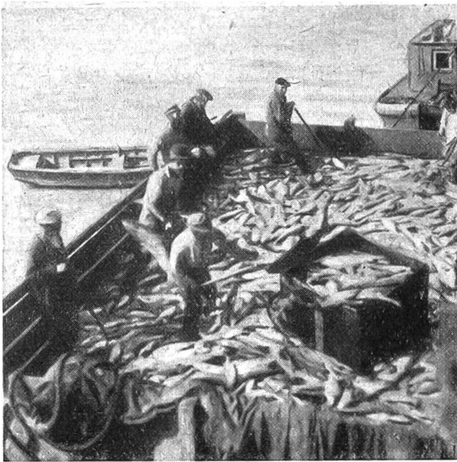
Ein Lachs- fährboot bringt die reiche Beute zur Konser- venfabrik.

gesetztes Dasein. Der grösste und einträglichste Erwerbs- zweig ist der Fang von Lachs in den grossen Flussläufen, sein Konservieren und der Transport in die ganze Welt über den Seehafen Seward. Ungefähr 25 000 zugewanderten Arbeiter verschafft diese Tätigkeit in den Sommermonaten Lebensunterhalt. in Alaskan sich die Kunde Manch einer der ursprünglich nicht ansässigen Leute mag späterhin seine Zelte für immer im Lande auf- geschlagen und sich mit Jagd und etwas Ackerbau befassen haben. In den unendlich weiten Wäldern und Moos-Tundren herrscht Überfluss an Wild, an Bären, Füchsen, Mardern, Bibern und Ottern. Den Wagemutigen und Abenteuerlustigen lockt reiche Jagdbeute an kostbarem Pelzwerk. Nicht minder verlockend wirkte um die Jahrhundertwende die Kunde von Goldfunden, die plötzlich ein Auswanderungs- fieber in Amerika und Europa auslöste. Selten aber lohnten sich die harten Strapazen in diesem nördlichen Lande mit seinen strichweise sehr kalten Wintern ( -60^{\circ} ) und heissen kurzen Sommern ( +35^{\circ} ). Tausende von Goldsuchern sind dem mörderischen Alaskawinter zum Opfer gefallen.