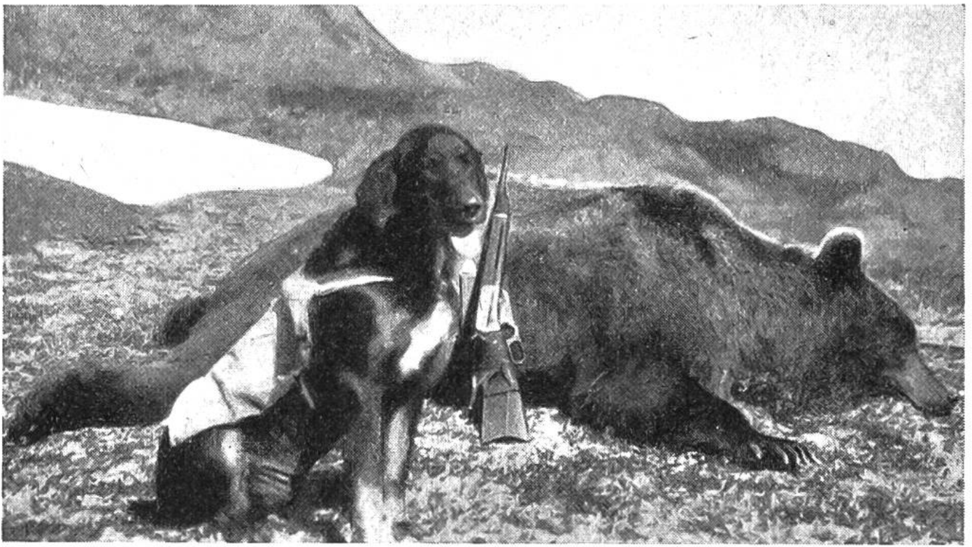
Nach einem erfolgreichen Jagdtag in der Alaska-Wildnis.

grössten Wetter- und Landungsschwierigkeiten zu meistern. Neuerdings liessen die Vereinigten Staaten ausser der schon bestehenden Eisenbahnlinie von Seward nach Fairbanks weitere Bahnstrecken und eine 2600 km lange Autoheerstrasse anlegen. Wir begegnen in der Alaskawildnis ausserdem elektrischen Anlagen und Telephonleitungen.