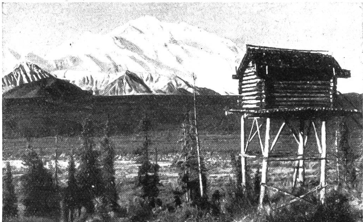
Die Fallensteller bauen für ihre Vorräte in einsamen Gegenden Nahrungsspeicher, die von wilden Tieren nicht heimgesucht werden können. Im Hintergrund ist der Mount Mc. Kinley sichtbar.

Menschenrasse, gezählt. Man weiss immerhin, dass die Ipiutaker sehr künstlerisch und religiös waren und eine unvergleichlich höhere Zivilisation als irgendeine alte oder moderne Eskimokultur besassen. Sie glaubten an ein Leben nach dem Tode und gaben ihren Verstorbenen vielerlei nützliche und künstlerisch verzierte Gegenstände mit in das aus Baumstämmen gebaute Grab. Der Niedergang und das schliesslich vollständige Verschwinden jener alten Kultur und ihrer Träger wird eines der noch zu lösenden Rätsel Alaskas sein.