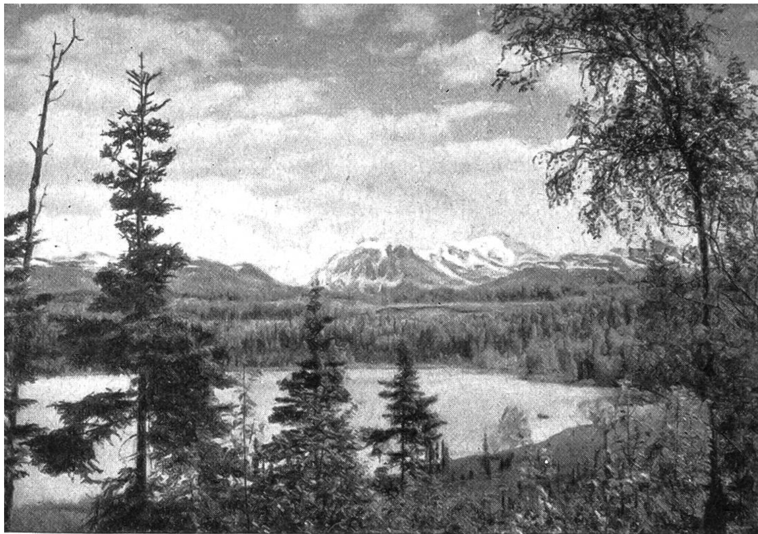
Alaska-Landschaft: ein Paradies für Touristen, südlich des Mount Mc. Kinley im Naturschutzpark.