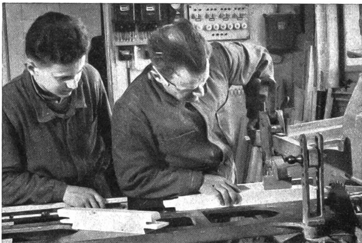
Glaserlehrling an der Kehlmaschine.