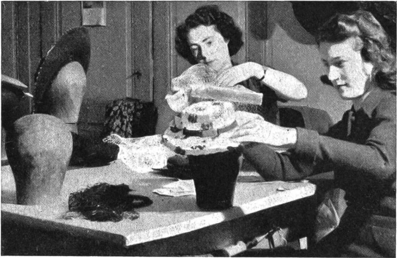
Modistin beim Modellieren und Dekorieren.