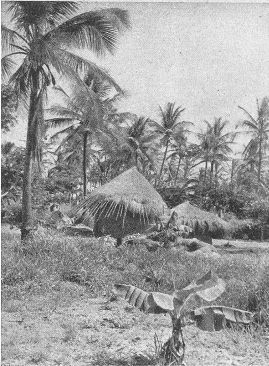
Negerhütten in einem Ko- kospalmen- hain Ostafrikas.

chen die Dächer bis fast zum Boden. Viele Stämme besitzen ausser der gemeinsamen Hauptwohnhütte noch besondere Hütten für verheiratete Männer, für Knaben, Frauen und zum Kochen. Die einfachen Ackerbauer bevorzugen Einzel- oder Weilersiedlung, die handel- und gewerbetreibende Bevölkerung lebt mehr in Dörfern und Städten.