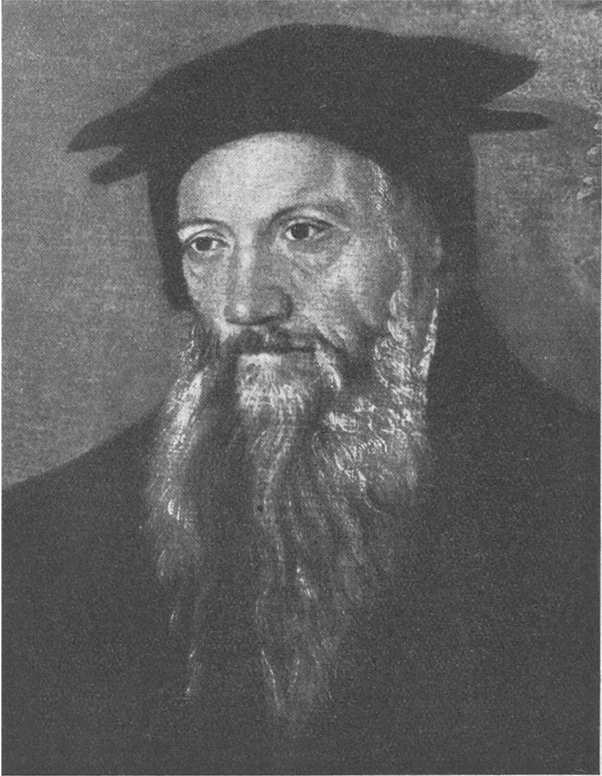
Konrad Gessner, Zürcher Arzt und Naturforscher, in seinem 48. Altersjahr gemalt von Tobias Stimmer.