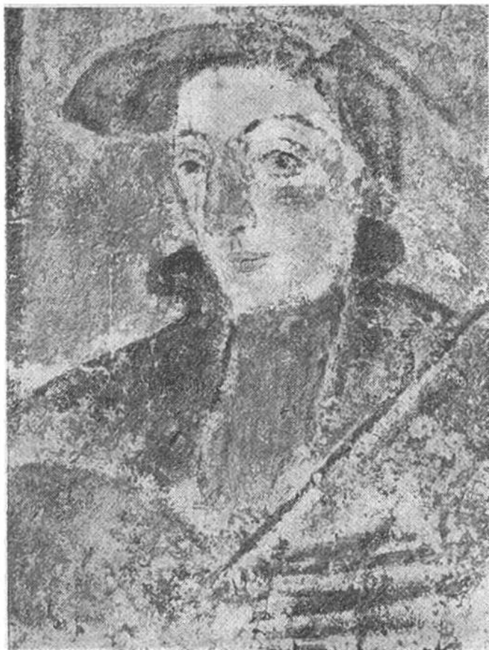
Selbstbildnis mit Pinsel und Palette, Freskogemälde am Haus zum Ritter in Schaffhausen.