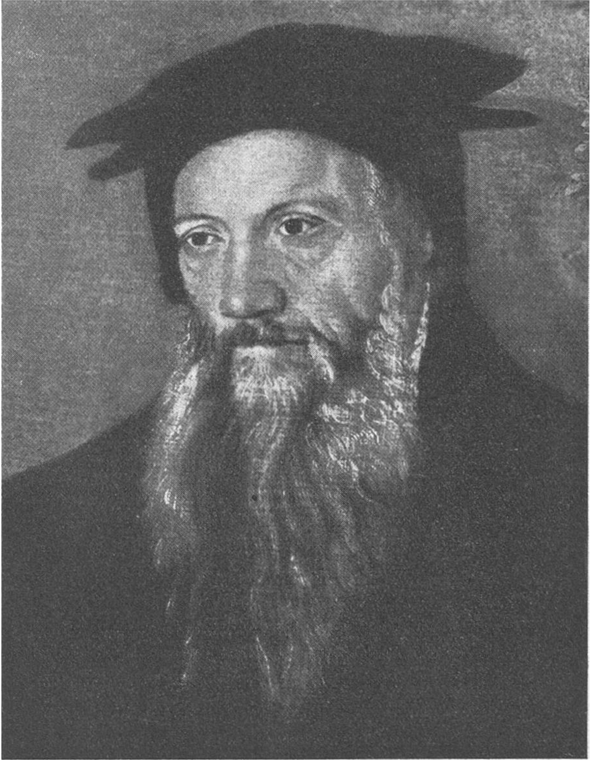
Konrad Gessner, Zürcher Arzt und Naturforscher, in seinem 48. Altersjahr gemalt von Tobias Stimmer.