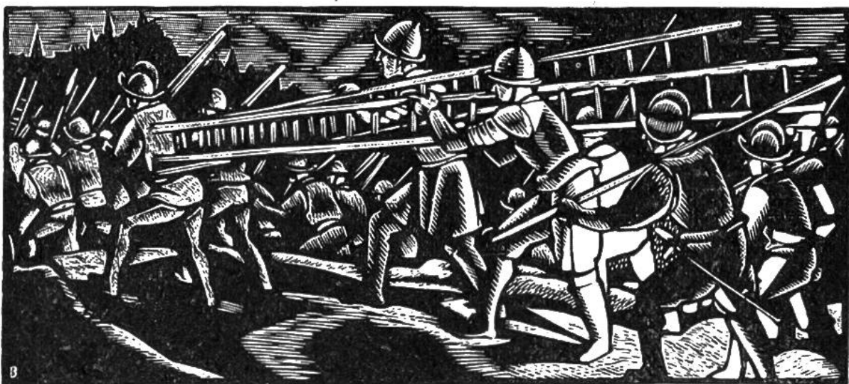
Genfer Escalade. Truppen Savoyens ziehen in der Nacht des 12. Dezember 1602 mit Belagerungswerkzeugen gegen Genf.