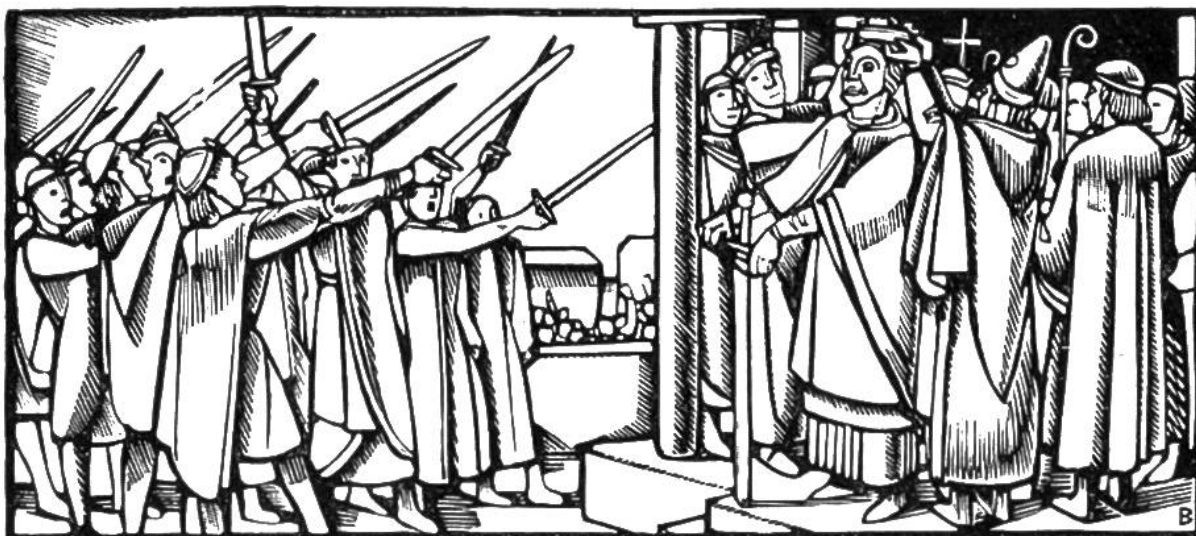
Der Frankenkönig Karl der Grosse wird am 25. Dezember 800 in Rom von Papst Leo III. zum römischen Kaiser gekrönt.