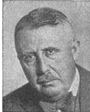
Eduard v. Steiger von Bern * 1881, seit 1941 im Amte Justiz- u. Polizeid.