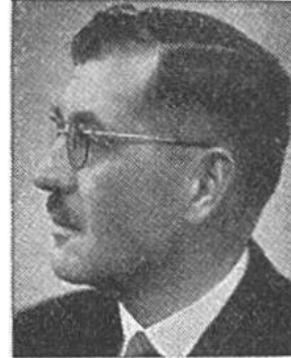
Dr. Karl Kobelt von Marbach (St. G.) * 1891, seit 1941 i. Amte Militärdepartem.