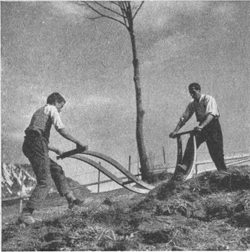
Der Bergbauer beim Rasen- schälen mit pri- mitivem, aber sinn- reichem Handgerät.