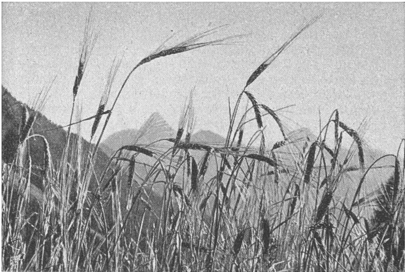
Erntesegen. — In abgelegenen Bündner Tälern findet man oft noch alte, einheimische Getreidesorten, wie z. B. diese klimaharte Sommergerste.

4,2 Millionenvolk ganz aus eigenem Grund und Boden zu ernähren, noch lange nicht am ersehnten Ziele angelangt. Die letzte Kolonne der Tabelle zeigt den von Dr. Wahlen, dem Beauftragten des Bundesrates für den Mehranbau, aufgestellten Anbauplan. Nach seinen sorgfältigen Berechnungen wären wir erst bei einer Ackerfläche von etwas über einer halben Million Hektar in der Ernährung von fremder Zufuhr unabhängig. Im Frühjahr 1942 befanden sich aber trotz äusserster Anstrengung unserer Landbevölkerung bei der Erfüllung der bisherigen Mehranbauetappen „erst“ 310 000 ha unter dem Pfluge (Vorkriegszeit 185 000 ha). Das Jahr 1942/43 soll uns nun um nicht weniger als weitere 100 000 ha dem Ziele näher bringen. Davon sind 52 000 ha aus Waldrodungen, Entsumpfungen und Umbruch von Alpweiden vorgesehen; die restlichen 48 000 ha haben Landwirtschaft und Industriepflanzwerk zusätzlich zu bewältigen. Nicht nur jeder Bauer, auch jedes grössere Unternehmen