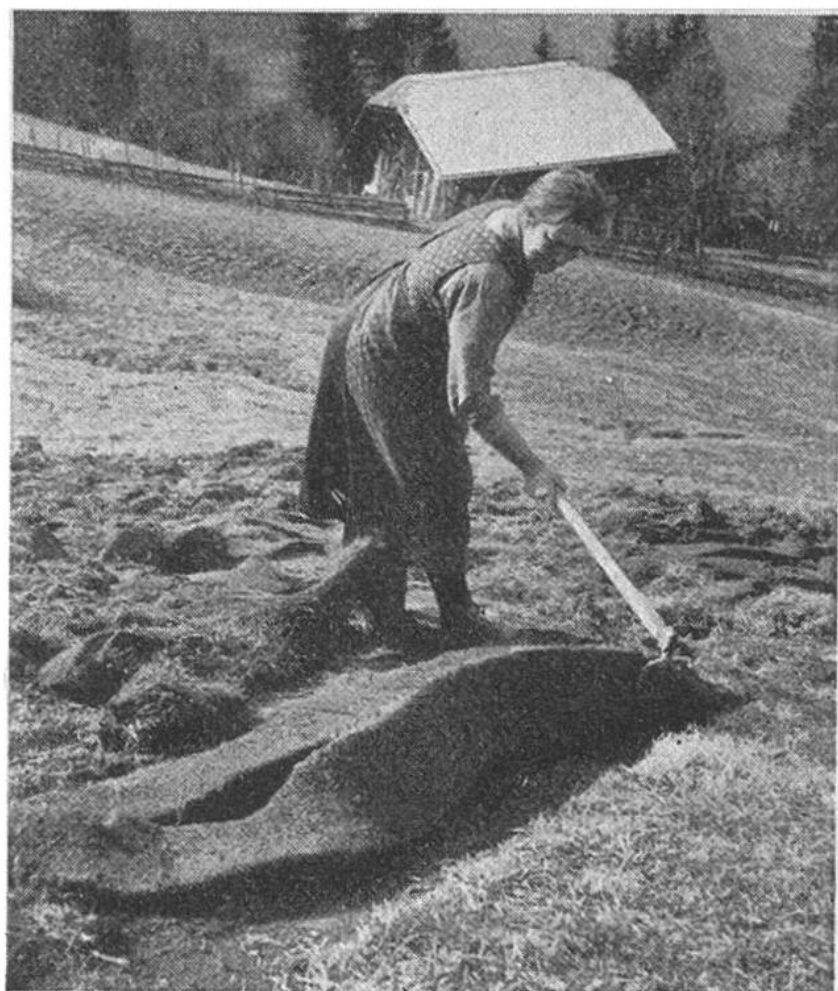
In mühseliger Handarbeit wendet und zerkleinert diese Bergbäuerin die zähen „Rasenmatten“.

genossen erfassen wir erst in seiner ganzen Tragweite, wenn wir uns einmal überlegen, was eigentlich auf dem Spiele steht. Es geht um nicht mehr und nicht weniger als um die möglichst weitgehende Ernährung des Schweizervolkes aus eigenem Boden. Was das aber in Zahlen heissen will, beleuchten folgende Angaben aus der Anbaustatistik: