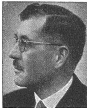
Dr. Karl Kobelt von Marbach (St. G.) * 1891, seit 1941 i. Amte Militärdepartem.