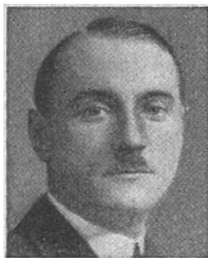
Dr. Marcel Pilet v. Château-d'Oex * 1889, seit 1929 im Amte Polit. Departem.