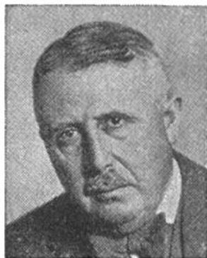
Eduard v. Steiger von Bern * 1881, seit 1941 im Amte Justiz- u. Polizeid.