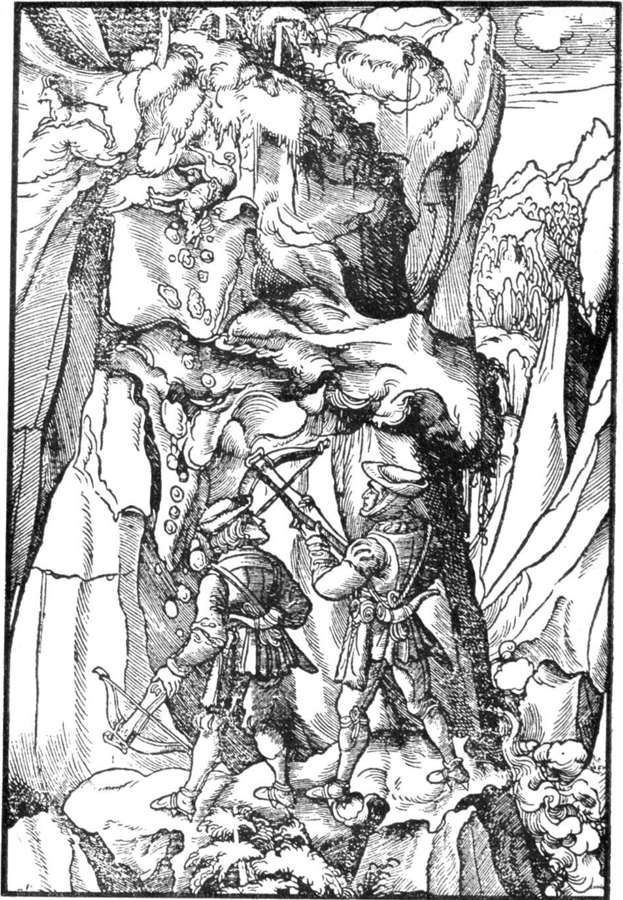
AUF DER GEMSJAGD Holzschnitt von Hans Burgkmair.