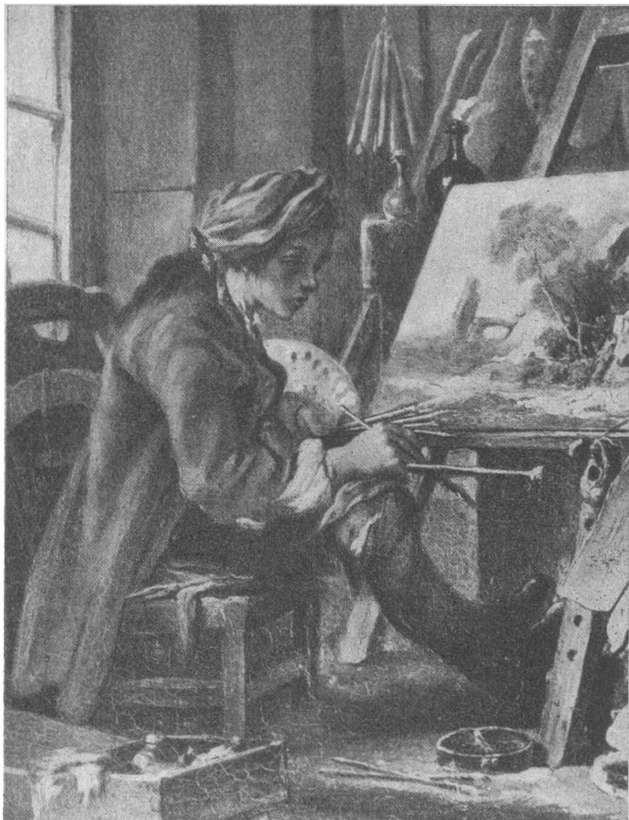
FRANÇOIS BOUCHER IN SEINEM ATELIER Selbstbildnis.