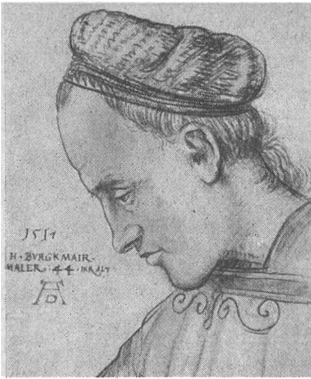
Selbstbildnis des Künstlers. (Dürer-Monogramm später hinzugefügt.)