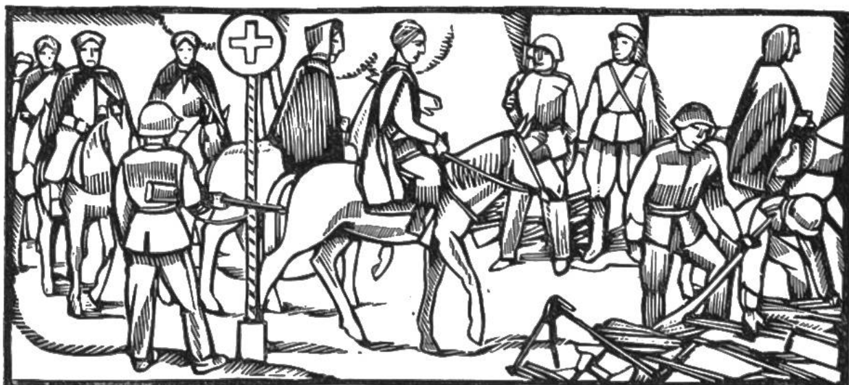
Im Juni 1940 überschreiten nahezu 40 000 alliierte Truppen die Schweizergrenze. Waffenabgabe der Spahis im Berner Jura.

slawien u. Griechenland. In Abessinien erobern die Engländer Addis-Abeba. 9. April: Die Schweizerflagge wird als «Hoheitszeichen zur See» anerkannt; Schweizer Schiffe befahren die Weltmeere. 13. April: Deutsche Truppen in Belgrad. 17. April: Kapitulation d. jugoslaw. Armee. 21./23. April: Die griechischen Armeen in Epirus und Mazedonien kapitulieren. 25. April: Rückzug der britischen u. griechisch. Truppen nach Kreta. 27. April: Einmarsch der Deutschen in Athen. 3. Mai: Beginn des irakischen Konfliktes (1. Juni: Waffenstillstand). 18. Mai: Proklamation des Herzogs v. Spoleto (Sohn des Königs v. Italien) zum König von Kroatien. 20. bis 30. Mai: Einnahme Kretas durch deutsche Fallschirm- und Luftlandetruppen. 4. Juni: † Ex-Kaiser Wilhelm II. in Doorn. 8. Juni: England dringt in Syrien (franz.) ein. 22. Juni: Deutschland u. Italien erklären Russland den Krieg.