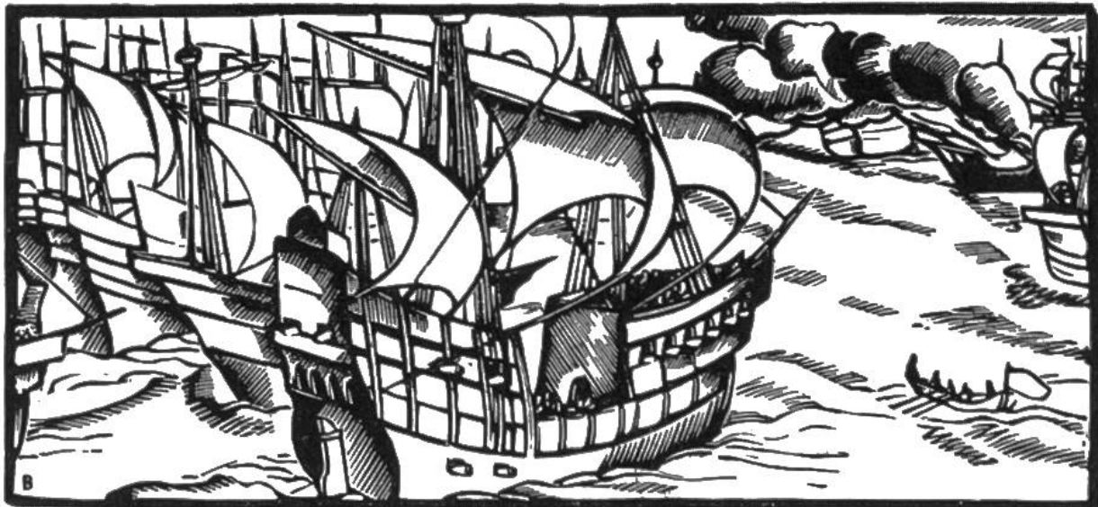
Die Engländer besiegen die mächtige spanische Flotte Armada, 1588.