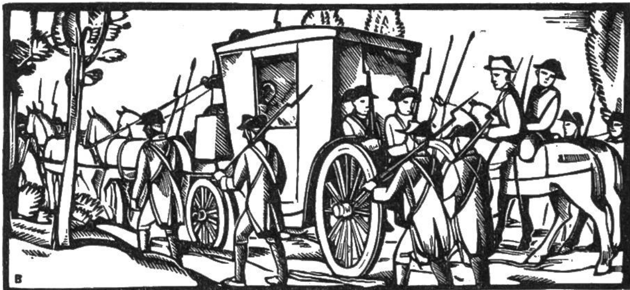
Ludwig XVI. wurde auf der Flucht in Varennes gefangengenommen und mit seiner Familie nach Paris zurückgeführt (1792).

1766 Lothringen und Korsika werden französisch.