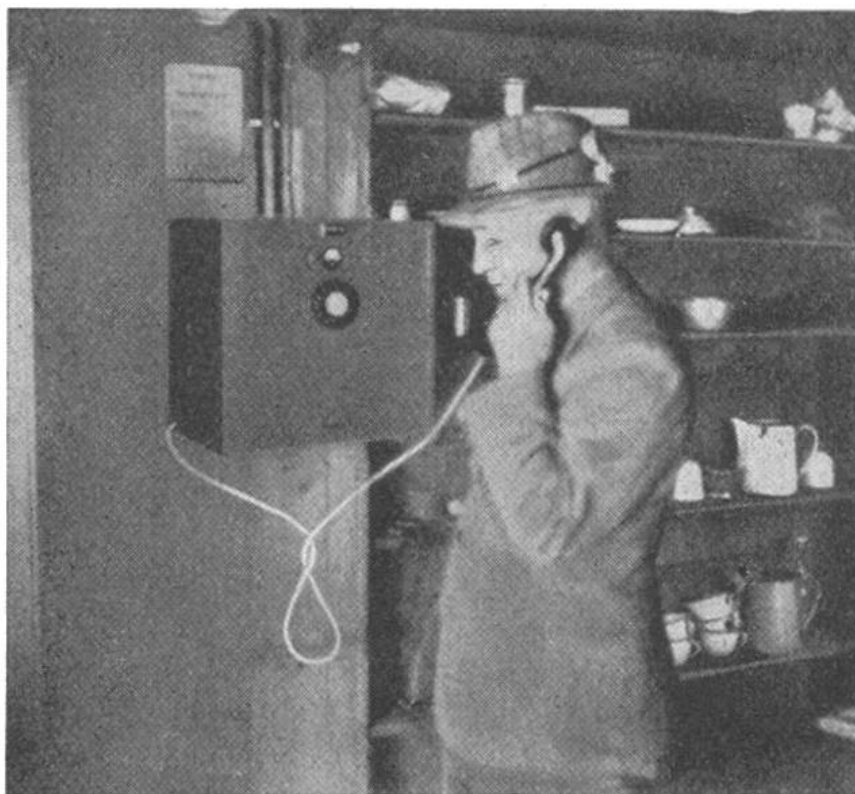
Telephon-Apparat in der Monte-Rosa-Hütte. Es besteht eine drahtlose Verbindung mit der Station Gornergrat. Von hier aus wird das Gespräch per Draht weitergeleitet.

Im April 1939 konnte die drahtlose Verbindung von der Konkordiahütte nach Jungfraujoch eröffnet werden. Damit ist es ohne weiteres möglich, von der Konkordiahütte aus irgendeinen Telephonteilnehmer der Schweiz oder des Auslandes (auch in Übersee) über das öffentliche Tele-