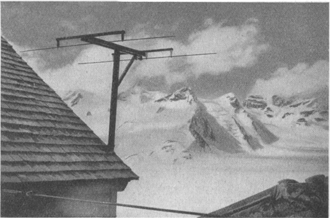
Konkordia-Hütte (2847 m über Meer). Das Dach mit den Antennen für die drahtlose Telephonie. Die Konkordia-Hütte, inmitten mächtiger Eisriesen, ist der Ausgangspunkt für viele hochalpine Touren.