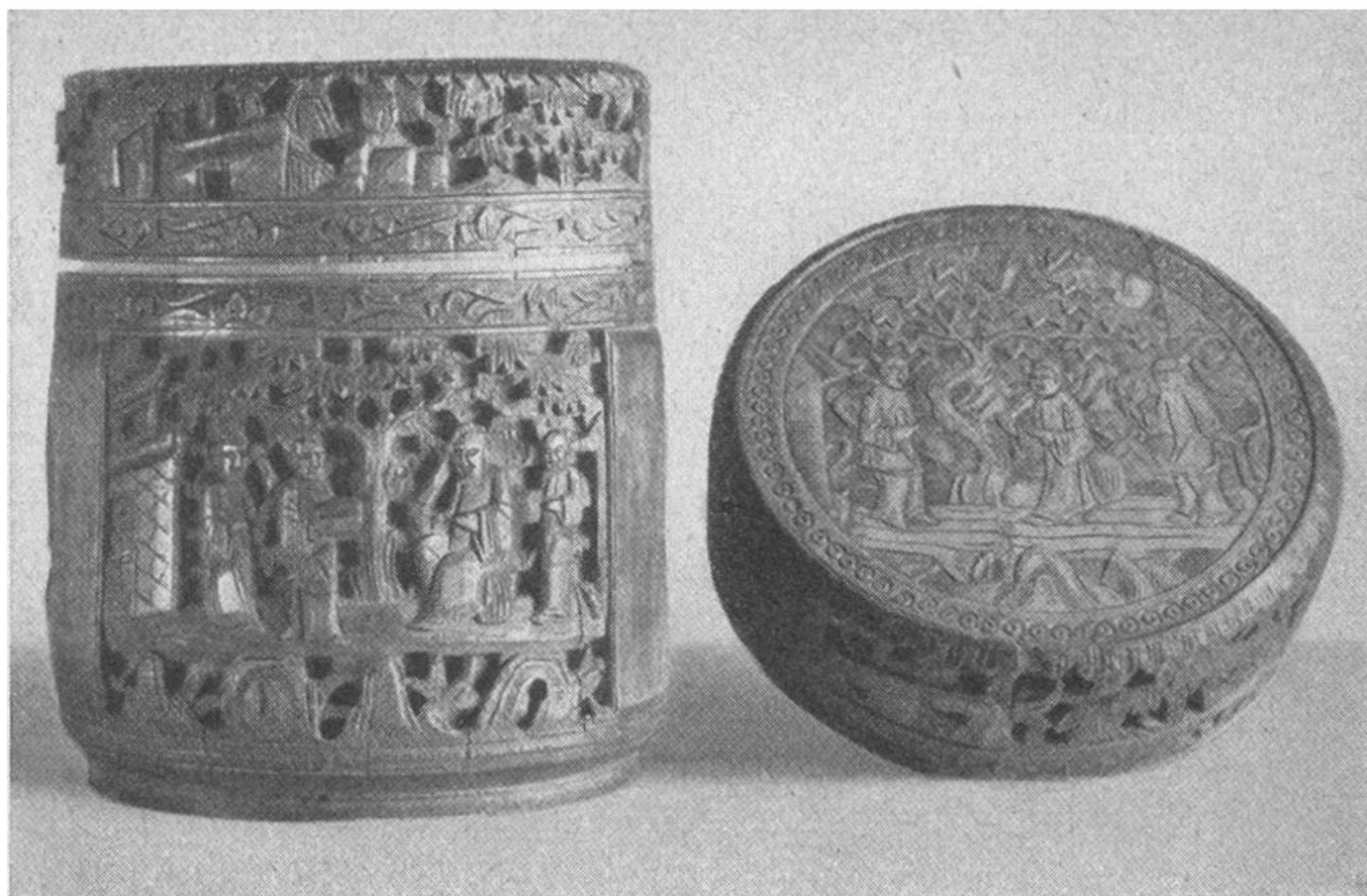
Grosses alt-chinesisches Gefäss aus Bambus, reich geschnitzt, mit figürlichen Darstellungen; rechts: Übersicht des Deckels der Dose.