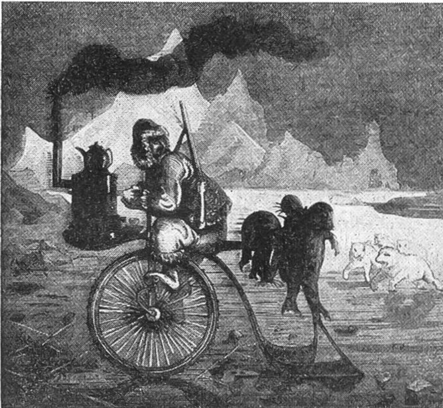
Altes Spottbild auf die „Radler“. Nordpolfahrer auf dem Velo. Vorn am Rade ist ein Teekocher angebracht und hinten sind erlegte Seehunde aufgeschnallt.

Strassen lief Drais stets ein Schwarm johlender Kinder nach; einmal hätte er bei einer Biegung fast den Grossherzog umgefahren — Gründe genug, um den oft beschwipsten Professor in den Ruhestand zu versetzen.