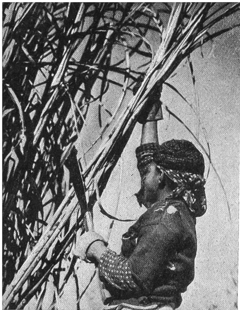
Zuckerrohr- Ernte auf Ja- va. Die bis zu 4 Meter hohen Stengel werden mit einem sehr scharfen Messer abgeschnitten.