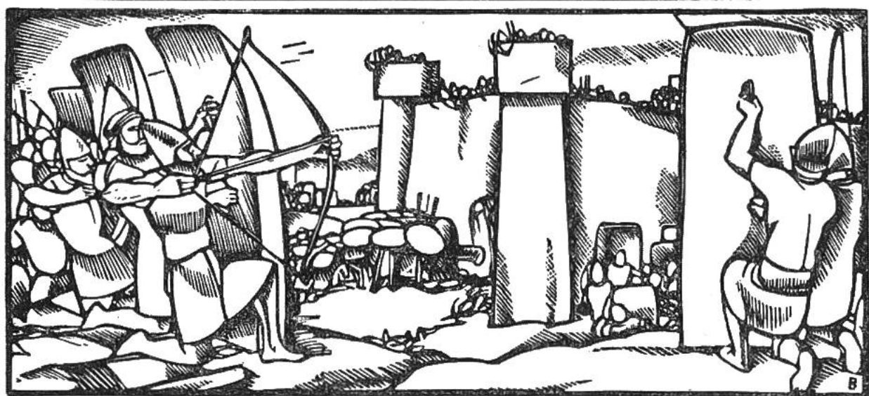
Assyrer belagern eine babylonische Stadt.