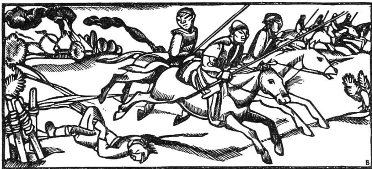
Mongolenvölker dringen in Europa ein.