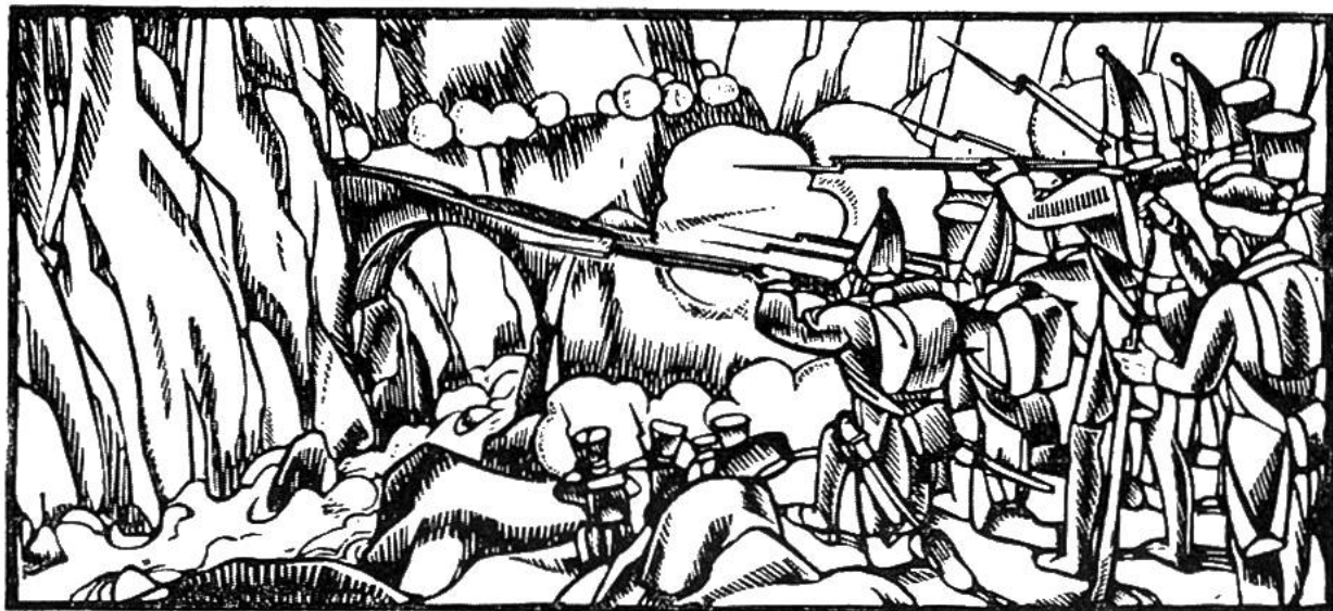
Gefecht bei der Teufelsbrücke nach der Über- schreitung des Gotthardpasses durch 25 000 Russen unter Suworow, 1799. Die Schweiz wird zum Kampfplatz fremder Armeen: Russen, Österreicher, Franzosen.

Zimmermann, Salis, Hal- ler, Gessner, Lavater, Pestalozzi, Johannes von Müller. 1766 Lothringen und Korsika werden französisch.