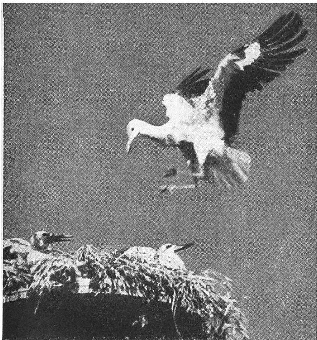
Beim Landen spreizt der Storch sein Gefieder, um durch den Luftwiderstand die Fluggeschwindigkeit abzubremesen.

Afrika vor. Eines schönen Morgens sind sie zum Leidwesen all ihrer Freunde verschwunden. Von weit und breit herkommend, sammelt sich das Storchenvolk in ausgedehnten Sumpfgebieten. Von da wird die grosse Reise zu den gewohnten Winterplätzen angetreten. Täglich wird eine Strecke von 100—200 km zurückgelegt. Die Störche vermeiden es, im Gegensatz zu den Staren und andern Zugvögeln, offenes Meer zu überfliegen. Die meisten wählen deshalb die sogenannte Ostroute; ihr Weg führt über Ungarn, der Donau entlang nach Istanbul, dann quer über Kleinasien und das heilige Land nach den Gegenden des Nils. Die Winterquartiere reichen von hier bis tief hinab nach Südafrika. Ein kleinerer Teil des grossen Storchengeschlechtes, beson-