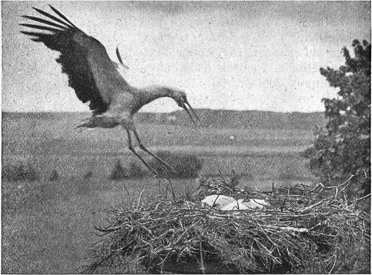
Die jungen Störche halten Mittagsruhe, treulich bewacht von den Eltern, die sie nie lange allein lassen.

niederlassen, und dass sie nie mehr dorthin wiederkehren, wo es Streit und Zank im Hause gab. Das Dorf Reinach im Birstal hat es erfahren, dass die Störche nicht Freunde von Lärm und Aufregung sind. Als vor Jahren einmal der erste August auf einem Platz nahe dem Storchennest mit Knallfröschen und Raketen gefeiert wurde, war am folgenden Tag das Storchennest verlassen. Während manchem Jahr mussten die Reinacher ihre Störche entbehren. Als dann eines Tages neuerdings Störche in Reinach genistet hatten, wurde an der Bundesfeier das nächtliche Feuerwerk auf einen entfernten Platz verlegt. Die rücksichtsvolle und vorbildliche Handlung der Reinacher wurde belohnt. Am Morgen des zweiten August lief die freudige Kunde durchs Dorf: „Die Störche sind dageblieben“. Sie sind seither auch jedes Jahr wiedergekommen.