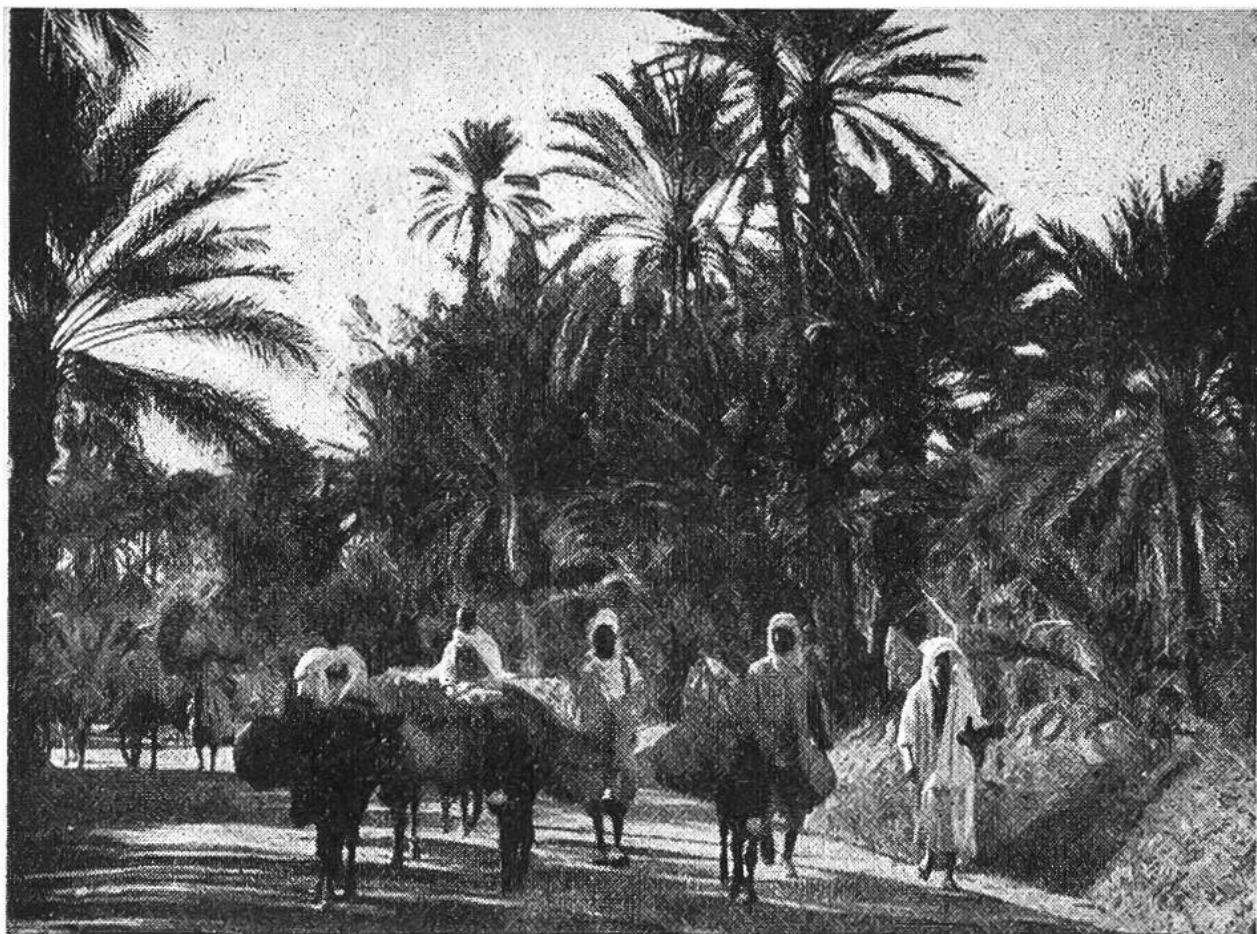
Dattelpflücker ziehen nach Hause. Sie haben die Dattelnkörbe auf die Esel gepackt; rechts und links hängt die schwere Last herab.

Schafleder eingenäht, jahrelang und bilden das bekannte Wüstenbrot der Beduinen.