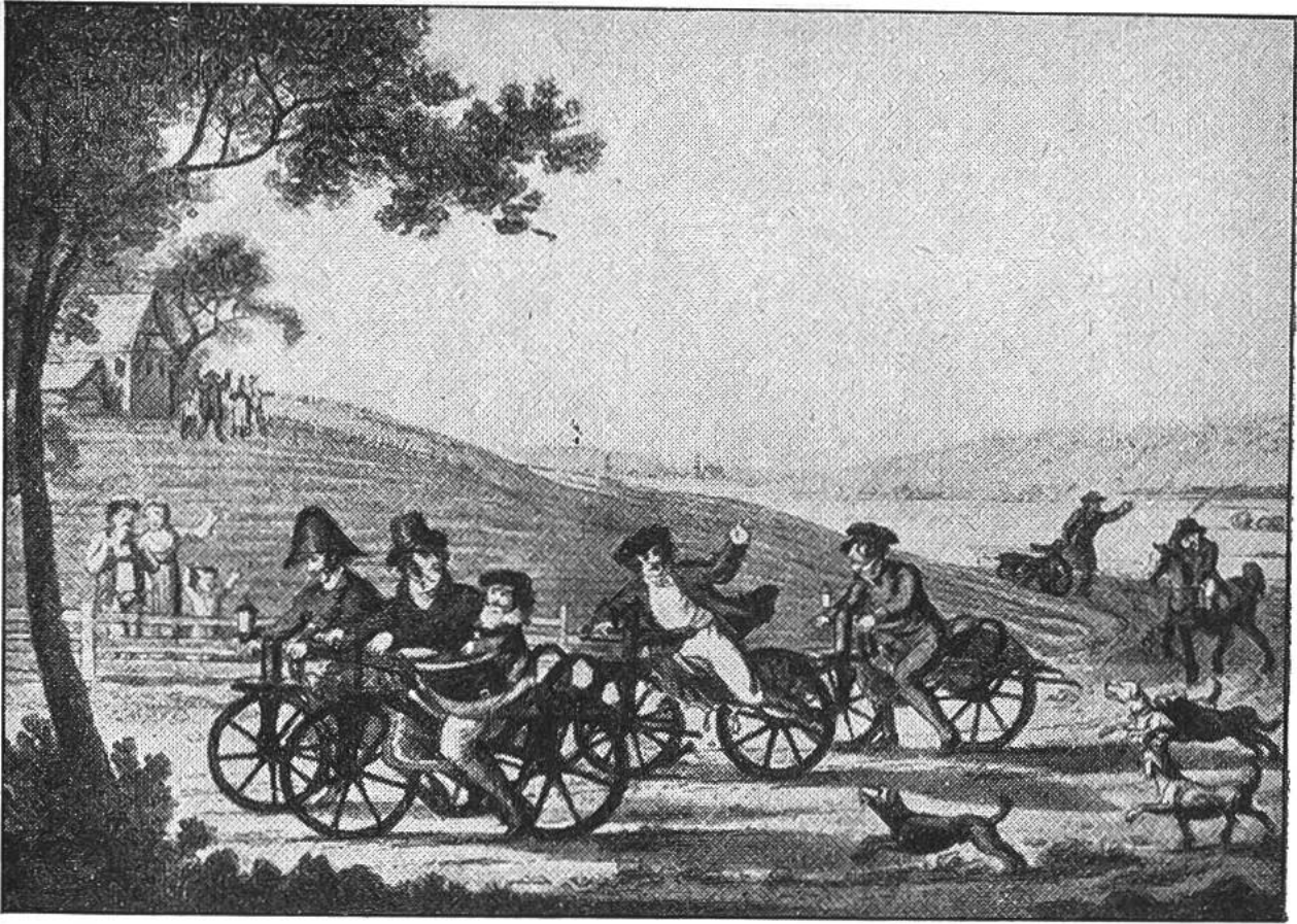
Ein Sonntagsausflug auf den neuen Laufmaschinen ums Jahr 1830. Dank diesen Pionieren und den steten Verbesserungen, fahren wir heute viel bequemer auf unseren Stahlrösslein in die Welt hinaus.

Boden ab und trachteten einen möglichst weiten Weg im Schwung, mit hochgezogenen Beinen, zurückzulegen. Es sah sicher sehr komisch aus, und deshalb ist es nicht verwunderlich, dass manch beissendes Spottgedicht oder treffende Karikatur in den Zeitungen erschien. Besonders die radelnde Damenwelt bildete mit Vorliebe die Zielscheibe des Gespöttes.