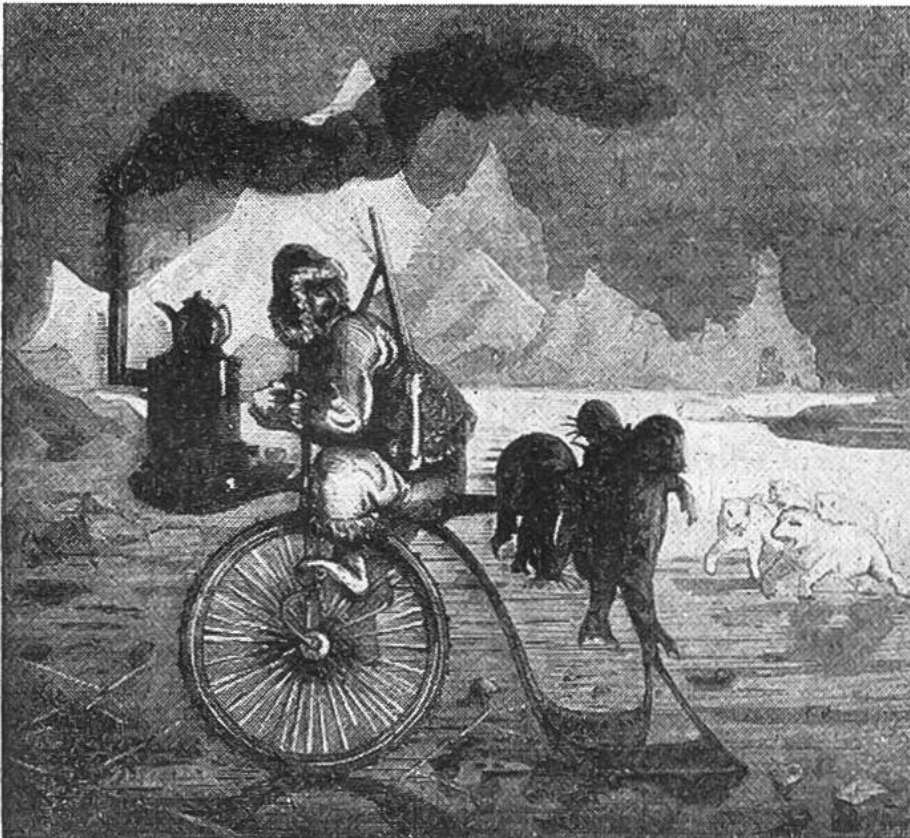
Altes Spottbild auf die „Radler“. Nordpolfahrer auf dem Velo. Vorn am Rade ist ein Teekocher angebracht und hinten sind erlegte Seehunde aufgeschnallt.

Strassen lief Drais stets ein Schwarm johlender Kinder nach; einmal hätte er bei einer Biegung fast den Grossherzog umgefahren — Gründe genug, um den oft beschwipsten Professor in den Ruhestand zu versetzen.