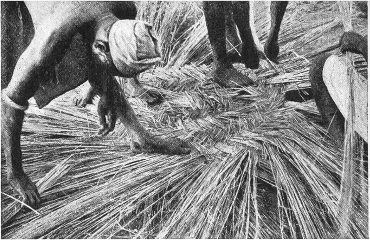
Die Wände der Hütten werden aus Schilf geflochten.

die Grundpfeiler, denn die Wohnungen durften nicht unmittelbar auf dem Erdboden stehen, sondern auf Pfeilern;