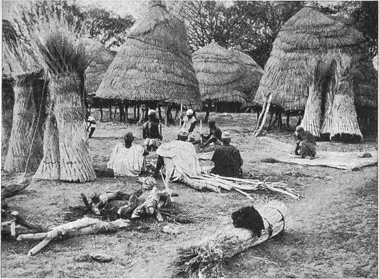
Einige Hütten stehen schon, für die andern ist das gesamte Baumaterial bereitgestellt.

Hütten. Das Aufziehen der Matten war die schwerste Arbeit des ganzen Baues. So entstand eine Hütte nach der andern. Dank der intelligenten Arbeitseinteilung und der handwerklichen Geschicklichkeit der Arbeiter war nach knapp zehn Stunden das ganze Dorf fertig. „Lulonga“ wurde es getauft; befriedigt, und wohl auch ein bisschen müde, nahmen die schaffigen Neger von ihren Wohnungen Besitz und legten sich schlafen.