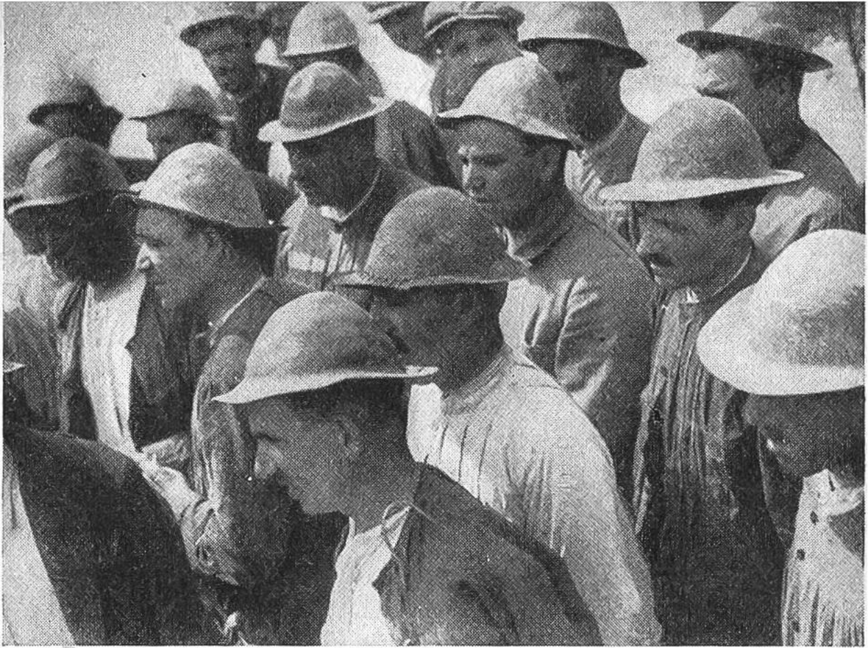
Stahlhelme für die Minenarbeiter. Bergleute mit ihren charakteristischen Schutzkappen gegen tropfendes Wasser und herabfallendes Gestein. Sie stehen bereit zur Einfahrt in die Mine.

flüssen des „tödlichen Silbers“ bewahrt. Auch alle andern, die viel mit Quecksilber zu tun haben, wie Feuervergolder, Spiegelbeleger, Angestellte physikalischer und elektrotechnischer Werkstätten, sind andauernden Vergiftungen ausgesetzt, wenn die Schutzvorkehrungen unzureichend sind. Quecksilber ist ungefähr 13mal schwerer als Wasser (spezifisches Gewicht bei null Grad 13,595). Bei Erwärmung dehnt es sich sehr schnell aus und zieht sich bei Kälte ebenso rasch zusammen; darauf beruht seine vielfache Verwendung in Thermometern, Wettergläsern, Dampfdruckmessern, Luftpumpen usw. Man verschickt Quecksilber in doppelten, waschledernen Beuteln aus Hammelfell, in China in Bambusstäben, die mit Harz verschlossen werden, und heute am meisten in nahtlos gepressten Stahlflaschen; die Flaschen enthalten 34,5 kg (= ein alter spanischer Zentner). Die Hauptverwendung von Quecksilber beruht auf seiner