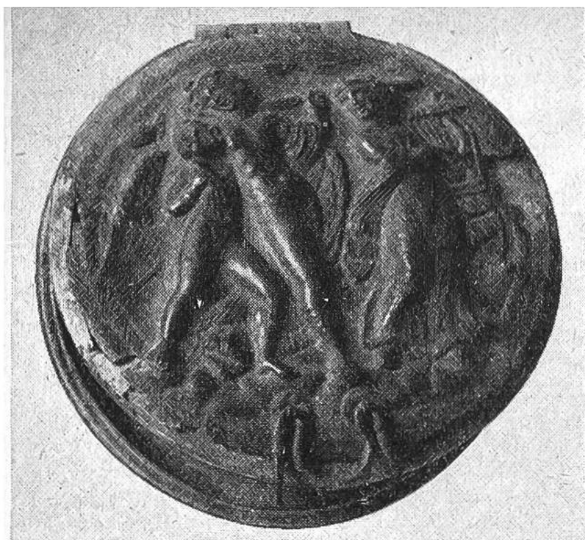
E t r u s k i s c h e B r o n z e d o s e z u r A u f b e w a h r u n g e i n e s R e i s e s p i e g e l s (300 v. Chr.). A u f d e m D e c k e l s i n d i n R e l i e f z w e i G o t t - h e i t e n u n d e i n e F r a u , w e l c h e L e i e r s p i e l t , d a r g e s t e l l t .

Ausschmückung ist so gediegen und mannigfaltig, dass man versucht ist anzunehmen, der Metallspiegel sei damals das beliebteste Geschenk für schöne Frauen und wohl auch für Männer gewesen.