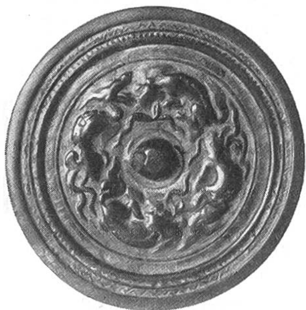
Rückseite eines kleinen chinesischen Bronzespiegels. In der Mitte befindet sich ein Ohr, durch das ein Band hindurchgezogen werden kann.

Die prächtigen Bronzespiegel des Altertums aber haben Jahrtausende fast