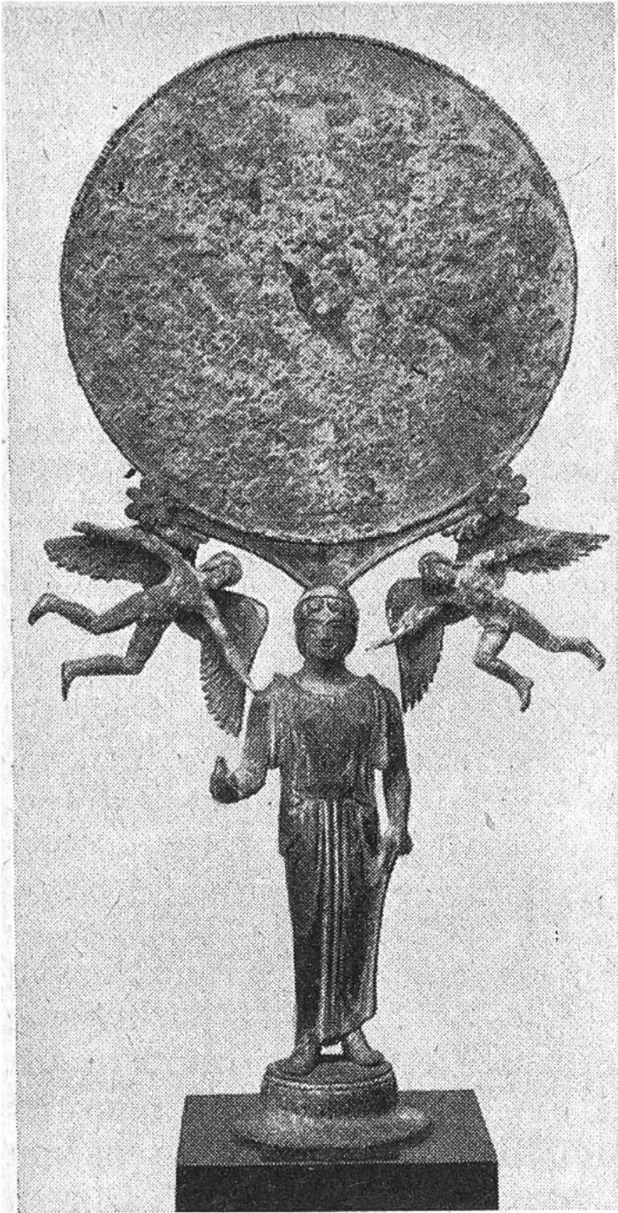
Wundervoller altgriechischer Bronzespiegel (480 v. Chr.).

unversehrt überdauert, und noch heute bewundern wir an ihnen die schönen Formen und den herrlichen, künstlerischen Schmuck.