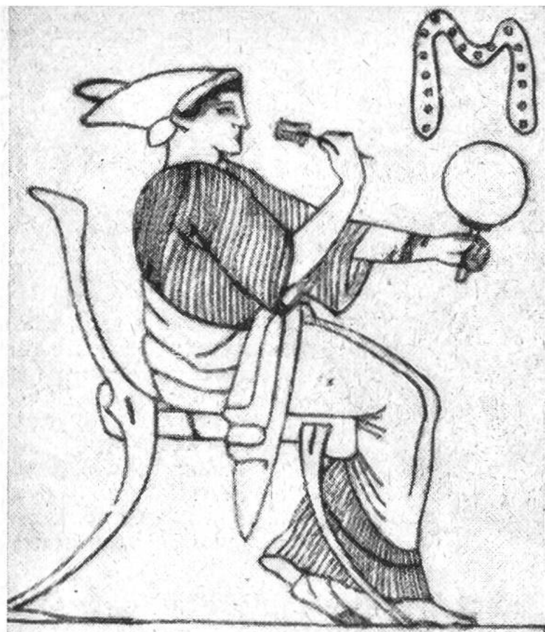
Römerin mit Metallspiegel bei der Toilette. (Alt-römisches Vasenbild.)

Etwa hundert Jahre v. Chr. kamen in Ägypten erstmals gläserne Spiegel in Gebrauch. Der römische Geschichtsschreiber Plinius spricht im Jahre 65 vom Aufkommen der Glasspiegel; er sagt, die auf der Rückseite mit Gold belegten seien die besten; wirklich gibt Gold dem widergespiegelten Gesicht einen frischen, rosigen Schimmer.