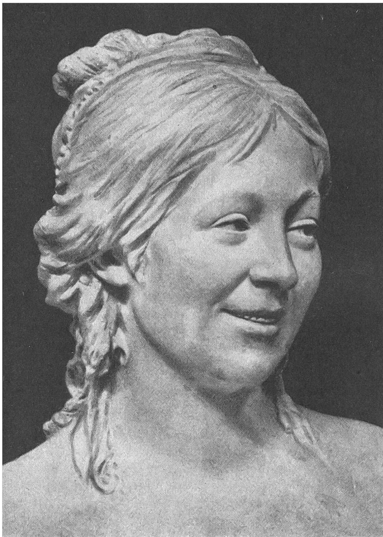
Jean-Antoine Houdon BILDNISBÜSTE SEINER FRAU.