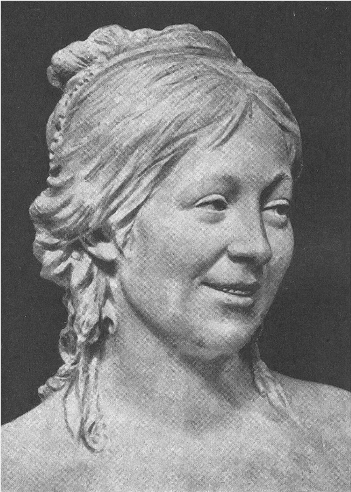
Jean-Antoine Houdon BILDNISBÜSTE SEINER FRAU.