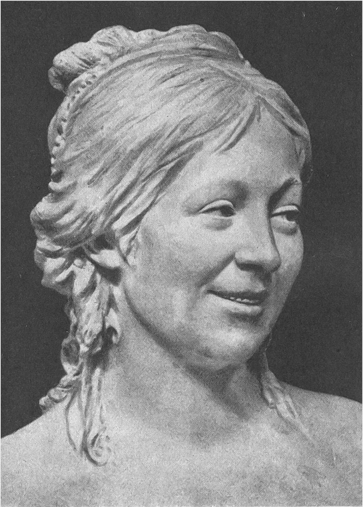
Jean-Antoine Houdon BILDNISBÜSTE SEINER FRAU.