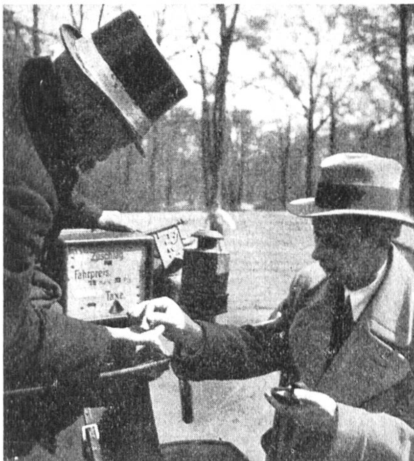
Taxameter, die den Fahrpreis angeben, wurden erstmals 1894 in Deutschland auf Pferdroschken eingeführt.

Anzahl der Kilometer jeder einzelnen Fahrt auf 100 Meter genau anzeigt. Letztere Zählvorrichtung wird bei Beginn jeder Fahrt auf 0 zurückgestellt.