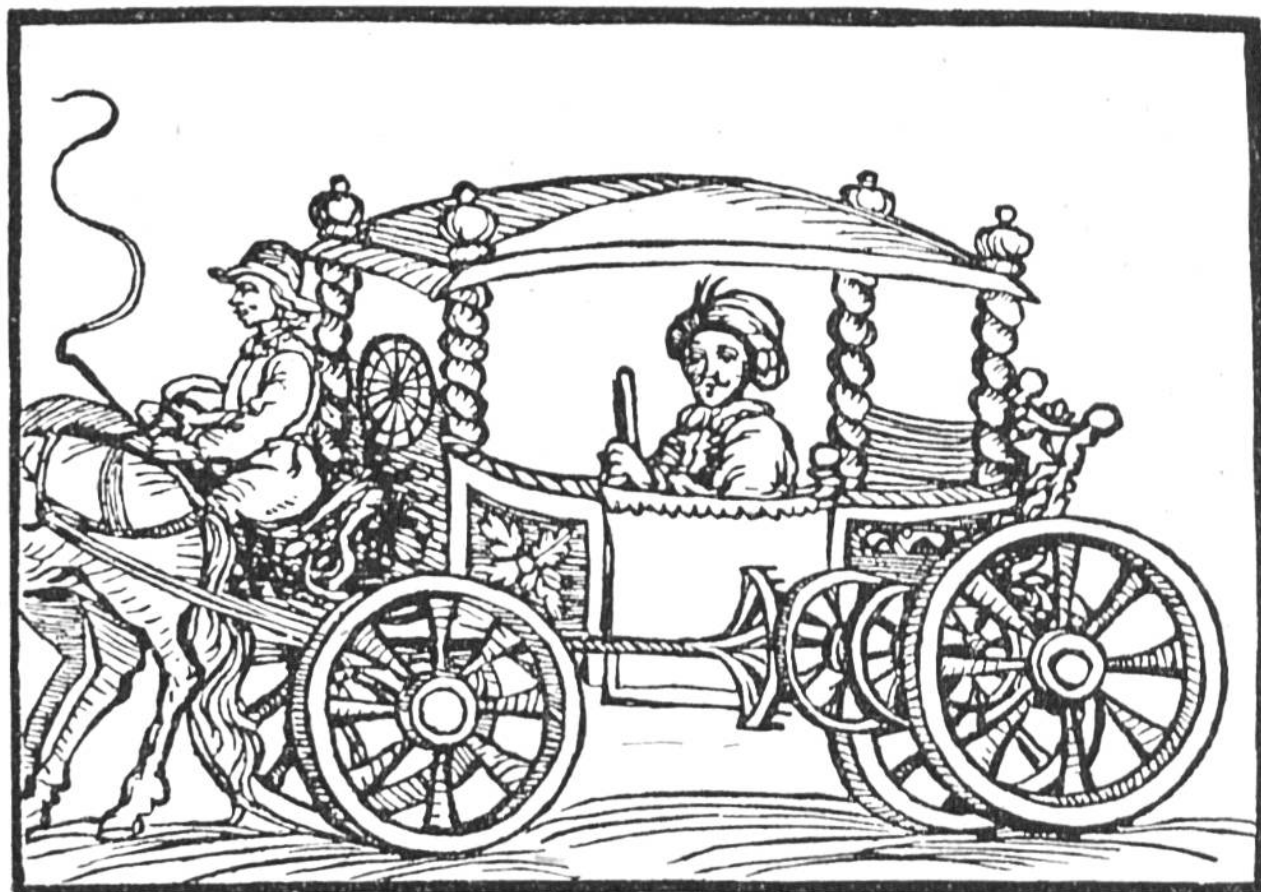
Wegmesswagen aus dem 17. Jahrhundert. Zwischen den Wagenrädern sieht man die Zahnrad-Übersetzung, die mit dem Zifferblatt, hinter dem Kutschersitz, in Verbindung steht.