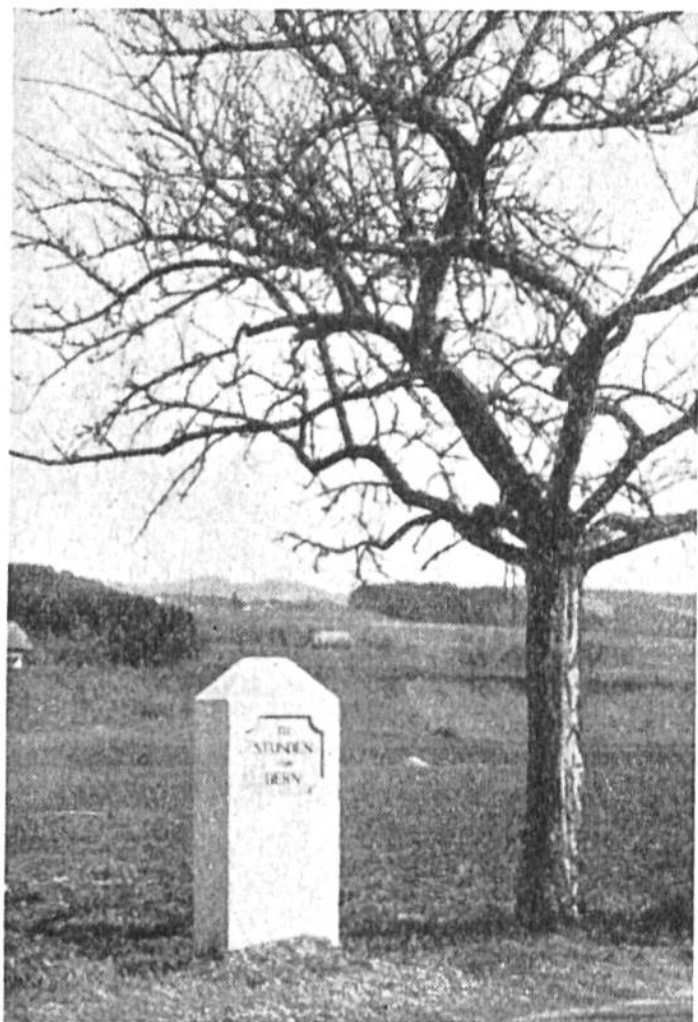
Stundenstein der alten Republik Bern. Er gibt die Entfernung von Bern an. (Eine Wegstunde = 4,8 km.)

zu stossende Vorrichtung war grundsätzlich gleich konstruiert wie die römischen Wegmesswagen. Beim englischen Wegmesser gab ein Zeiger auf einem Zifferblatt die Zahl der Radumdrehungen an. Es konnte also in jedem Augenblick festgestellt werden, welche Strecke seit dem Ausgangspunkt zurückgelegt worden war. Das 1. Bild zeigt einen nach dem gleichen Prinzip arbeitenden Wegmesswagen aus dem 17. Jahrhundert. Man erkennt das Zifferblatt des Wegmessers hinter dem Kutschersitz. Aus der jederzeit ersichtlichen Länge der zurückgelegten Strecke liess sich die Fahr-taxe berechnen. Der moderne Taxameter, der, wie unser 5. Bild beweist, trotz seiner unscheinbaren Grösse eine komplizierte mechanische Vorrichtung enthält, gibt direkt und fehlerfrei den für die Fahrt zu entrichtenden Betrag an. Heute ist in jedem Automobil ein Kilometer-Zähler eingebaut, der zur gleichen Zeit das Total der gefahrenen Kilometer, die jeweilige Geschwindigkeit in Kilometer und die