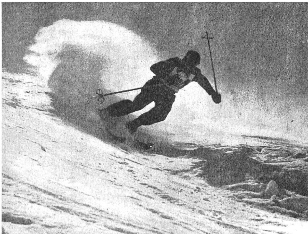
Ein stiebender, gerissener Kristiania, der ideale, meist angewendete Schwung für Slalom.