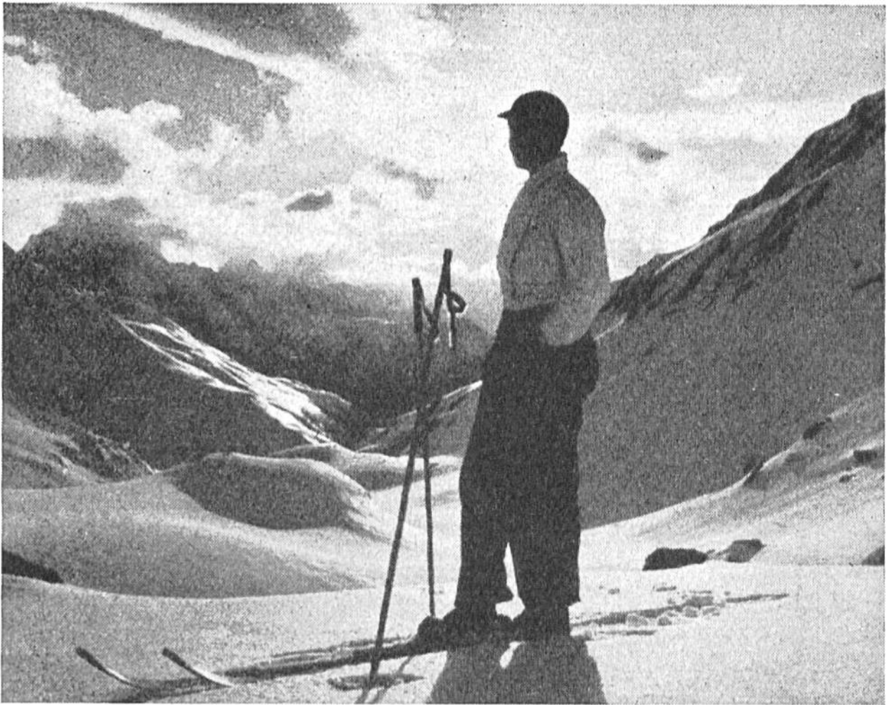
Im Banne der Landschaft. Ein prächtiger Wintertag im Hochgebirge, Sulzschnee und wechselndes Spiel der Wolken.

Im Berner Oberland wurde erstmals im Januar 1897 eine grössere Skitour ausgeführt. Vier Touristen aus Strassburg und Freiburg i. Br. wanderten innert sechs Tagen von Guttannen im Haslital über den Unter- und Oberaar-gletscher und den grossen Aletschgletscher ins Rhonetal. Es dauerte aber noch fast ein Jahrzehnt, bis man nach richtiger Anleitung die Vorteile des Skifahrens und des Wanderns im Winter schätzen lernte. In den letzten dreissig Jahren ist dann der Ski Allgemeingut geworden und damit auch das Wissen um Winterpracht und Winterfreuden. Hunderttausende ziehen Jahr für Jahr in die Schweizerberge und finden in reiner Winterluft Erholung und neue Lebenskraft. — Winterkuren und Wintersport haben überdies der einheimischen Fremdenindustrie eine neue Grundlage gegeben, ohne welche sie heute nicht mehr bestehen könnte.