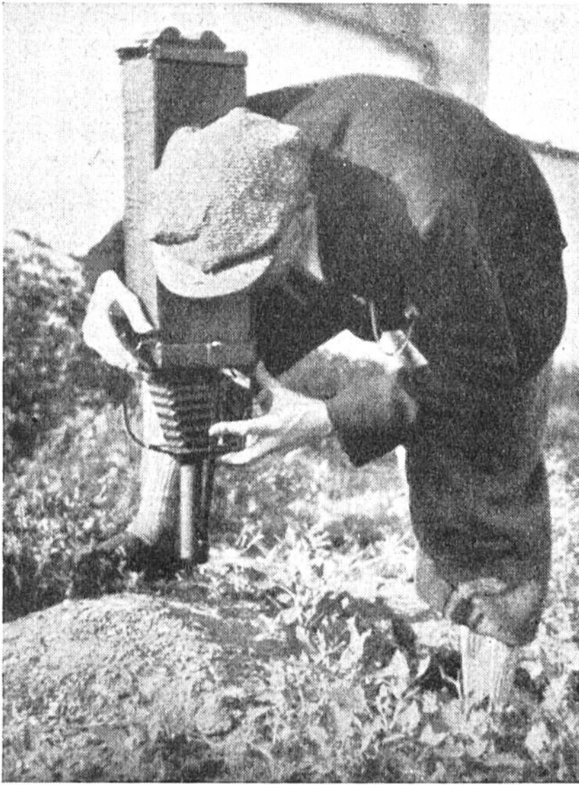
Ameisenforscher an der Arbeit. Um die kleinen Tierchen photographieren zu können, musste ein Apparat mit sechsfacher Auszugslänge gebaut werden. Auch unsere Bilder wurden damit aufgenommen.

Je zahlreicher die Bewohner eines Ameisennestes sind, desto mehr Gänge und Räume dehnen sich in den verschiedenen Stockwerken über und unter der Erde aus. Bestimmte Wege führen ins Freie. Ausserhalb des Nestes sind weithinreichende Strassen errichtet worden. Nicht selten findet man im gleichen Waldgebiet zahlreiche Bauten derselben Ameisenart, und man kann beobachten, dass die Bewohner dieser Bauten miteinander in regem Verkehr stehen. Eine solche Riesenkolonie von roten Waldameisen wird gegenwärtig in Mecklenburg beobachtet und erforscht. Die Kolonie besteht aus 58 Hauptnestern und 31 Zweignestern. Die Einwohner werden auf mindestens 6—7 Millionen Ameisen geschätzt. Das Gesamtstrassennetz soll 7,5 km lang sein. Es wird eine genaue Karte dieses 60 000 m 2