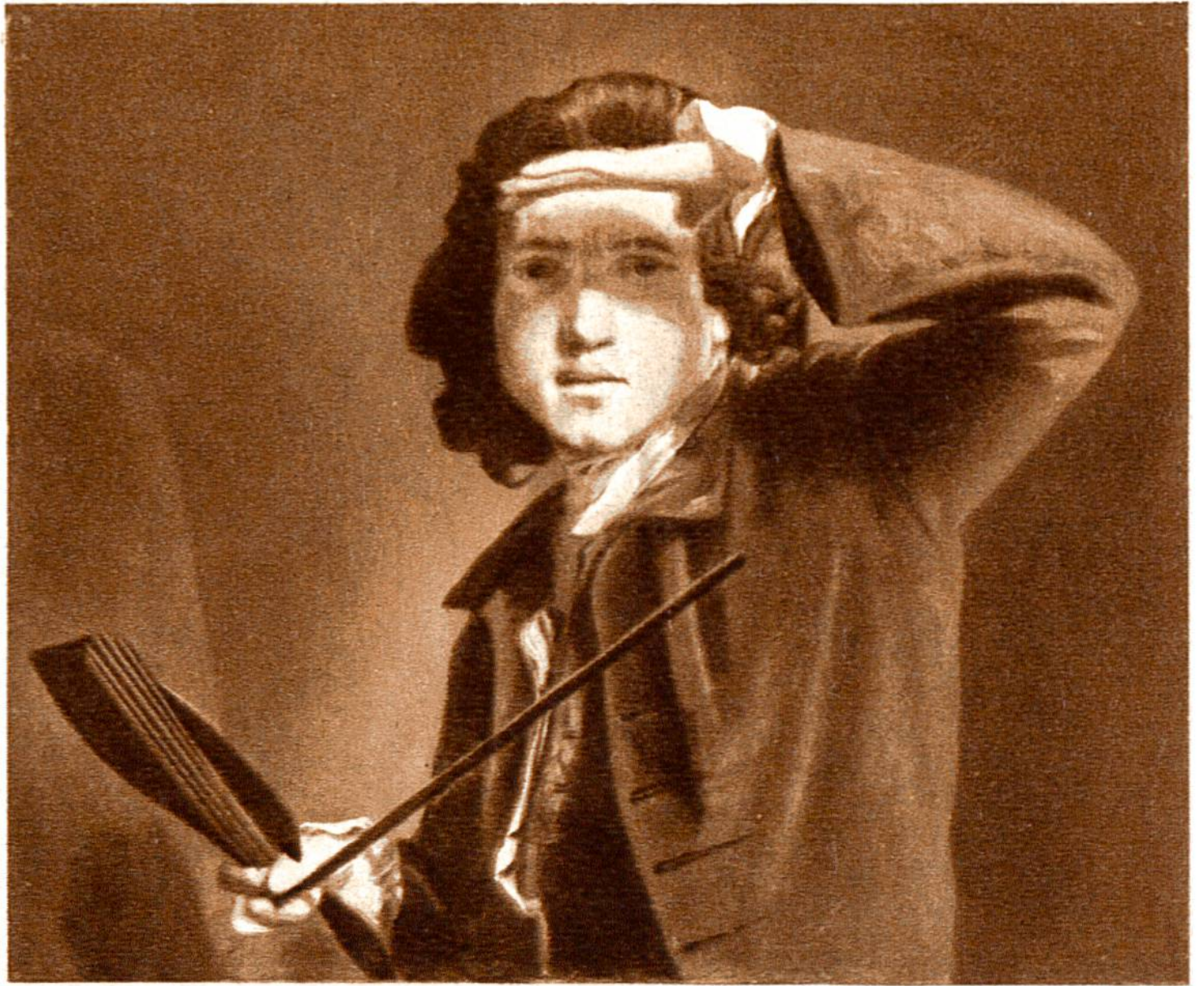
Selbstbildnis, von Joshua Rey- nolds, London, 1723—1792. (National Portrait Gallery, London.)