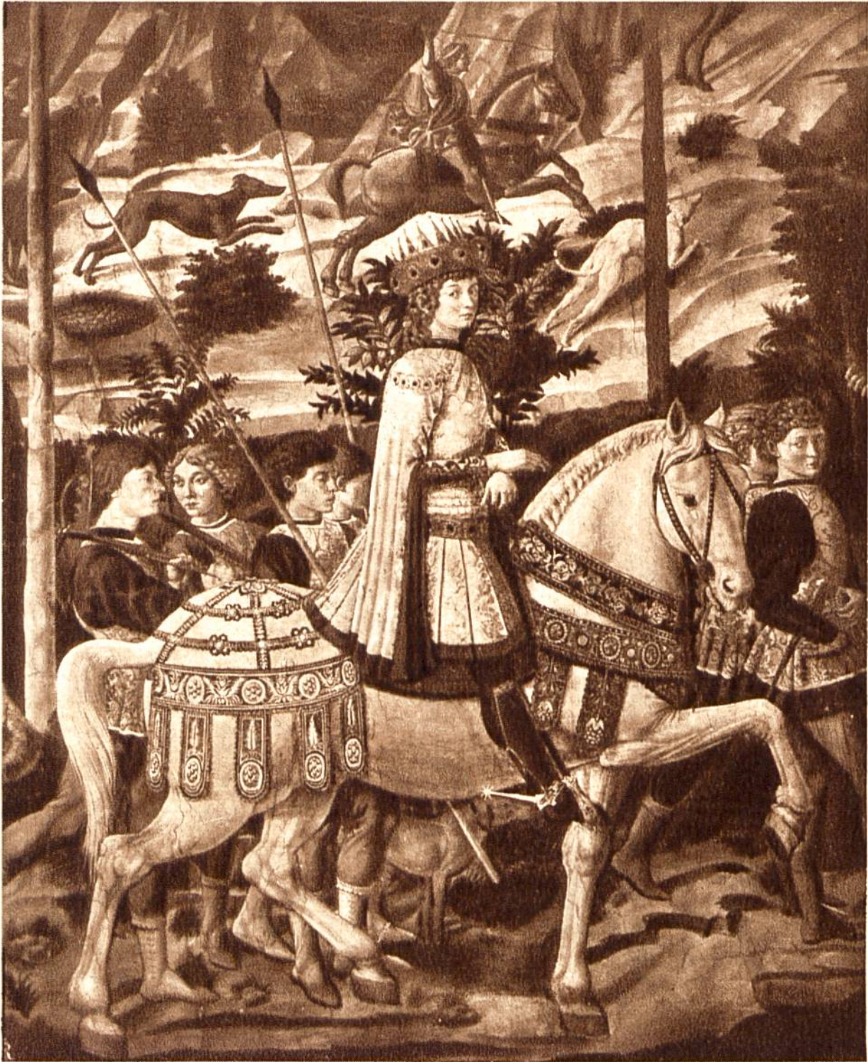
König aus dem Morgenland, von B. Gozzoli, Florenz, 1420—1497. (Palazzo Riccardi, Florenz.)