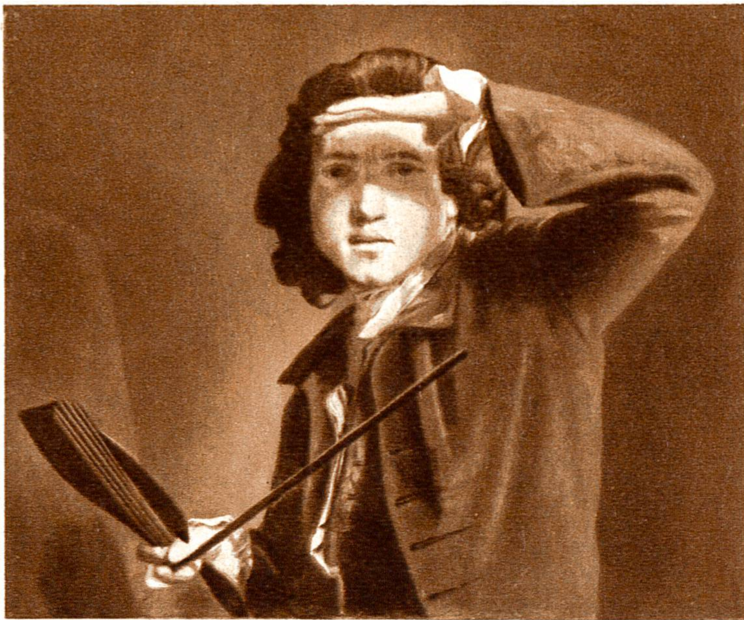
Selbstbildnis, von Joshua Rey- nolds, London, 1723—1792. (National Portrait Gallery, London.)