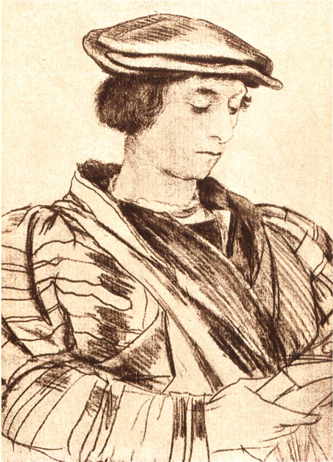
John More, von Hans Holbein d. J., Basel, 1497—1543. (Windsor Castle.)