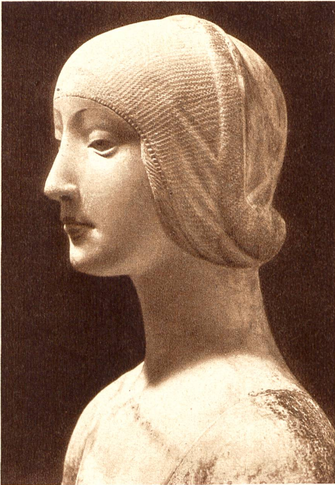
Mädchenkopf, Marmorbüste von Francesco Laurana, Neapel, um 1420—1502. (Nationalmuseum, Palermo.)