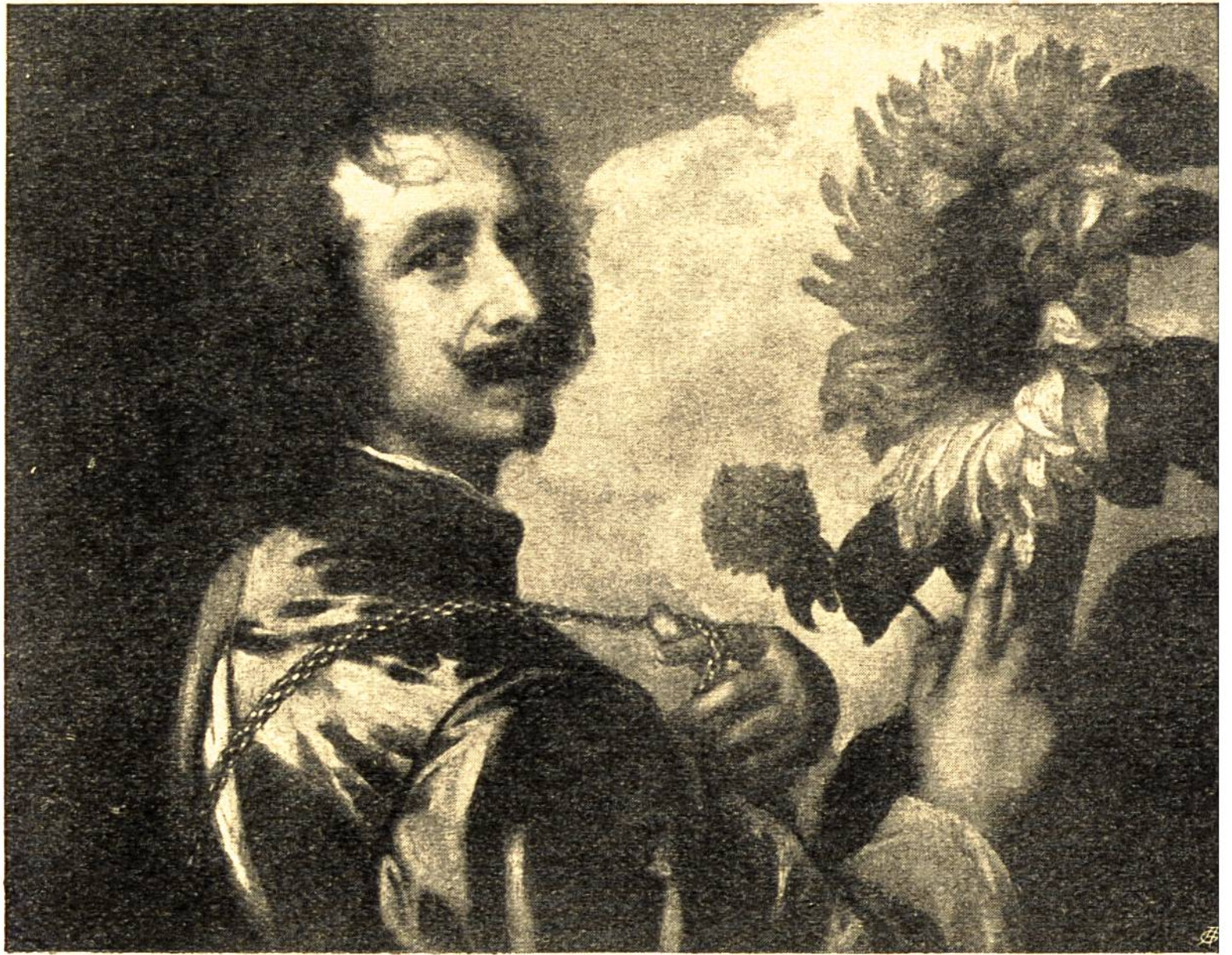
Selbstbildnis von Anton van Dijk, Antwerpen, 1599 bis 1641. Kollektion Westminster.