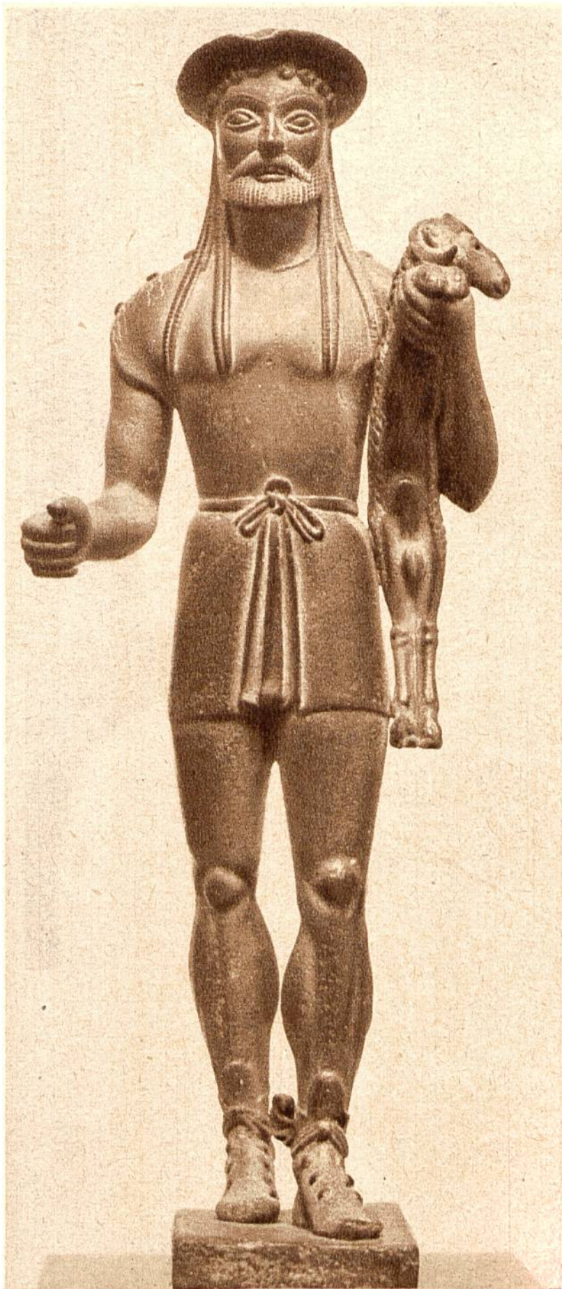
Hermes mit Wid- der. Altgriechische Bronze - Statue, ca. aus dem 6. Jahrhun- dert v. Chr. (Kunst- museum, Boston.)