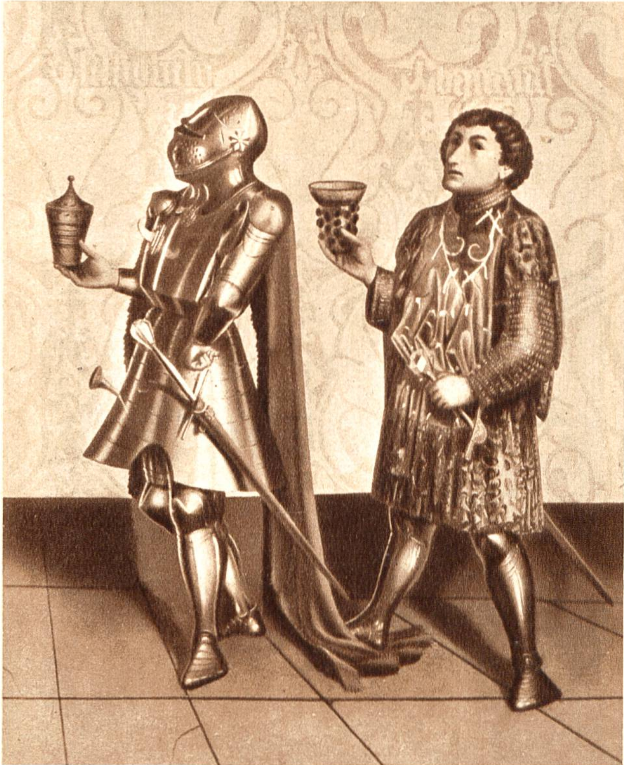
Zwei Helden bringen dem dürstenden König David Wasser, von Konrad Witz, Basel, um 1395—1447. (Kunstmuseum, Basel.)