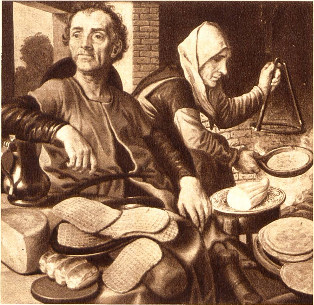
Pfannkuchen-Backen, von Pieter Aertsen, Antwerpen, 1508—1575. (Boymans Museum, Rotterdam.)