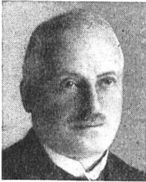
Dr. Gius. Motta von Airolo * 1871, seit 1912 im Amte Polit. Departem.