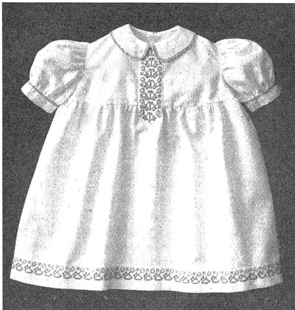
Gesticktes Kinder- kleidchen.