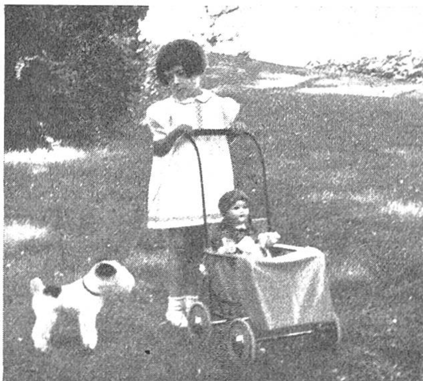
Lotti auf der Spielwiese.

Kehrnähte zu verbinden. Der Kragen wird doppelt. Von jedem Kragenteil wird der Oberstoff mit dem Futterteil zusammengenäht, und der Kragen wird umgedreht, damit die Naht nach innen zu liegen kommt. Der Kragen wird so auf den oberen Rockteil gesteckt, wie er fer-