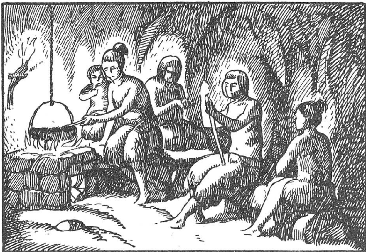
Höhlenbewohner am Herdfeuer.

Wind und Wasser zu schützen. Der Mutigste von allen trug es in seine Höhle, und siehe, das Feuer leuchtete im Dunkel des Raumes, Licht und Wärme spendend, wie die Gestirne des Himmels. Doch nie durfte der göttliche Gast unbesorgt bleiben; eine eigene Höhle wurde ihm eingeräumt und die Würdigsten jedes Stammes bewachten das Feuer Tag und Nacht. Wehe dem, der die Flamme erlöschen liess! Dieses Verbrechen wurde mit dem Tode bestraft.