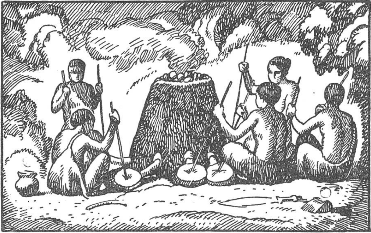
Erzgewinnung in primitivem, mit Blasebälgen angefachtem Ofen.

Und wieder vergingen Jahrtausende, — da beachteten die Menschen einmal, wie aus erzhaltigem Gestein am Feuer eine glänzende Masse, ein Metall ausfloss und beim Erkalten erstarrte. Sie lernten vorerst das leicht schmelzbare Zinn verarbeiten, später aber auch, in hoher Glut, Kupfer schmelzen. Eine Verbindung von Zinn und Kupfer ergab die Bronze, die sich infolge ihrer Härte und Dauerhaftigkeit zur Herstellung von Waffen und Werkzeugen vorzüglich eignete. Aber Zinn und Kupfer waren selten. Das Material zu den Bronzebeilen, die wir in Schweizerseen finden, brachten vor bald 3000 Jahren Händler aus fernen Landen und vertauschten es als kostbares Gut an die Ureinwohner der Schweiz.