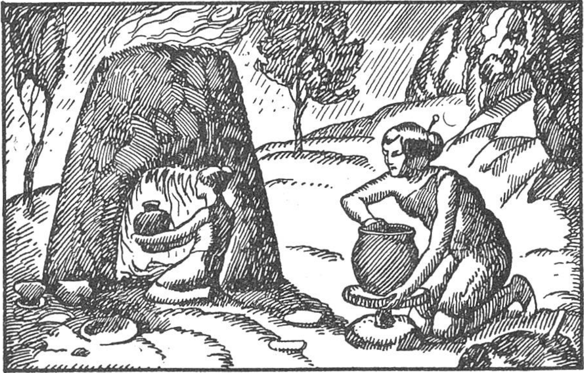
Unsere Urahnen beim Tonformen und -brennen.

schönes Sinnbild erhalten, das an die religiösen Gebräuche ältester Zeit erinnert. So unterhielten bis vor kurzem in Steiermark Feuerwächter ewige, reine Flammen und waren dafür von allen Steuern befreit. Im Frühjahr zündeten die Bauern auf den Äckern Reisighaufen mit Glut von der heiligen Flamme an. Der Rauch, der über die Felder strich, sollte die Saat vor Schaden bewahren. Der Feuerwart erhob die Hand zum Schwur, dass er das Jahr hindurch die Flamme immer getreulich gepflegt habe und dass es noch die gleiche Flamme sei, die einst im germanischen Walde „die weisse Frau“ seinem Urahn geschenkt habe.