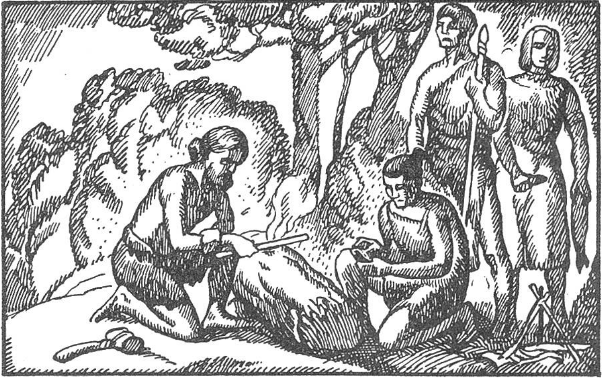
Die Menschen erlernen Feuer zu erzeugen.

und Licht wurde die Höhle wohnlicher und fing die menschliche Heimstätte an, sich von dem Unterschlupf wilder Tiere zu unterscheiden.