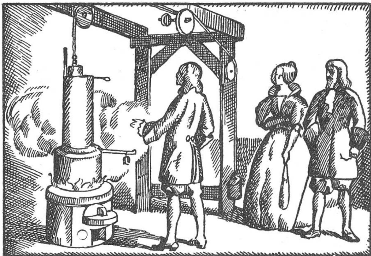
1690 Papin baut eine Dampfmaschine und verwendet das Feuer zur Krafterzeugung.

Eroberung der Flamme den Menschen gekostet hat. Es ahnt nicht, dass in unkundiger Hand das bezwungene Element plötzlich seine Fesseln brechen und den Kampf von neuem aufnehmen kann. Wenn dann die Flammen gierig unsere Wohnstätten erfassen, um in wilder Wut alles zu vernichten, was uns teuer ist, dann ergreift uns wieder das Gefühl von Angst und Schwäche, das unsere Vorfahren im Kampfe mit dem Feuer überwunden haben.