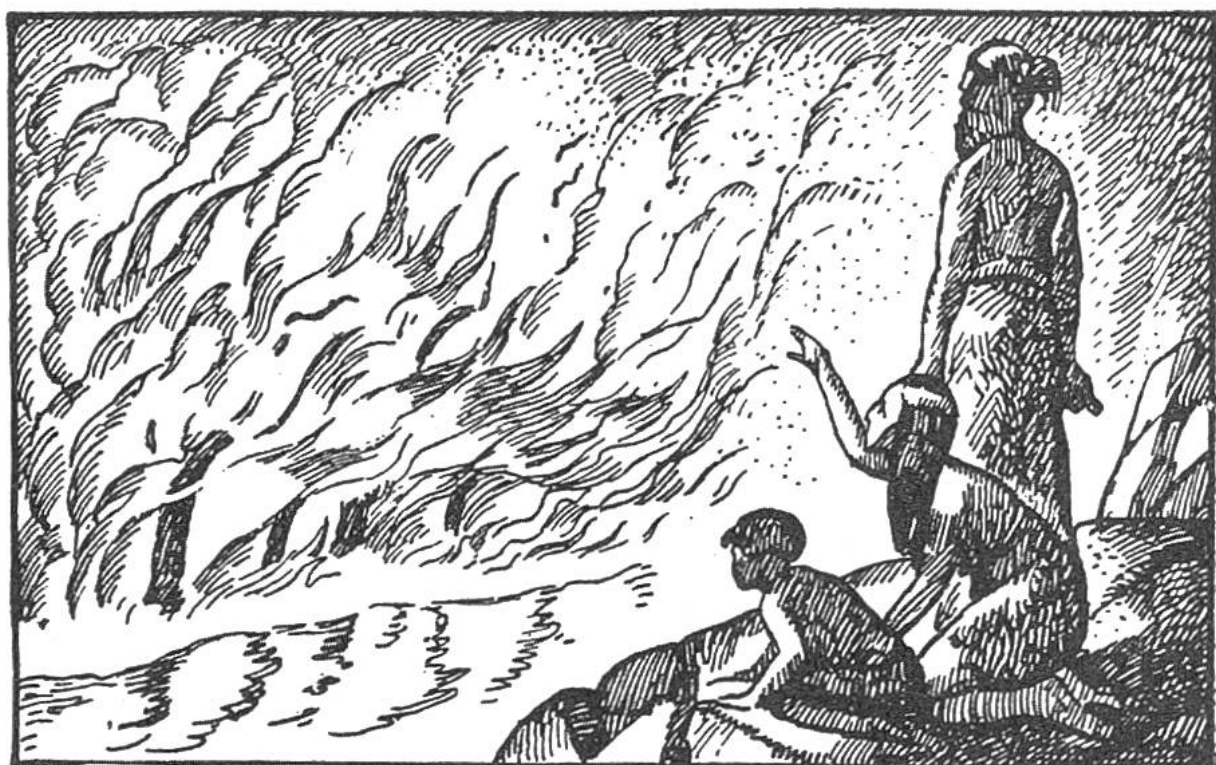
Urmenschen betrachten einen Waldbrand.