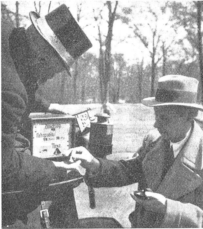
Taxameter, die den Fahrpreis angeben, wurden erstmals 1894 in Deutschland auf Pferdroschken eingeführt.

Anzahl der Kilometer jeder einzelnen Fahrt auf 100 Meter genau anzeigt. Letztere Zählvorrichtung wird bei Beginn jeder Fahrt auf 0 zurückgestellt.