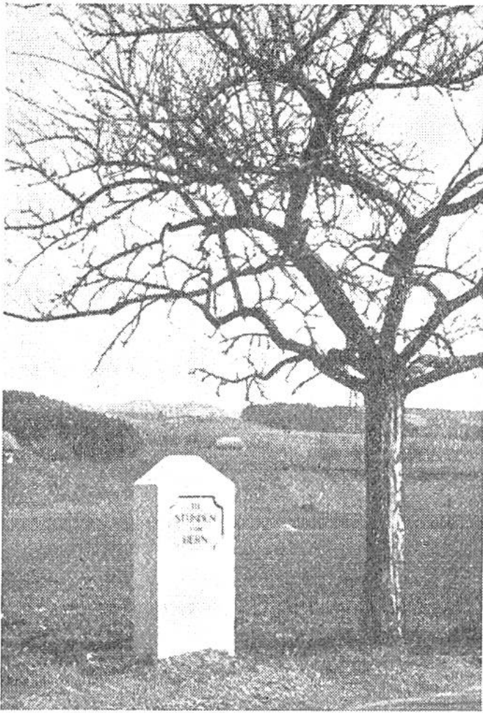
Stundenstein der alten Republik Bern. Er gibt die Entfernung von Bern an. (Eine Wegstunde = 4,8 km.)

zu stossende Vorrichtung war grundsätzlich gleich konstruiert wie die römischen Wegmesswagen. Beim englischen Wegmesser gab ein Zeiger auf einem Zifferblatt die Zahl der Radumdrehungen an. Es konnte also in jedem Augenblick festgestellt werden, welche Strecke seit dem Ausgangspunkt zurückgelegt worden war. Das 1. Bild zeigt einen nach dem gleichen Prinzip arbeitenden Wegmesswagen aus dem 17. Jahrhundert. Man erkennt das Zifferblatt des Wegmessers hinter dem Kutschersitz. Aus der jederzeit ersichtlichen Länge der zurückgelegten Strecke liess sich die Fahr-taxe berechnen. Der moderne Taxameter, der, wie unser 5. Bild beweist, trotz seiner unscheinbaren Grösse eine komplizierte mechanische Vorrichtung enthält, gibt direkt und fehlerfrei den für die Fahrt zu entrichtenden Betrag an. Heute ist in jedem Automobil ein Kilometer-Zähler eingebaut, der zur gleichen Zeit das Total der gefahrenen Kilometer, die jeweilige Geschwindigkeit in Kilometer und die