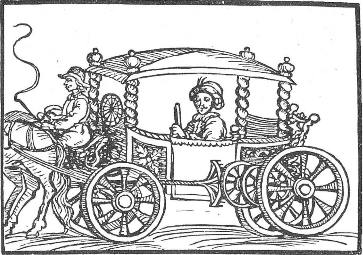
Wegmesswagen aus dem 17. Jahrhundert. Zwischen den Wagenrädern sieht man die Zahnrad-Übersetzung, die mit dem Zifferblatt, hinter dem Kutschersitz, in Verbindung steht.