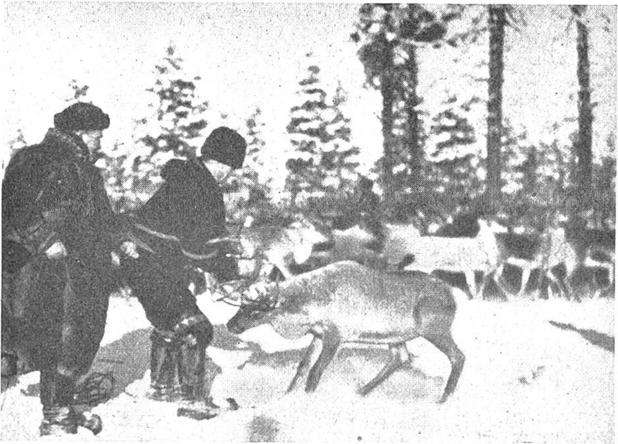
Renntiere sind störrisch; es braucht kräftige Fäuste und starke Stricke, um widerspenstige Tiere ins Gehege zu bringen.

die Nordländer nicht mit Erfolg die Renntier z u c h t betreiben würden. Für den Lappländer oder L a p p e n ist das Renntier die Grundlage seiner Existenz. Es bedeutet ihm noch mehr, als dem Wüstenbewohner das unentbehrliche Kamel; vom Renntier stammen Fleisch und Milch für die Nahrung, Pelzwerk und Leder für die Kleidung, und, vor den Schlitten gespannt, dient es als Zugtier. In alten Zeiten wurden die Knochen der Renntiere zu Waffen und Werkzeugen, die Sehnen zu Stricken verarbeitet. — Das ganze Dasein des Lappen richtet sich nach den Lebensgewohnheiten des Renntiers. Wenn er das Wild auch bis zu einem gewissen Grade zu zähmen vermag, so ist es darob noch lange kein Haustier geworden. In einem Stall würde es nach kurzer Zeit eingehen. So folgen die Lappen den Renntierherden von einer Weide zur andern und leben als Nomaden in Zelten. Sie trotzen der fürchterlichen Kälte des Polarwinters und ertragen die Qualen der sommerlichen