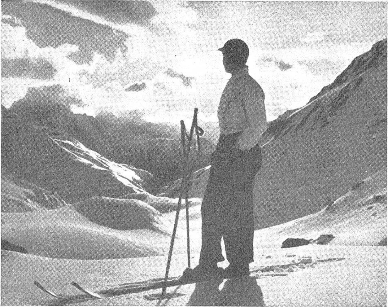
Im Banne der Landschaft. Ein prächtiger Wintertag im Hochgebirge, Sulzschnee und wechselndes Spiel der Wolken.

Im Berner Oberland wurde erstmals im Januar 1897 eine grössere Skitour ausgeführt. Vier Touristen aus Strassburg und Freiburg i. Br. wanderten innert sechs Tagen von Guttannen im Haslital über den Unter- und Oberaargletscher und den grossen Aletschgletscher ins Rhonetal. Es dauerte aber noch fast ein Jahrzehnt, bis man nach richtiger Anleitung die Vorteile des Skifahrens und des Wanderns im Winter schätzen lernte. In den letzten dreissig Jahren ist dann der Ski Allgemeingut geworden und damit auch das Wissen um Winterpracht und Winterfreuden. Hunderttausende ziehen Jahr für Jahr in die Schweizerberge und finden in reiner Winterluft Erholung und neue Lebenskraft. — Winterkuren und Wintersport haben überdies der einheimischen Fremdenindustrie eine neue Grundlage gegeben, ohne welche sie heute nicht mehr bestehen könnte. ho.