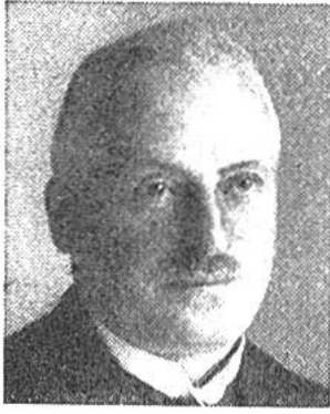
Dr. Gius. Motta von Airolo * 1871, seit 1912 im Amte Polit. Departem.