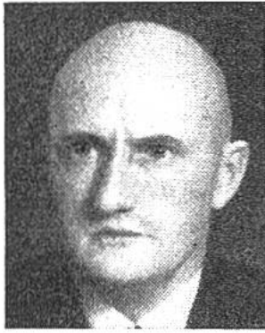
Philipp Etter von Menzingen (Zug) * 1891 seit 1934 i. Amte Dep. des Innern