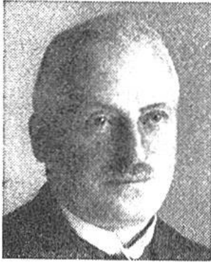
Dr. Gius. Motta von Airolo * 1871, seit 1912 im Amte Polit. Departem.