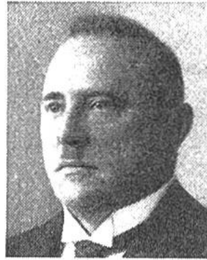
Rudolf Minger v. Mülchi (Bern) * 1881, seit 1930 im Amte Militärdepartem.