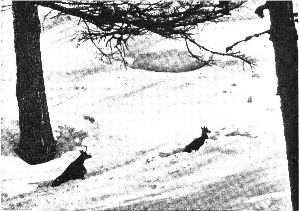
Gemse mit Kitz im tiefen Schnee watend auf der Suche nach Futter.

manches Tier dem Hungertod entrissen worden. Diese Notfütterung durch hilfsbereite Wildfreunde setzt aber eine gewisse Erfahrung voraus, damit nicht mehr geschadet als genützt wird.