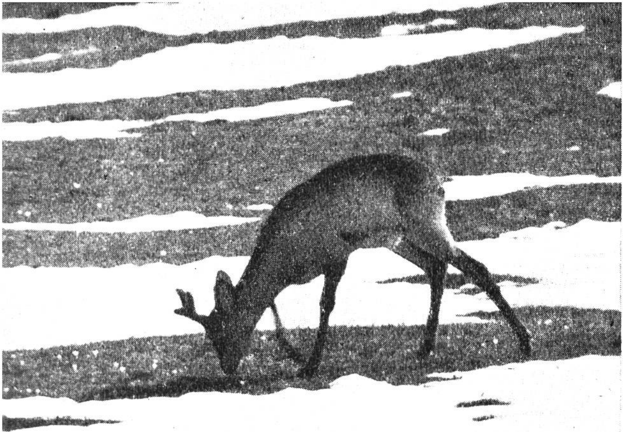
Zweijähriger Rehbock äst die ersten Krokusse, die auf der Waldwiese blühen.

Ausgang aus seiner Winterwohnung noch dick mit Schnee zugedeckt ist.