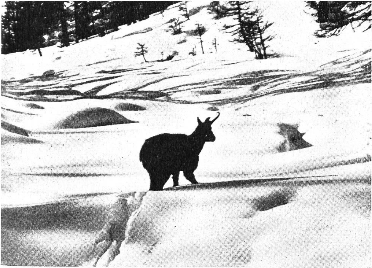
Alter Gemsbock im tiefen Schnee wattend. Wo mag er sein eines Horn verloren haben? Im Kampf oder durch Steinschlag?

zuharren. Als erbitterte Feinde kommen Kälte und Lawinengefahr hinzu und rafften manches Tier hinweg. Erstaunlich ist es, welch feinen Instinkt das Wild in solch grossen Gefahren zu entwickeln vermag. So sah ich einmal, wie ein Gemsrudel von 17 Stück, von einem mächtigen Schneefall überrascht, 2 Tage im Schutze einer Felswand ausharrte. Links und rechts drohten prallgeladene Lawinenhänge sich zu entladen. Am Nachmittag des zweiten Tages machte ein starker Gemsbock einen Ausbruchversuch. Bis zum Bauch einsinkend und vorsichtig den Hang abtastend, kämpfte er sich Schritt für Schritt vorwärts. Er ahnte sehr wohl die schwere Gefahr, in der er schwebte, denn er hielt bei jedem Schritt inne und sicherte nach allen Seiten. Wie er gerade die Mitte der Gefahrenzone erreicht hatte, brach der Schneehang! Wie ein federnder Ball schnellte der Gemsbock zurück und ehe die Lawine sich mit fürchterlichem Getöse dem Tale zuwälzte, hatte er sich in Sicherheit gebracht. Noch fast zwei Stunden