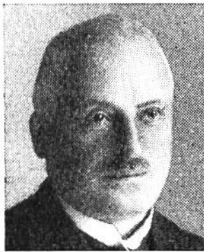
Dr. Gius. Motta von Airolo * 1871, seit 1912 im Amte Polit. Departem.