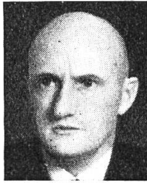
Philipp Etter von Menzingen (Zug) * 1891 seit 1934 i. Amte Dep. des Innern