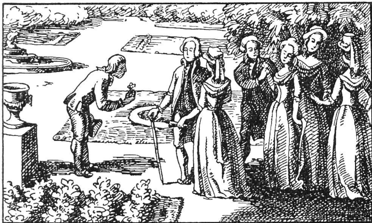
Ludwig XVI. besichtigt in den königlichen Gärten die Kartoffelpflanzungen; er und sein Gefolge schmücken sich mit Kartoffelblüten, um die neue, noch missachtete Pflanze zu Ehren zu bringen.

für des Königs Tafel bestimmt“, war die Antwort. Dann müssen die Früchte aber einen grossen Wert haben, überlegten sich die Bauern. Vergeblich waren sie nun bemüht, etwas davon abzubekommen. Bald hatten sie aber herausgefunden, dass nachts keine Wache aufgestellt war. Schon in der darauffolgenden Nacht kamen einige Plünderer mit Schaufeln, Hacken und Säcken und stahlen soviel, als ihnen möglich war. Noch nie waren Diebe so willkommen; Parmentier, der sich in der Nähe versteckt hielt, rieb sich die Hände vor Freude. Und wirklich, in den kommenden Jahren sah man schon rings um Paris Kartoffeläcker.