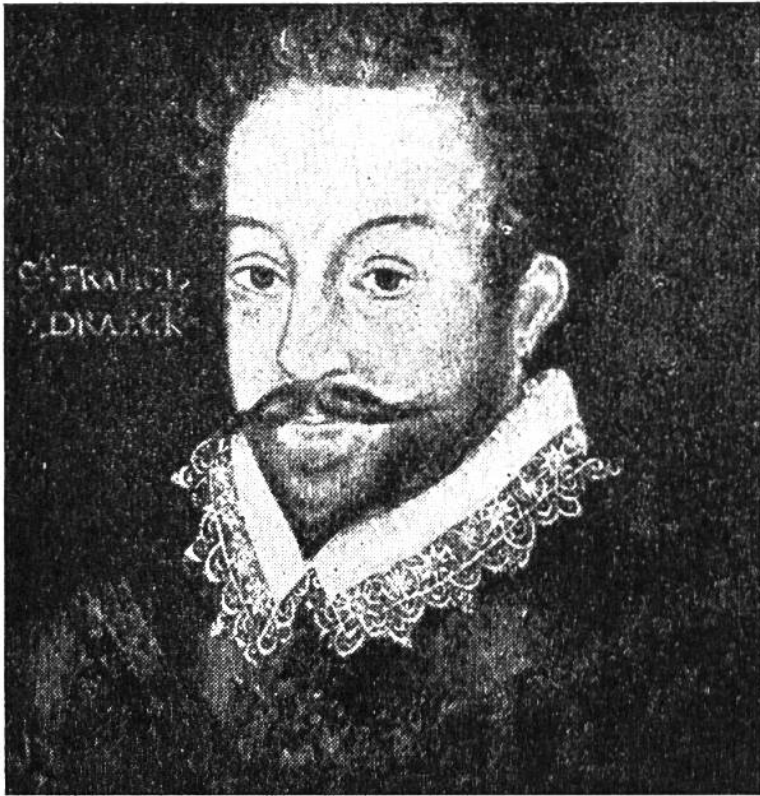
Der englische Seeheld Francis Drake, der auch 1577 die Welt umsegelte, war einer der ersten, der in England Kartoffeln auf Feldern seiner Landgüter anpflanzen liess.

friedlicher mit den Indianern umgegangen, so hätten sie wohl auch von ihnen erfahren, welche gewaltige Bedeutung der Kartoffelpflanze zukommt; so aber dauerte es Jahrhunderte, bis es die Europäer selbst herausfanden; inzwischen mussten sie manche fürchterliche Hungersnot über sich ergehen lassen. Im Laufe der Jahrzehnte kam die Kartoffel von Spanien nach Italien und von dort nach Frank-