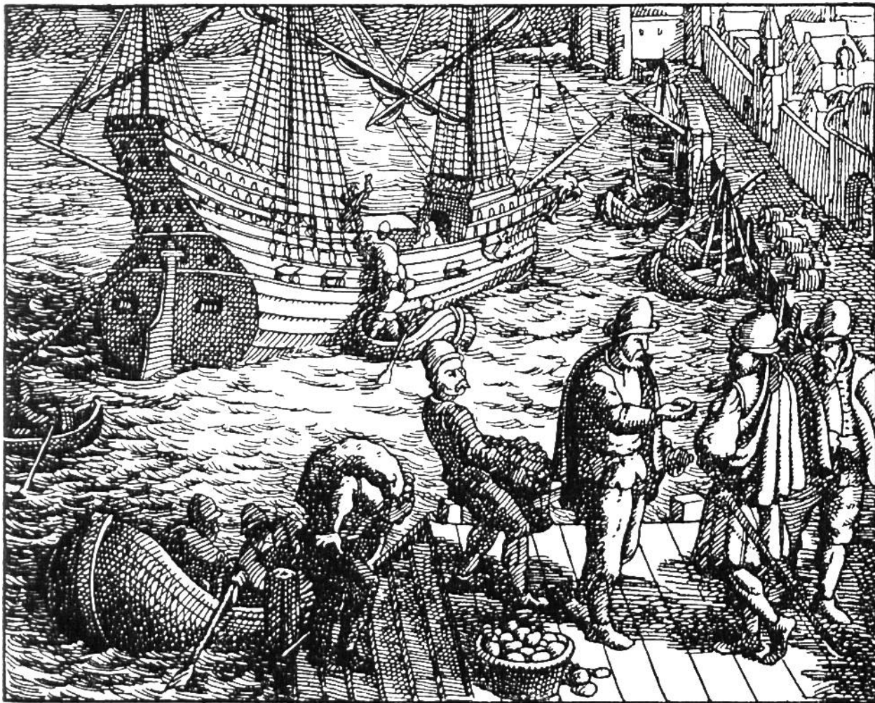
Englische Seefahrer bringen Kartoffeln aus dem neuentdeckten Erdteil.

dische Botaniker Linné aus Bauhins grossem Pflanzenwerk. Leider sind wir Schweizer undankbar gegen unsere Gelehrten und bedeutenden Männer. Wir lassen sie in Vergessenheit geraten.