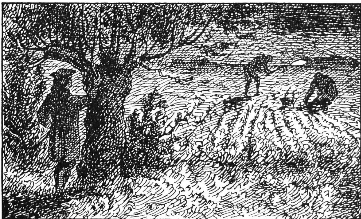
Der in der Nacht hinter einem Baum versteckte Parmentier freut sich, dass ihm seine Kartoffeln gestohlen werden.

zum grössten Teil. Auch Ärzte warnten vor dem Genuss von Kartoffeln, weil die Pflanze, wie die Tollkirsche und verschiedenes Giftkraut, der Familie der Nachtschattengewächse angehöre. Nicht erwähnt wurde dabei, dass diese Familie etwa 1800 Arten umfasst und dass ihr auch Pfeffer, Süssholz und die nahe Verwandte der Kartoffel, die Tomate, angehören. Allerdings ist wahr, dass alle grünen Teile der Pflanze einen Giftstoff enthalten und dass sich ein solcher auch in den Keimen, die im Frühjahr aus den Knollen spriessen, bildet. Wenn auch dieser Giftstoff auf den Menschen nicht tödlich wirkt, so ist er doch nicht bekömmlich. Die Knolle aber, die der Mensch einzig geniesst, hat nur nützliche Eigenschaften. Zur Zeit der grossen Hungersnöte von 1793 und 1817 vergass man wieder die üble Nachrede von der Giftigkeit der Kartoffel und begriff endlich allgemein ihre grosse Bedeutung als Volksnahrungsmittel. Einer, der das am besten einsah, war Napoleon I. Er ernannte den grossen Physiker Volta von Como zum Grafen, nicht etwa wegen seiner Entdeckungen auf dem Gebiete der Elektrizität — die erschienen damals noch nicht so bedeutsam —, sondern