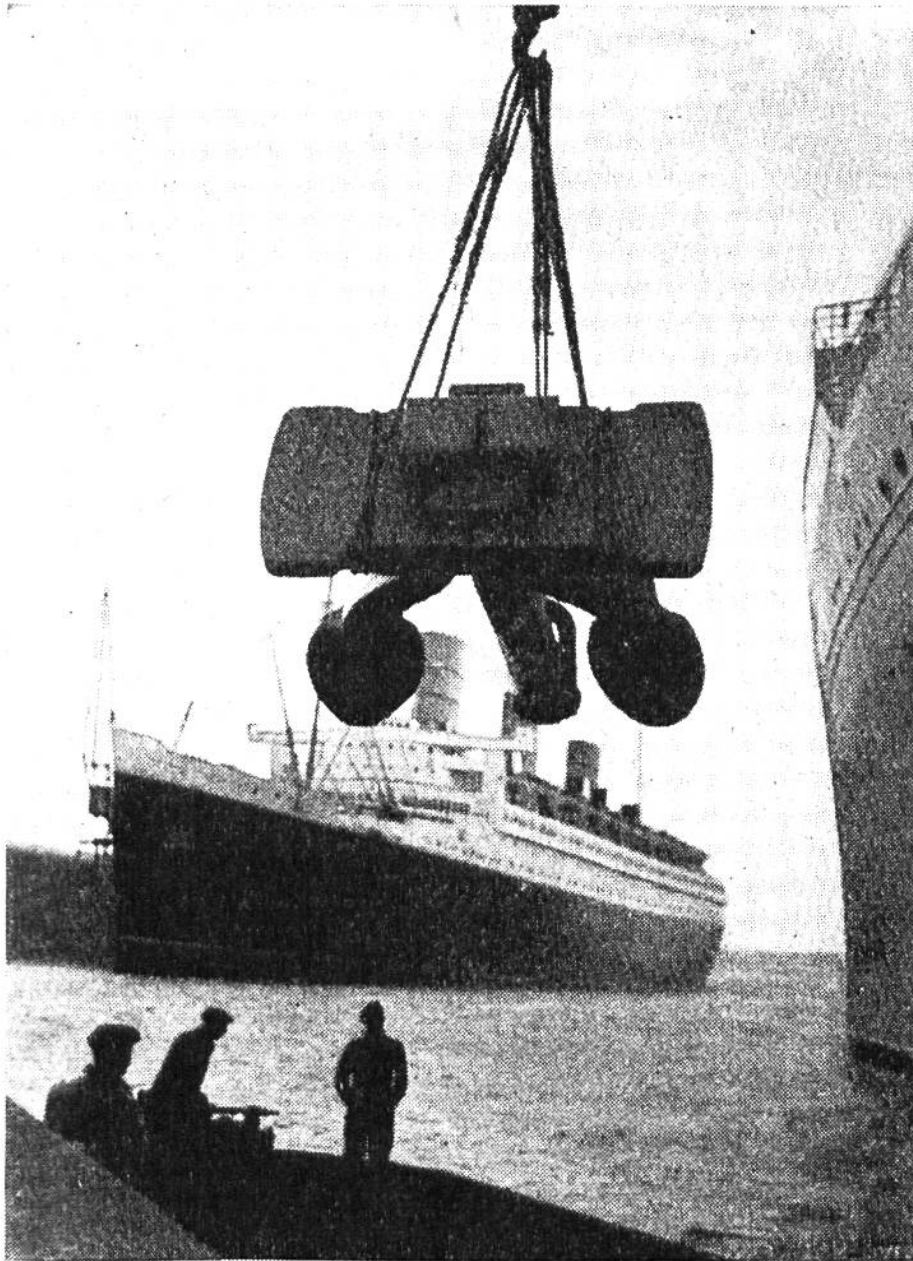
Der neue Anker für den englischen Dampfer „Queen Mary“ wiegt nicht weniger als 14 000 kg. Der Arm des befördernden Riesenkrans reicht bis zu dem im Hintergrunde liegenden Schiff.

Dampfer trotzdem Mängel gezeigt, die man nicht voraussehen konnte, die aber für die Schiffsbauer Millionenverluste bedeuteten. Um solche kostspieligen Erfahrungen zu vermeiden, wird daher nach den Plänen zuerst ein Modell des Ozeanriesen gebaut. In 50facher Verkleinerung entsteht das Schiff mit allen Einzelheiten. Nicht nur die grossen Maschinen und wichtigen Geräte werden nachgebildet, jedes Möbelstück, jeder Lichtschalter entsteht in mühevoller Kleinarbeit. Ein solches Modell kostet bis zu 50 000 Franken. Eine riesige Summe und doch im Verhältnis zu den Gesamtkosten nicht mehr, als wenn ein Bauherr für sein Haus von 40 000 Franken einen Plan für 20 Franken anfertigen liesse.