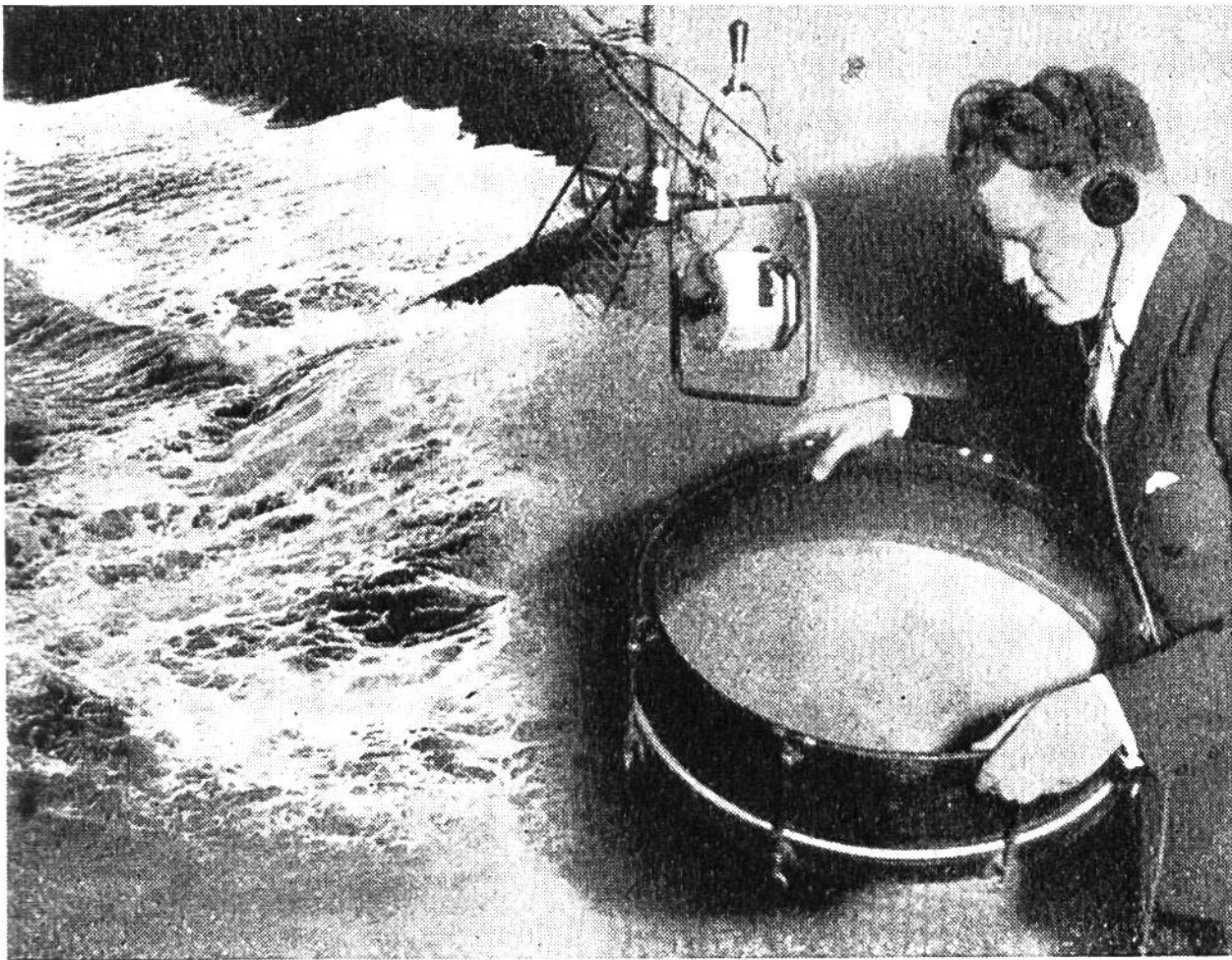
Meeresbrandung vor dem Mikrophon: eine gewöhnliche Trommel, deren Boden mit Bleischrot bedeckt ist, wird sanft geschaukelt .... und der Hörer lauscht dem an- und abschwellenden Tosen der Wellen.

in den Händen, machen auf dem Tisch das Pferdegetrappel; ein anderer rollt Baukastensteine in einem Fass (— „die Kutsche rattert und holpert“), der vierte sorgt für fröhliches Glockengebimmel; ein weiterer lässt mit Hilfe eines kleinen Sperrades die Wagenbremse quietschen und der letzte bedient das „Donnerblech“. Soll nun gar noch ein zünftiger Gewitterregen einsetzen, so lässt man einfach eine Handvoll Reiskörner in einen Korb rieseln, der mit braunem Packpapier ausgefüttert ist. Der Radiohörer wird darauf schwören, dass es „Katzen hagelt“! — Festes, knistriges Packpapier ist zu vielem gut. Vor dem Mikrophon zusammengeknüllt und dazu noch eine leere Zündholzschachtel zerquetscht — genau so tönt das Krachen und Splintern eines abgestürzten Flugzeugs! — Für das Rattern und Stampfen einer Lokomotive genügt zwar ein Stück Papier nicht, wohl aber ein Rollschuh,