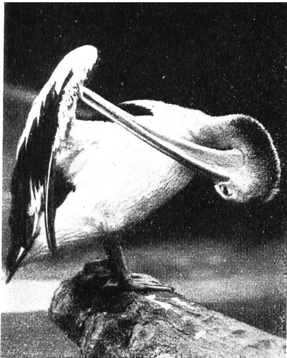
Der Pelikan putzt sich. Sein unförmiger Schnabel eignet sich zwar besser für den Fisch- fang denn als Toilettegerät.

gebieten der untern Donau und am Schwarzen Meer. Besonders zahlreich sind sie in Ägypten, wo sie zu Tausenden die Nillandschaft bevölkern.