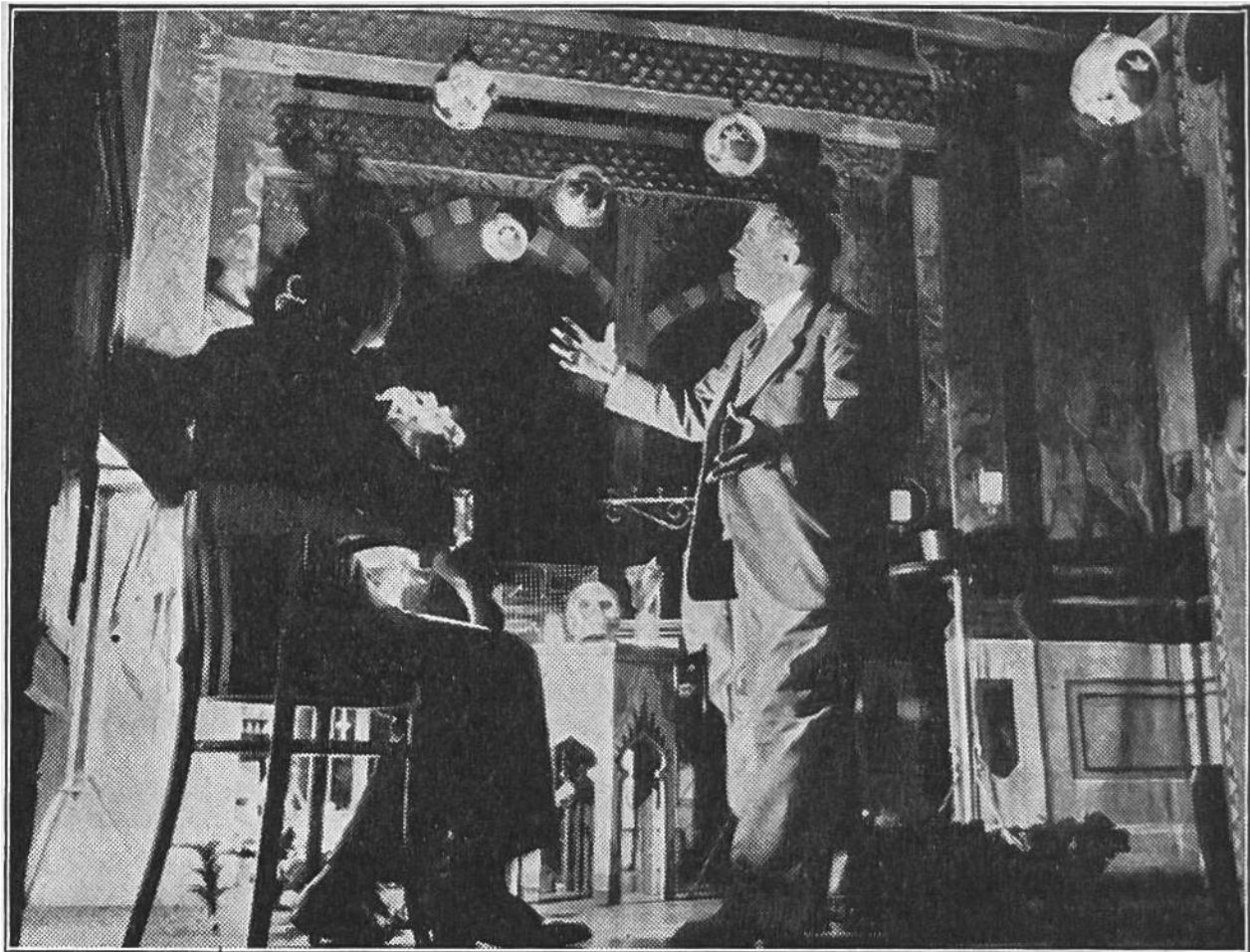
Der Zauberkünstler hat Besuch, der gerne das „Zaubern“ erlernen möchte. Eben erlebt dieser „das Geheimnis der schwebenden Kugel“.