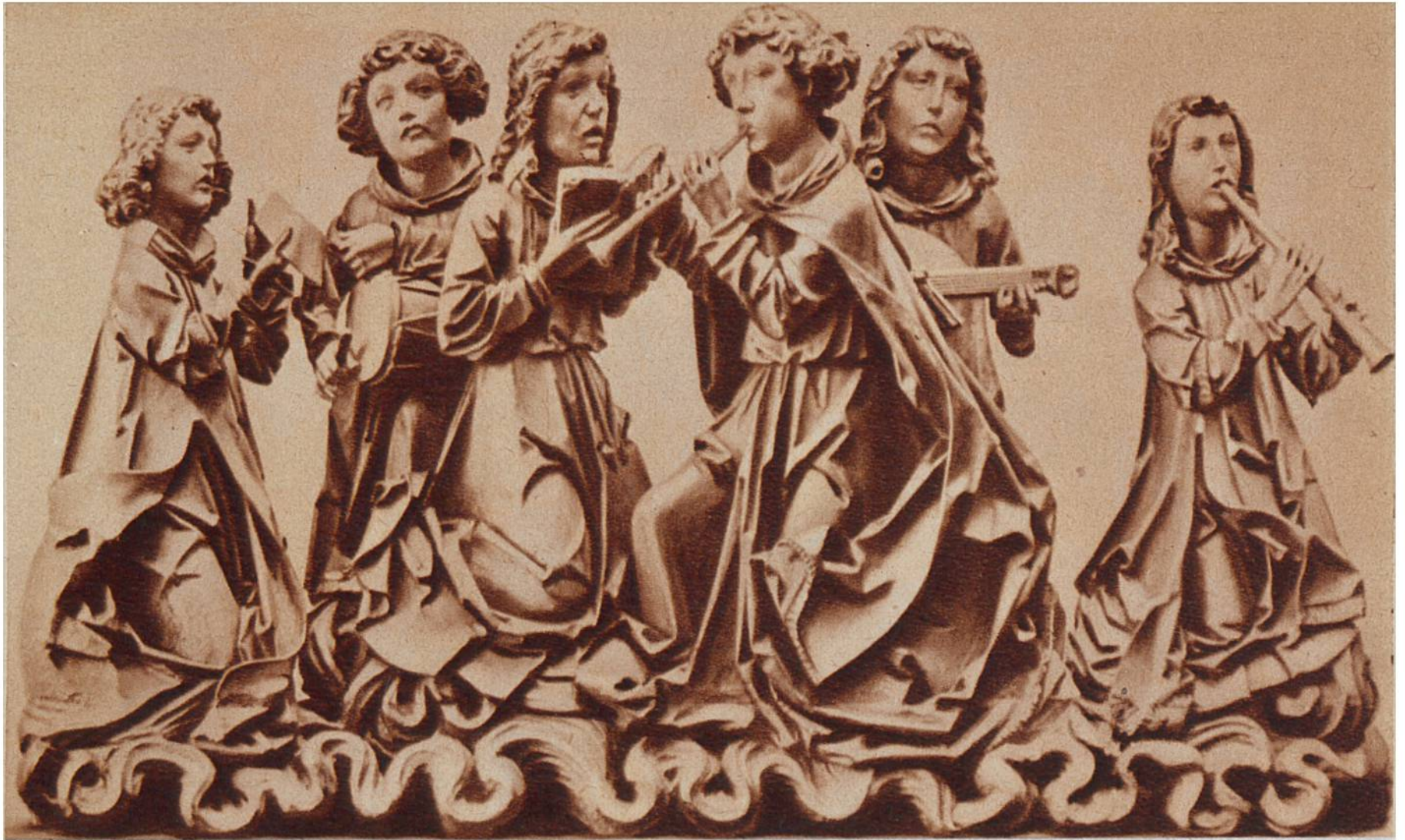
Engelkonzert, von Tilmann Riemenschneider, Holzbildhauer, Würzburg, um 1460—1531. (Deutsches Museum, Berlin.)