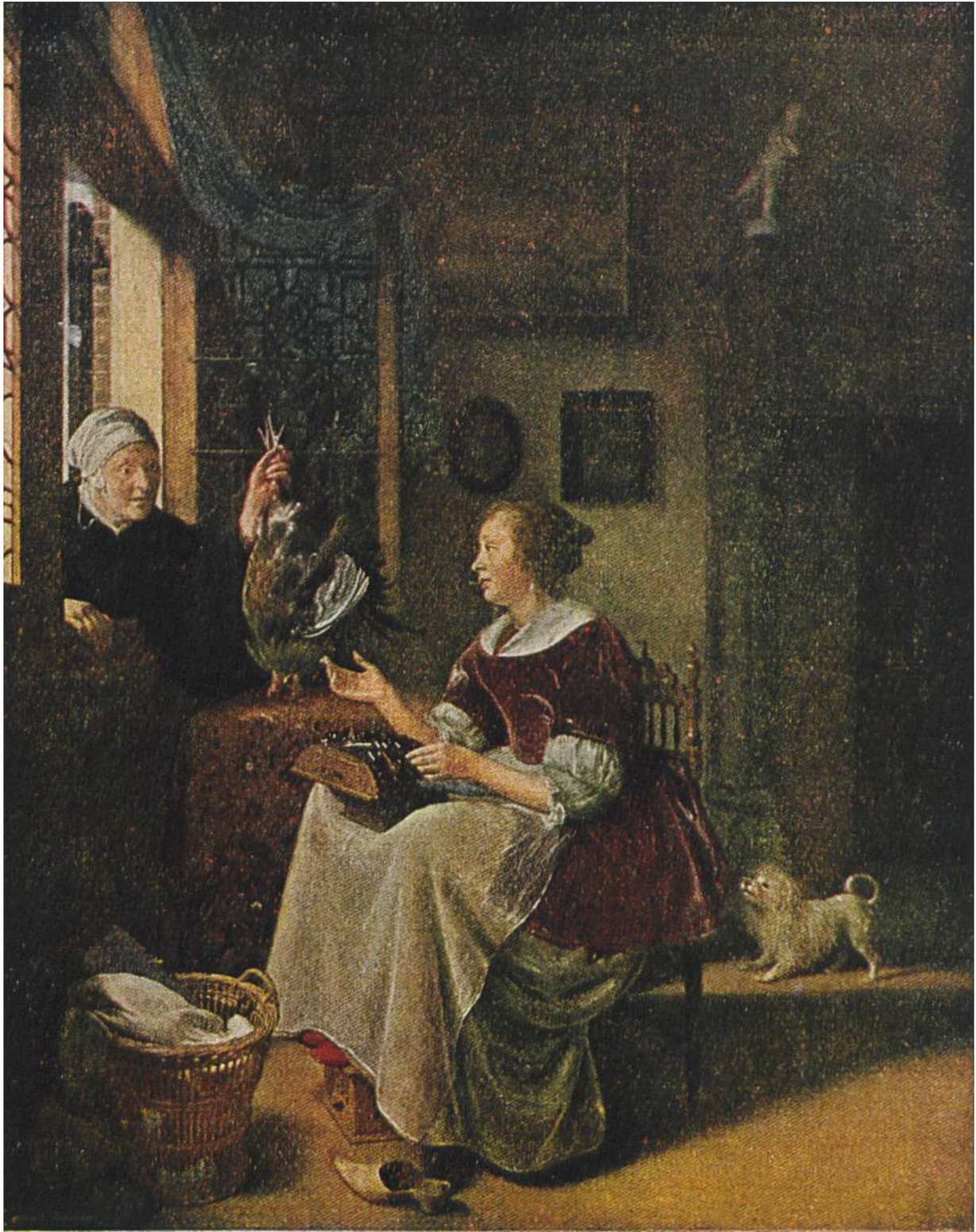
ÜBERREICHUNG EINES HAHNES von Pieter Cornelisz van Slingelandt, Leiden, 1640–1691.