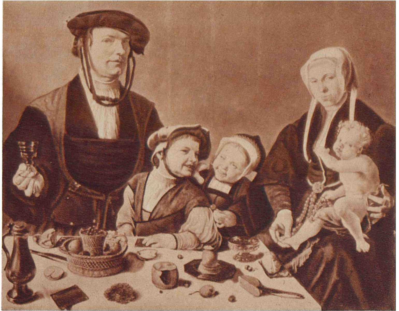
Familienbild, von Jan van Sco- rel, Utrecht, 1495 —1562. (Gemäl- degalerie, Kassel.)