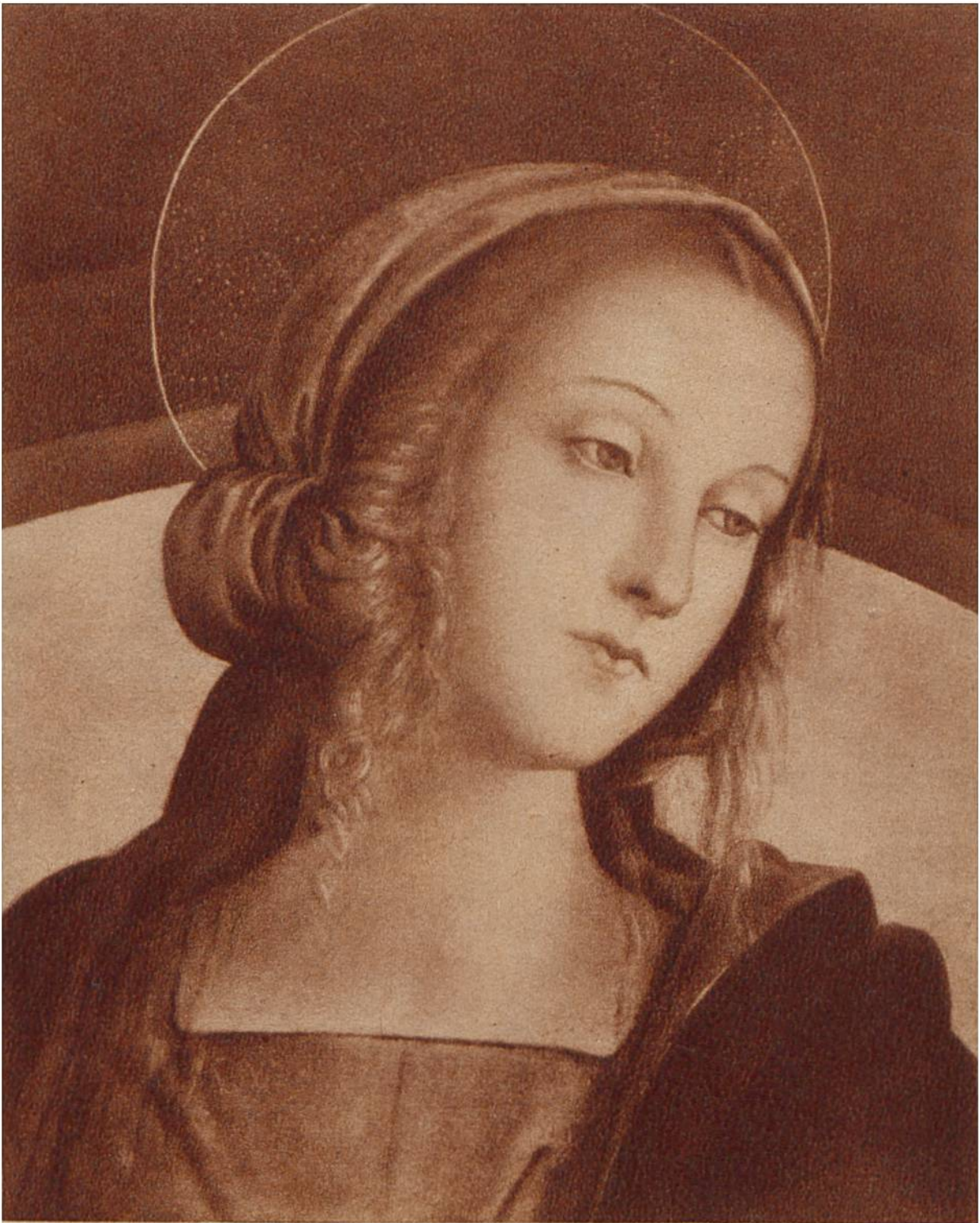
Madonna. Teilstück aus einem Gemälde von Pietro Vannucci, genannt Perugino, Perugia, 1446—1523. (Uffizien, Florenz.)