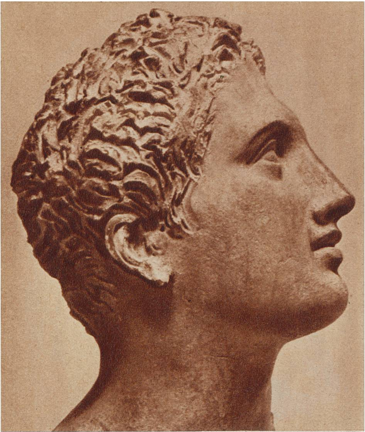
Kopf eines Jünglings. Griechische Büste aus gebranntem Ton, aus dem 4. Jahrhundert vor Chr. (Museum, Berlin.)