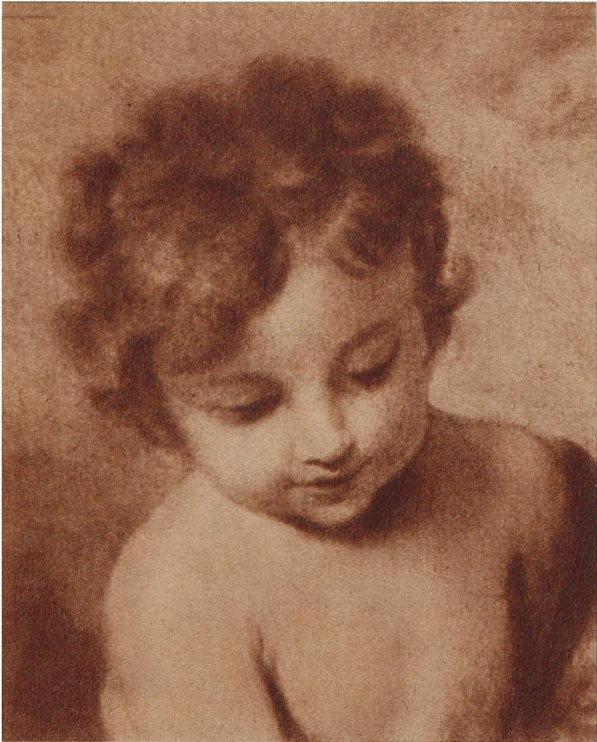
Christuskind. Ausschnitt aus einem Gemälde von Bartolomé Estéban Murillo, Sevilla, 1617—1682.