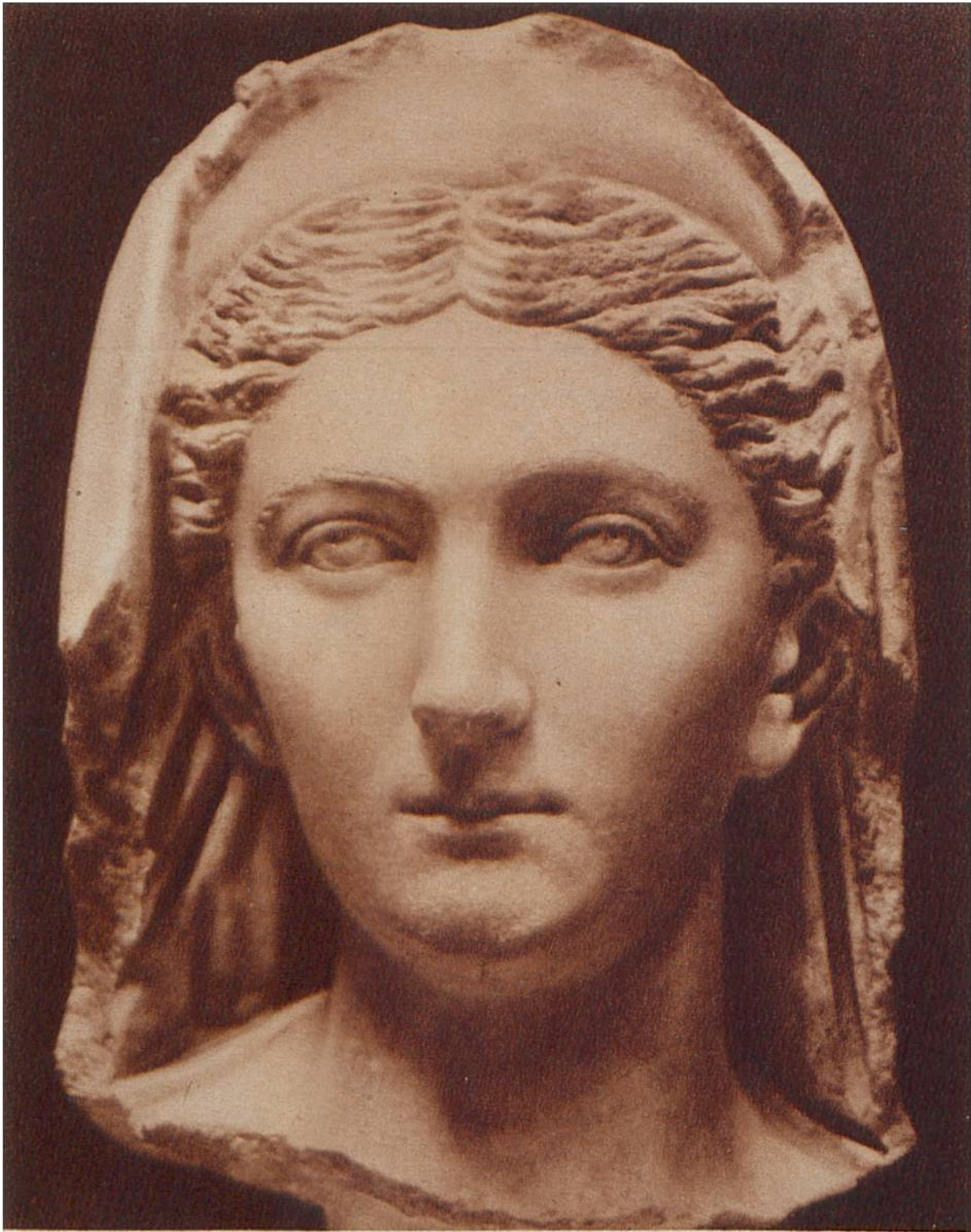
Kopf der Sabina, der Gemahlin von Hadrian (römischer Kaiser von 117—138 nach Chr.).