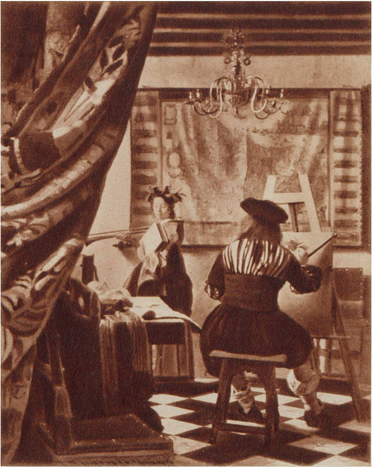
Der Künstler im Atelier, von Jan Vermeer, Delft, 1632—1675. (Czerninsche Sammlung, Wien.)