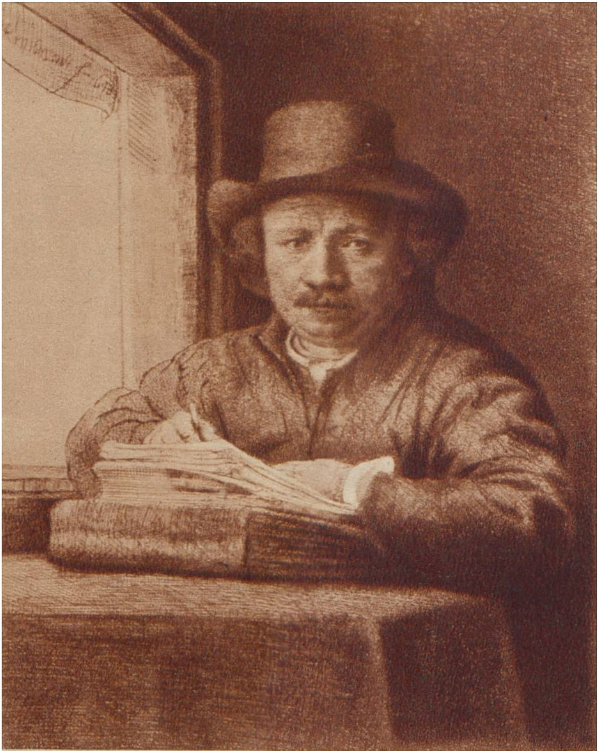
Rembrandt, zeichnend. Selbstbildnis, Radierung von Rembrandt van Rijn, Amsterdam, 1606—1669.