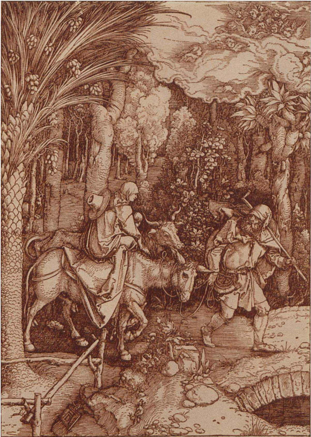
Die Flucht nach Aegypten. Holzschnitt von Albrecht Dürer, Nürnberg, 1471—1528.