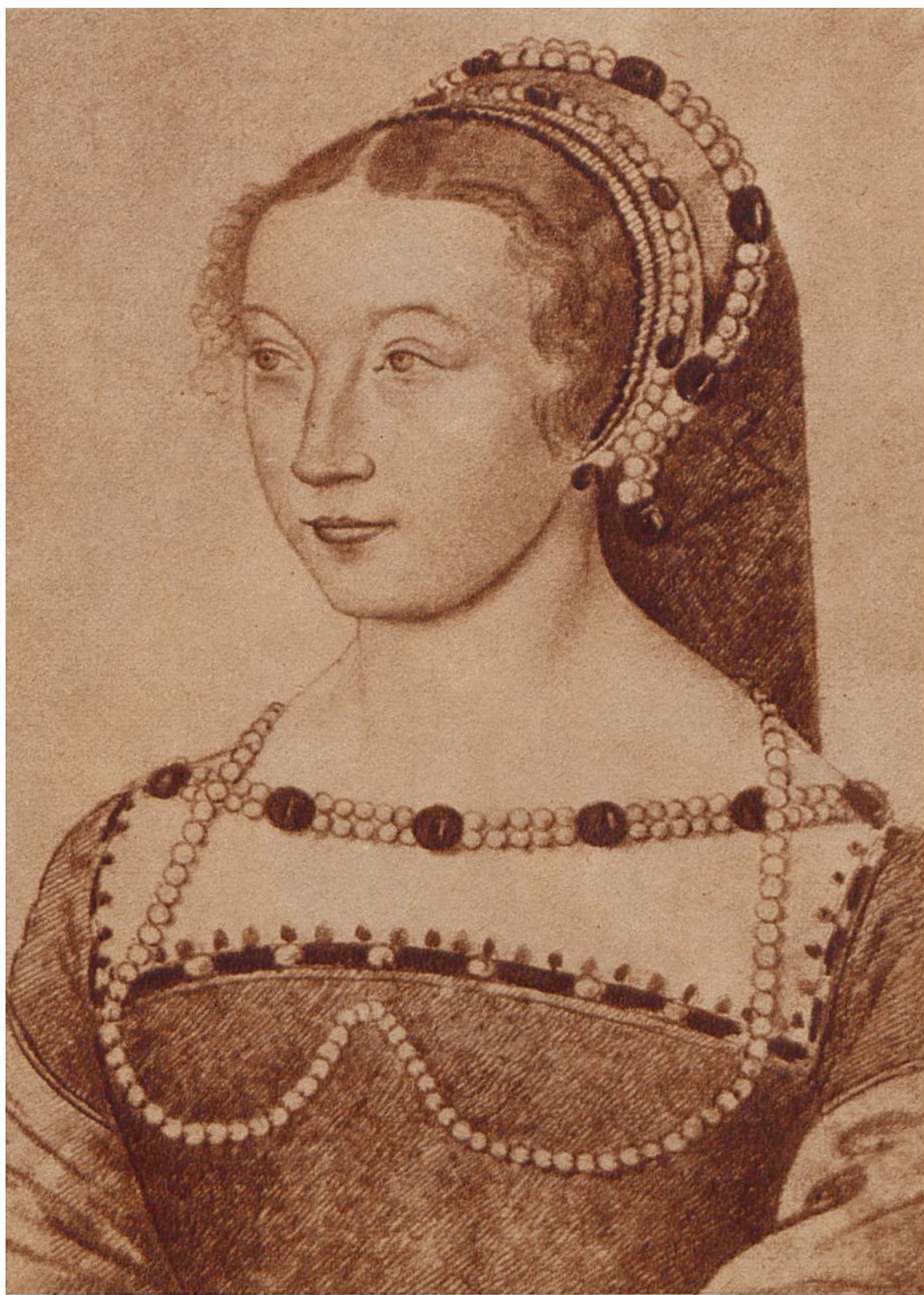
Frauenkopf. Zeichnung von François Clouet, französischer Hofmaler, Paris, um 1510—1572.