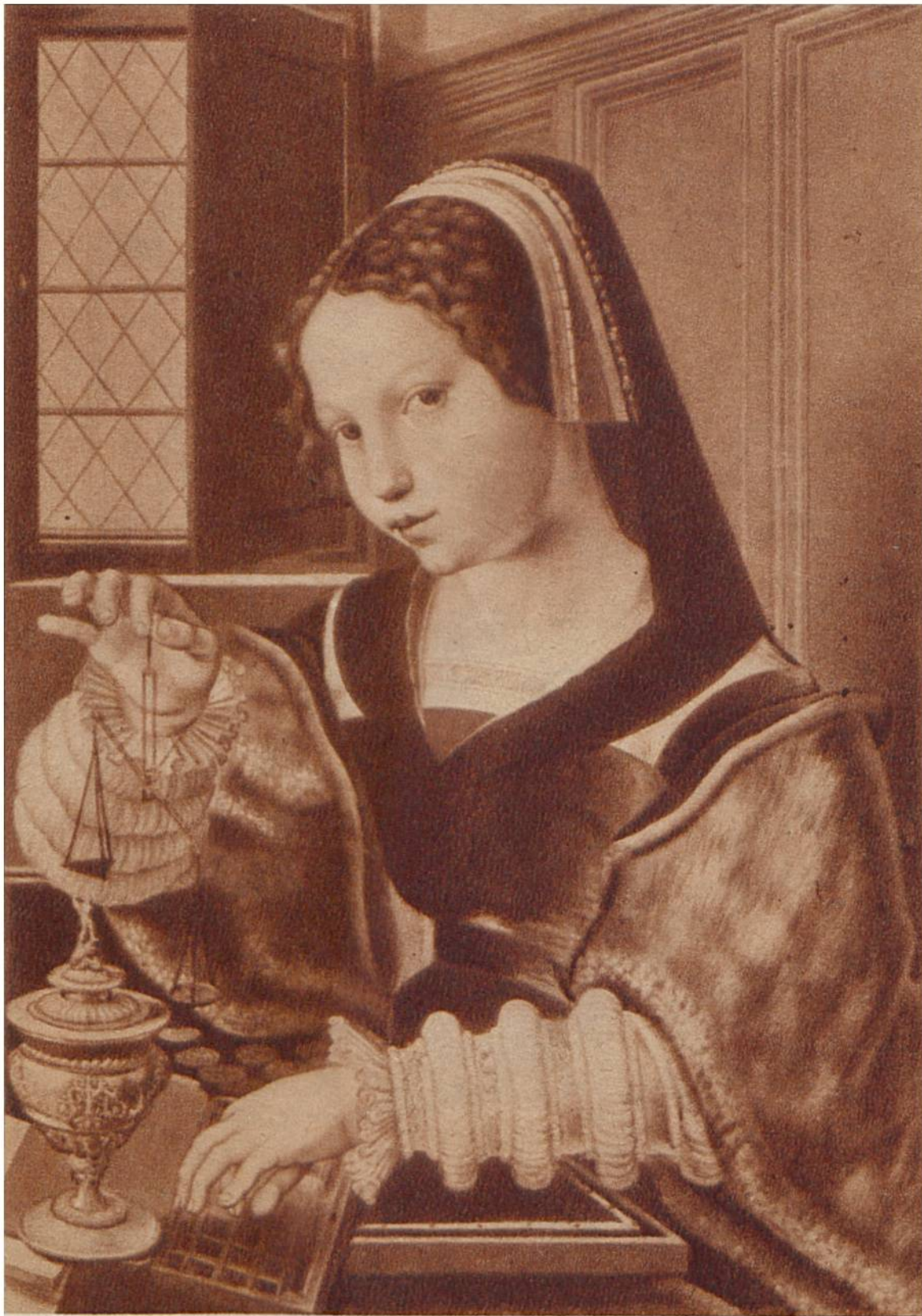
Die Goldwägerin, von Jan Gossaert, genannt Mabuse, Maubeuge, um 1478—1536. (Gemäldegalerie, Berlin.)