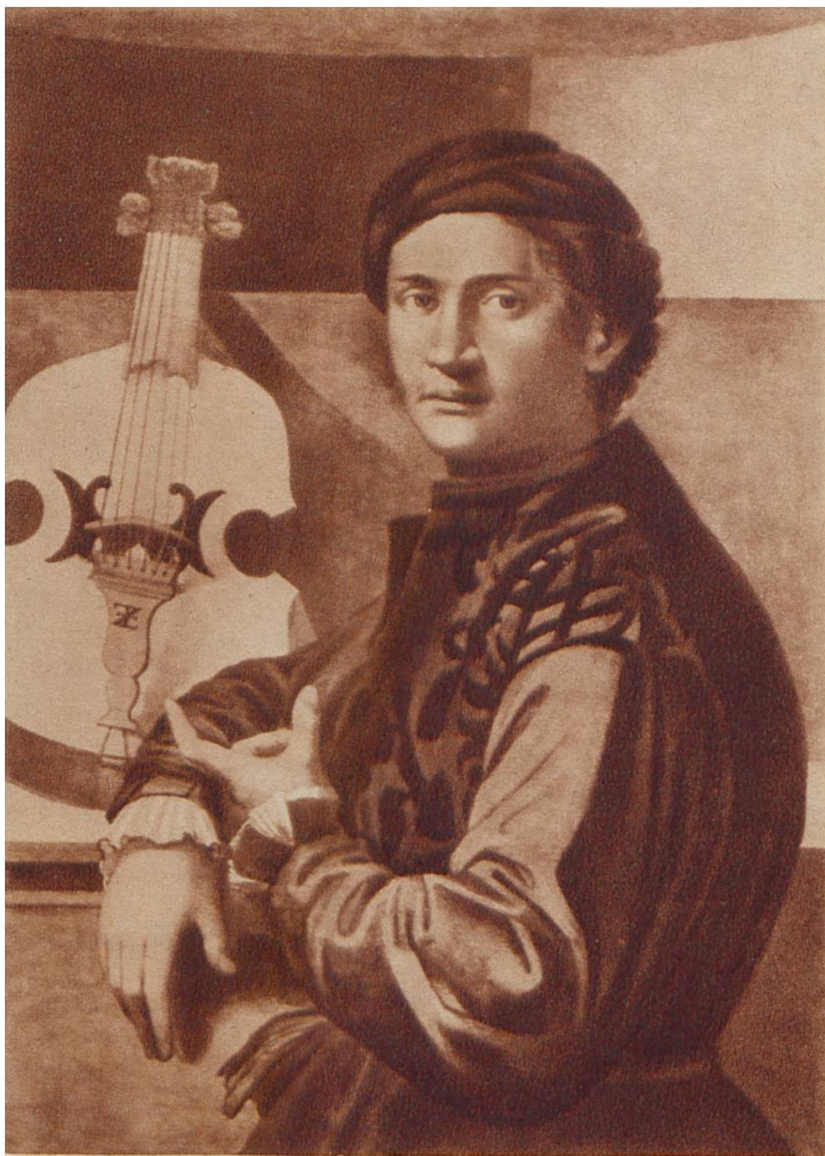
Bildnis eines Musikers, von Paolo Zaccaria, dem Aeltern, Vezzano (Provinz Trient), Anfang 16. Jahrhundert. (Louvre, Paris.)