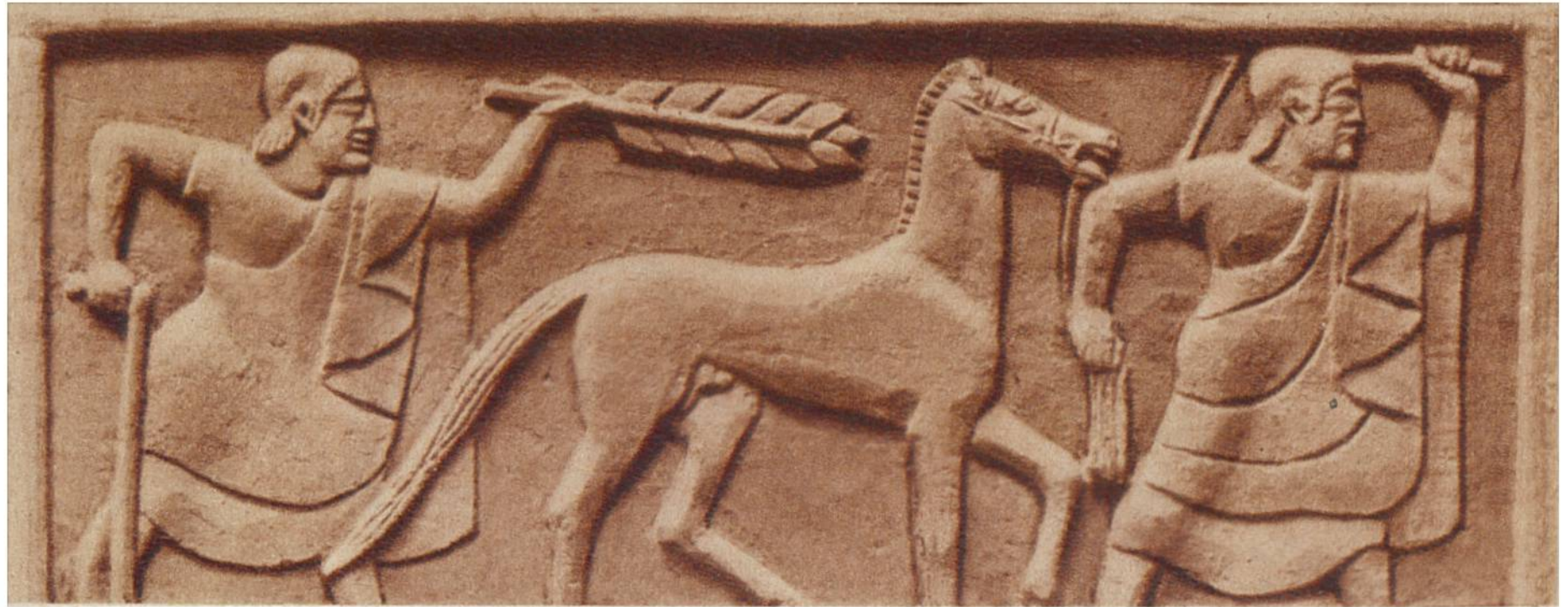
Pferdewärter mit Füllen. Darstellung auf einer etruskischen Graburne, 520—500 vor Chr. Gefunden in Chiusi (Mittelitalien).