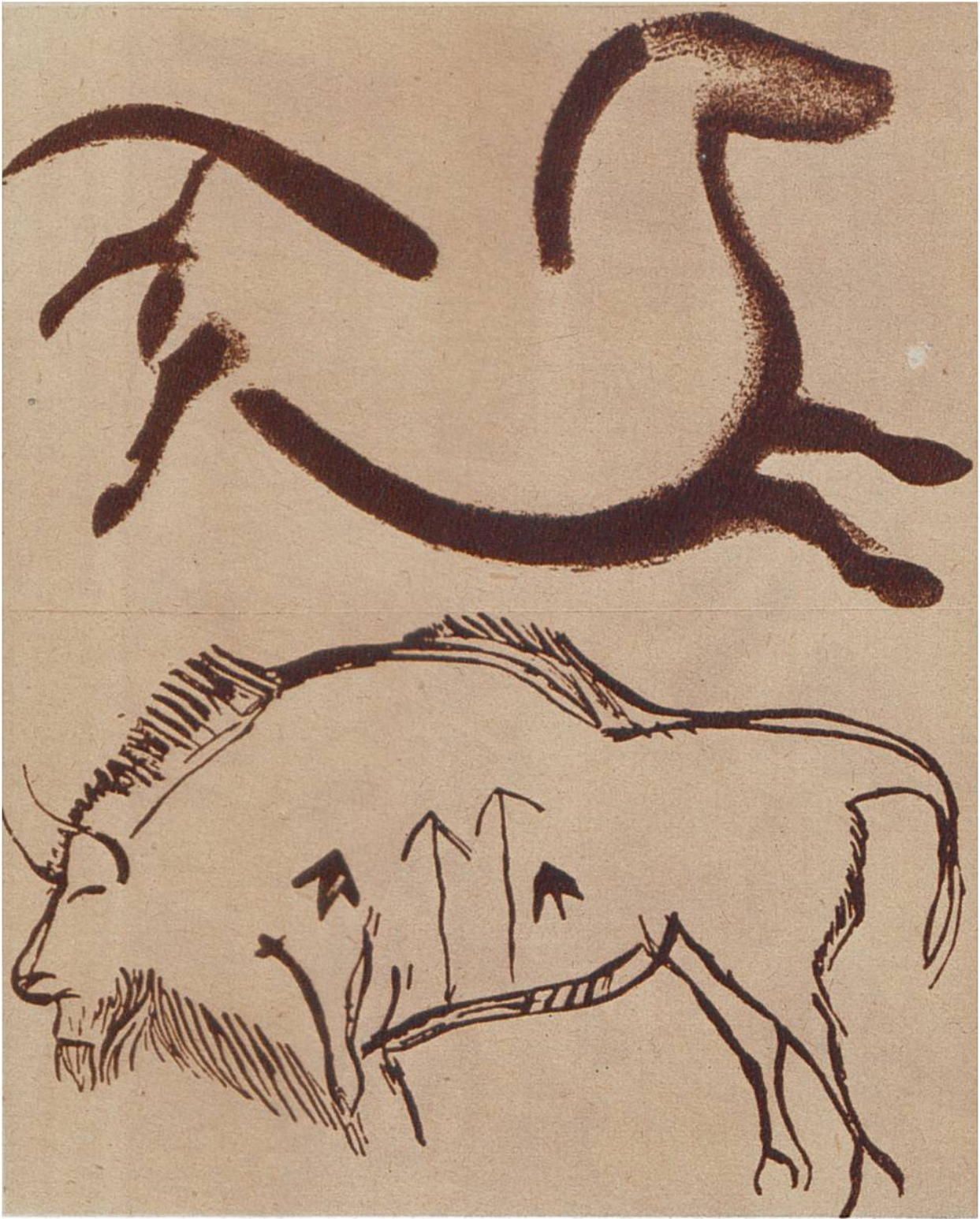
Galoppierendes Pferd und durch Speere verwundeter Bison. Wandzeichnungen aus der Altsteinzeit in der Höhle von Altamira, Nordspanien.