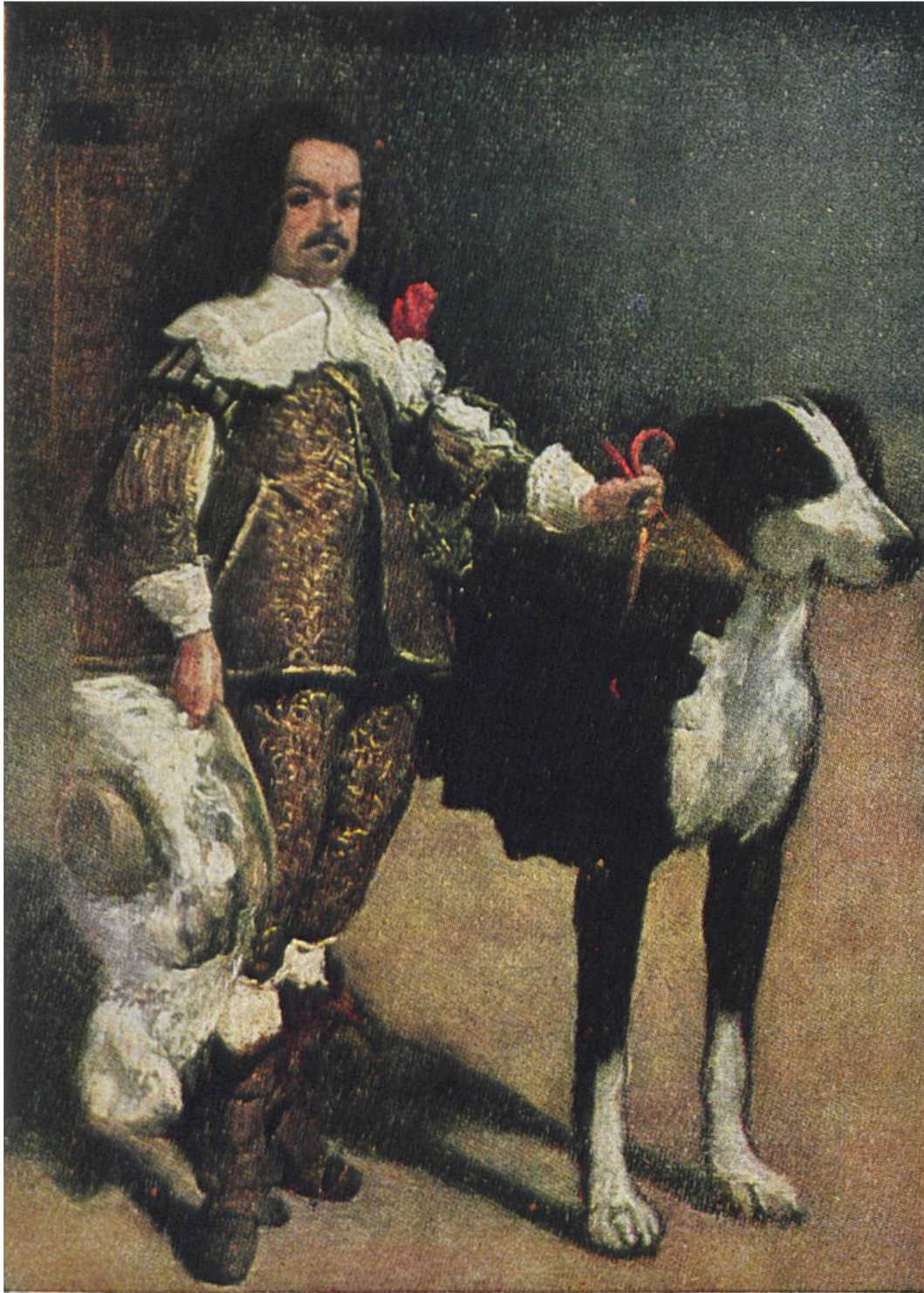
ZWERG DON ANTONIO, DER HOFNARR von Diego Velasquez, Sevilla, 1599—1660.