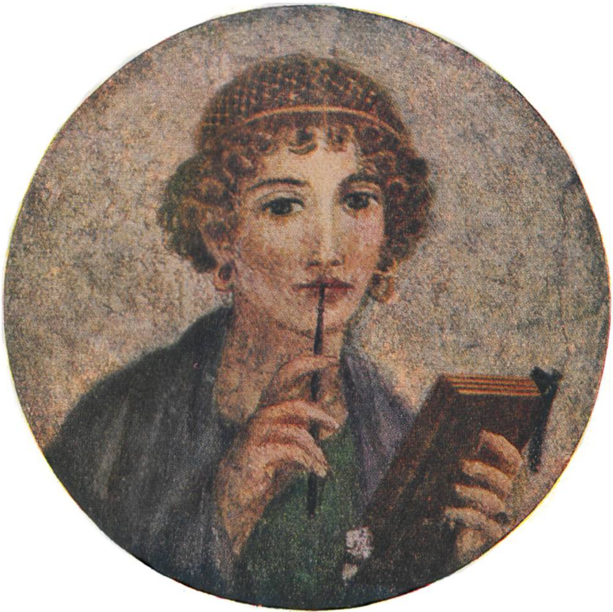
JUNGE RÖMERIN MIT GRIFFEL UND SCHREIBTAFEL Wandgemälde aus Pompeji, etwa vom Jahre 70 nach Christus.