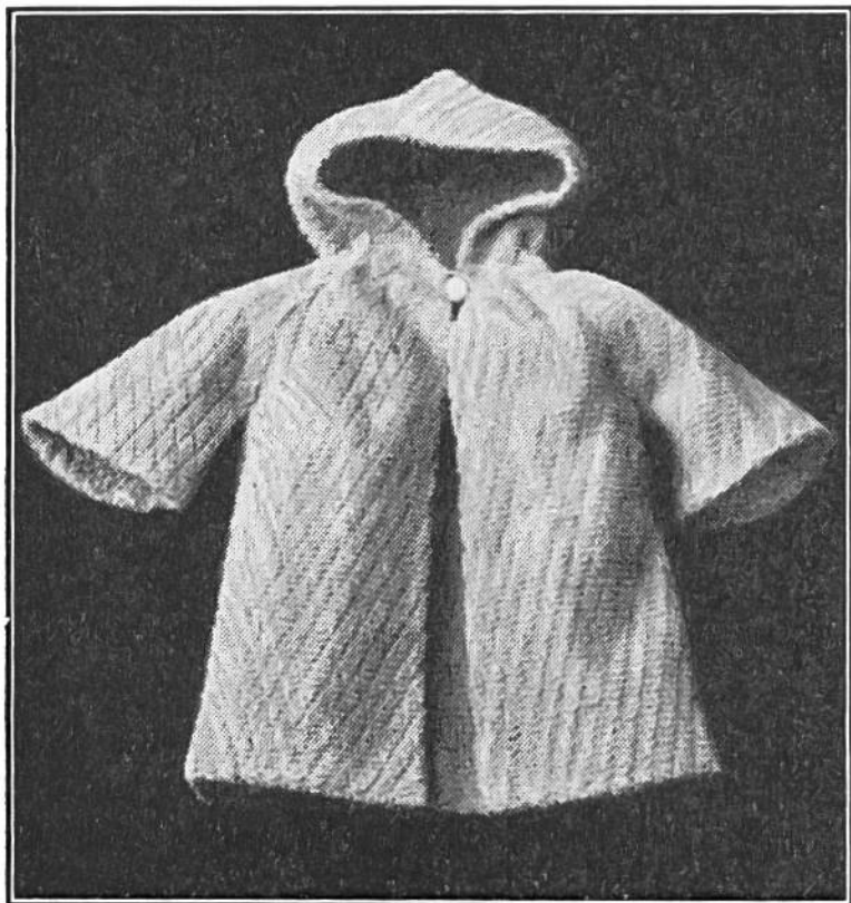
Bademantel mit Kapuze für die Puppe. hält ein gedrehtes oder gehäkeltes Cordon den Mantel zusammen.

untere Rand 2 cm breit umgebogen werden. Die Halslinie wird auf ca. 18 cm zusammengezogen, der Puppe entsprechend, und mit dem in Falten gelegten Rand der Kapuze mit einer Grundnaht zusammengenäht. Mit dem Nahtteil der Kapuze wird die Naht flach sauber gemacht. Oben schliesst der Mantel mit Knopf und Öse, in der Taille