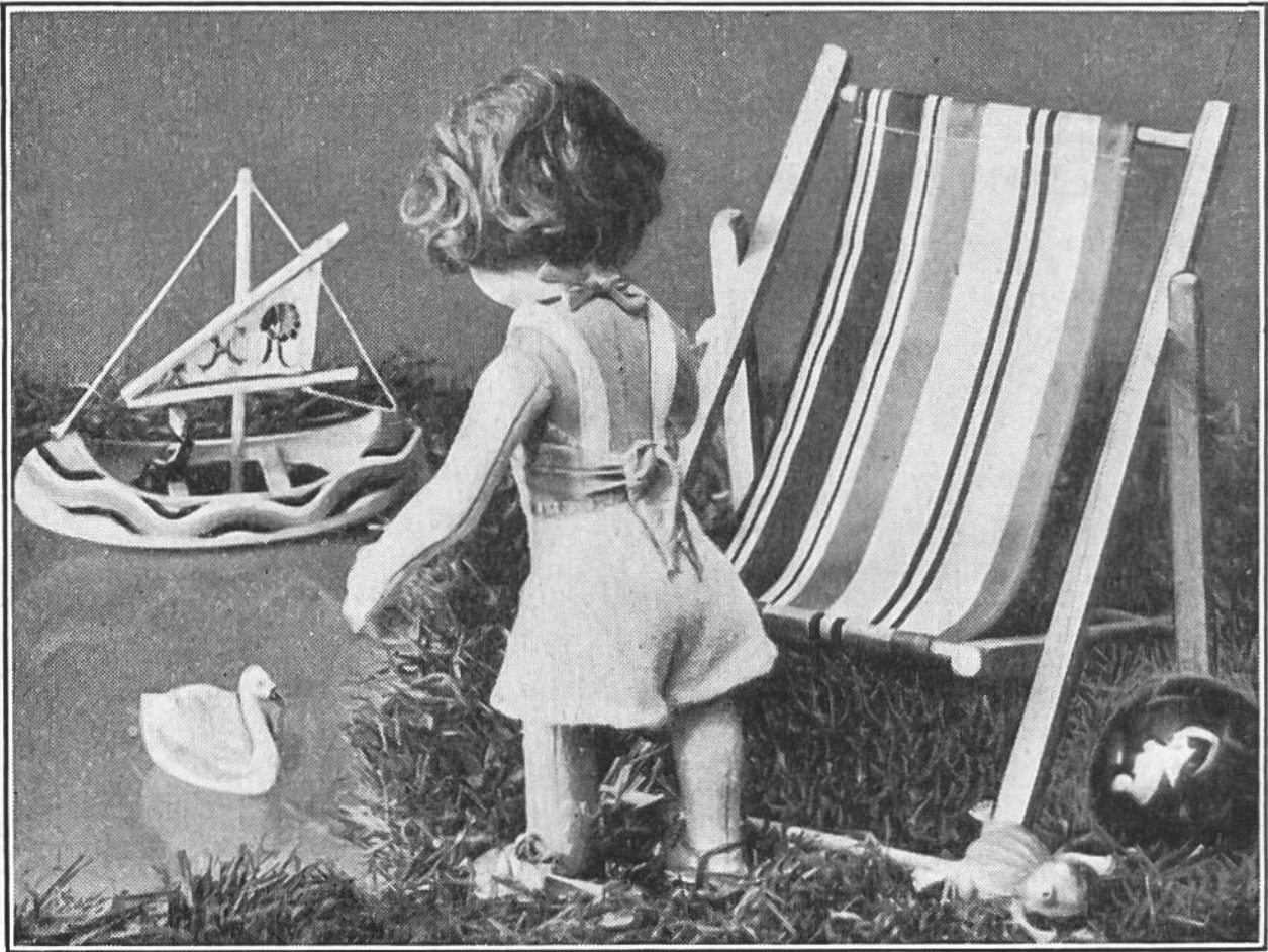
Vreneli im Strandkostüm.