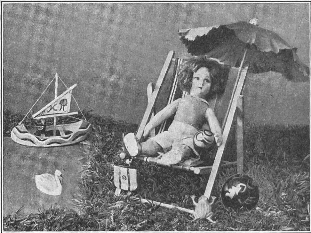
Nach dem Spiel am Badestrand lässt sich's gut ruhn.

Strandschuhe. Nach dem Muster für den Strandschuh sind 4 Teile aus starkem Baumwollstoff zuzuschneiden und ringsum umzubiegen. Zwei solcher vorgerichteter Sohlen werden genau aufeinandergelegt und dem Rand nach mit Überwindlingsstichen zusammengenäht. Um den Sohlen mehr Festigkeit zu geben, müssen diese in längs und schräger Richtung eng aneinandergestept werden. Mit Florgarn, in der Farbe des Brusttuches, sind Bändchen zu häkeln, das eine quer über die Zehen, zwei andere werden von der hintern Mitte nach vorne ums Bein gebunden.