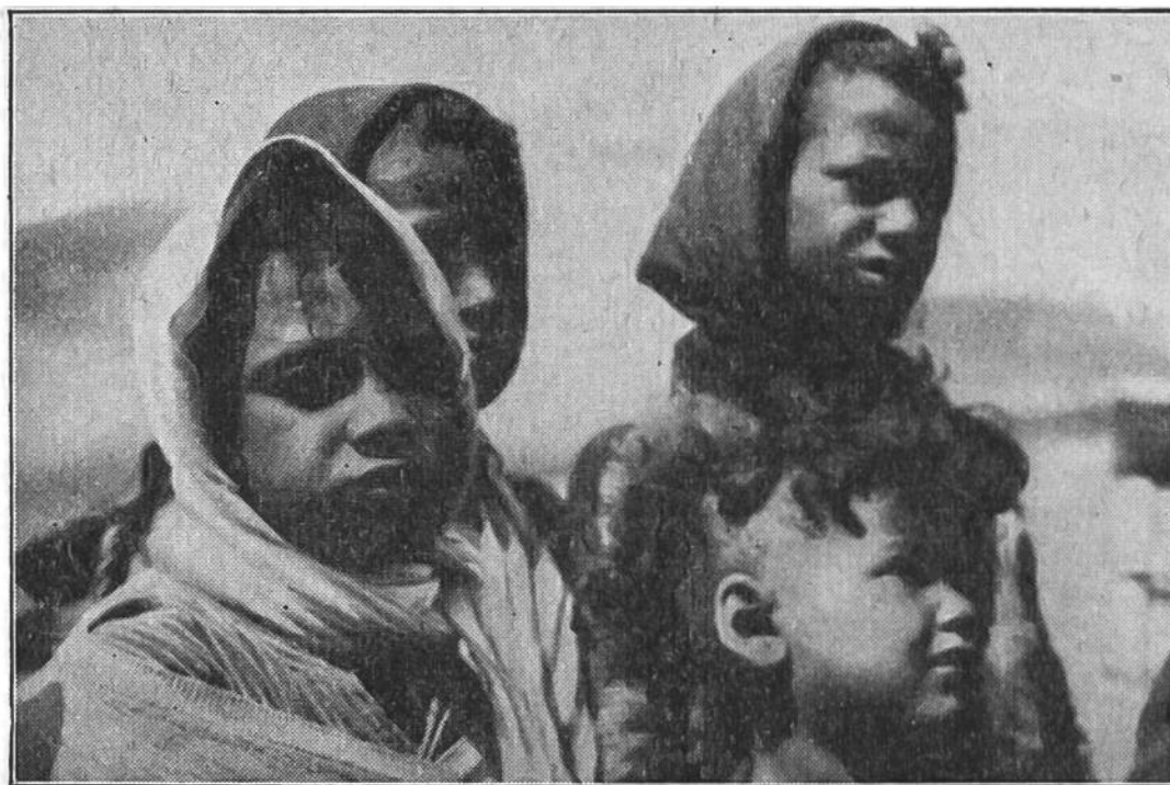
Malaria kranke Kinder. Um sie wieder gesund zu machen, behandelt sie der Arzt mit dem vom Chinarindenbaum stammenden Chinin. Es ist das einzig wirksame Mittel gegen Sumpffieber.

kranken wirken kann. Es ist das aus der Rinde des Chinarindenbaums gewonnene Chinin. Der Kranke nimmt es ein; so gelangt das Chinin in sein Blut, wo es den bösen Malaria-Schmarotzern arg zusetzt und vielen von ihnen den Garaus macht. Häufig gelingt es mit Hilfe des Chinins, die unheimlichen Feinde samt und sonders auszurotten. Dann ist der Kranke vollständig geheilt.