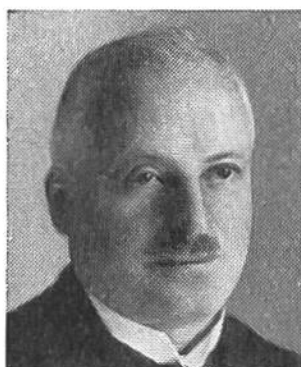
Dr. Gius. Motta von Airolo * 1871, seit 1912 im Amte Polit. Departem.