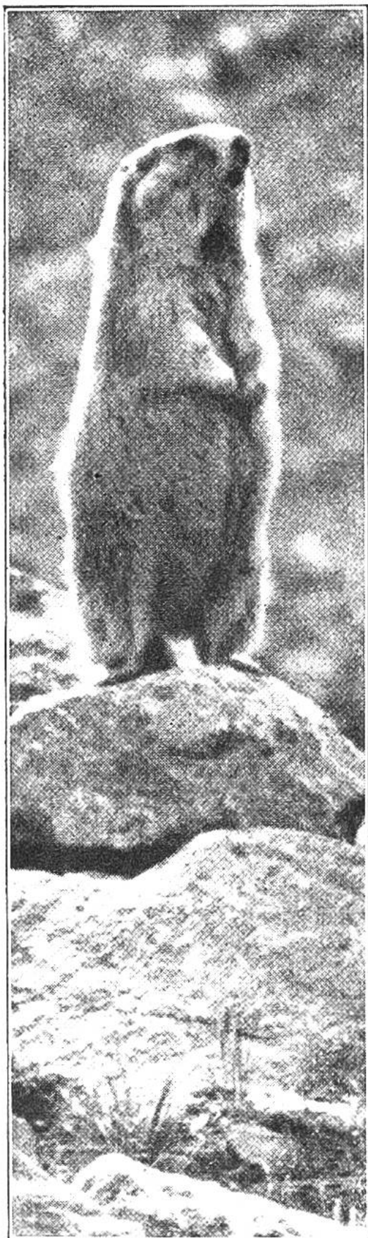
Ein Murmeltier macht das „Männchen“, es „sichert“, späht und wittert rundum. Gleich es so nicht dem Eisbär, seinem grossen Bruder, der auch das Leben meist in Schnee und Eis verbringt?

uns helle Pfliffe, und schon liegt der Tummelplatz der Tierchen verlassen da. Für ihr feines Gehör sind diese geflüsterten Worte schon zu laut gewesen. Wir gehen nun zu den Löchern, worin die Murmeltiere so plötzlich verschwanden. „Das sind“, so erklärt der Jäger, „die Sommerwohnungen der Murmeltiere, wo sie die paar warmen Monate hausen. Ihre viel geräumigeren Winterwohnungen liegen stets tiefer im Gebirge und werden mit Heu, das sie selbst ernten, gut und warm ausgepolstert. Mindestens zwei Drittel eines Jahres verbringen diese sonderbaren Tiere schlafend in den Winterwohnungen.“