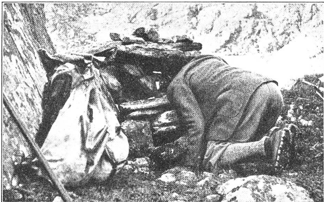
Nach stundenlangem, bewegungslosem Lauern hinter einer selbstgebauten Schanze, welche nur 15 m von den Murmeltierwohnungen entfernt ist, bekommt der Photograph die scheuen Tierchen endlich zu Gesicht.

ohne selbst von ihnen gewittert zu werden. Dort strecken einige vorsichtig den Kopf aus ihrem Bau, spähen nach allen Seiten hin und wagen sich schliesslich heraus. Bald folgen weitere. Mit unglaublicher Schnelligkeit beginnen sie das kurze, kräftige Alpengras abzuweiden. Ergötzlich finden wir die jungen Murmeli, welche das „Männchen“ machen und artig miteinander spielen. Nun streckt sich die ganze Gesellschaft mit sichtlichem Behagen an sonnigen Plätzchen aus. Trotz der süssen Mussestimmung gibt keines seine Wachsamkeit auf: In kurzen Abständen äugt jedes der Tierchen in die Runde.