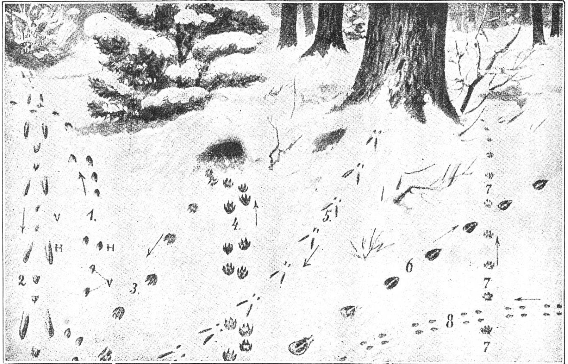
Wildfährten: Spuren im Schnee. 1. Fluchtspur des Hasen. 2. „Das Hoppeln“ des Hasen. 3. Die Fährte des Fuchses. 4. Fluchtspur des Fuchses. 5. Eichhörnchen. 6. Reh. 7. Wildkatze. 8. Hermelin. V = Vorfüsse. H = Hinterfüsse.